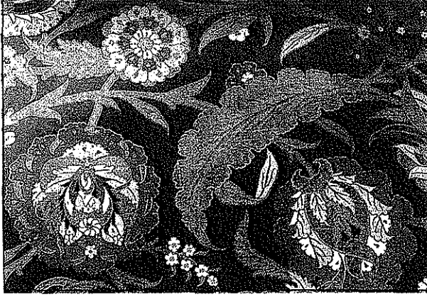
Resim 1. Gülistani kemha, 16. y.y. ikinci yarısı kaftan örneğinden ayrıntı, TSM (Topkapı Sarayı Müzesi, 13/37)

Kemha : Kemha özellikle kaftan yapımında kullanılan bir kumaştır. Atlas ve kutnu ayarında bir kumaş olan kemhanın çözgüsü ve atkısı ipektir. Deseni oluşturan ilave atkısında altın ve gümüş alaşımli tel kullanılır. Kemhada desen çözgü yüzli saten üzerine ipek ve klaptan (x) takviyesiyle oluşturulur. Kalın ve sık dokunuşlu olması nedeniyle üst kaftan yapımı için ideal bir kumaştır (Resim 1).