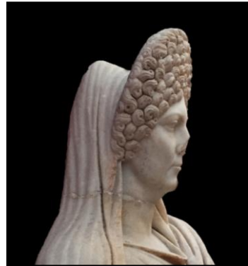
Levha I. Demeter/Ceres tipindeki kadın portre heykeli, Nerva - Erken Traianus Dönemi..