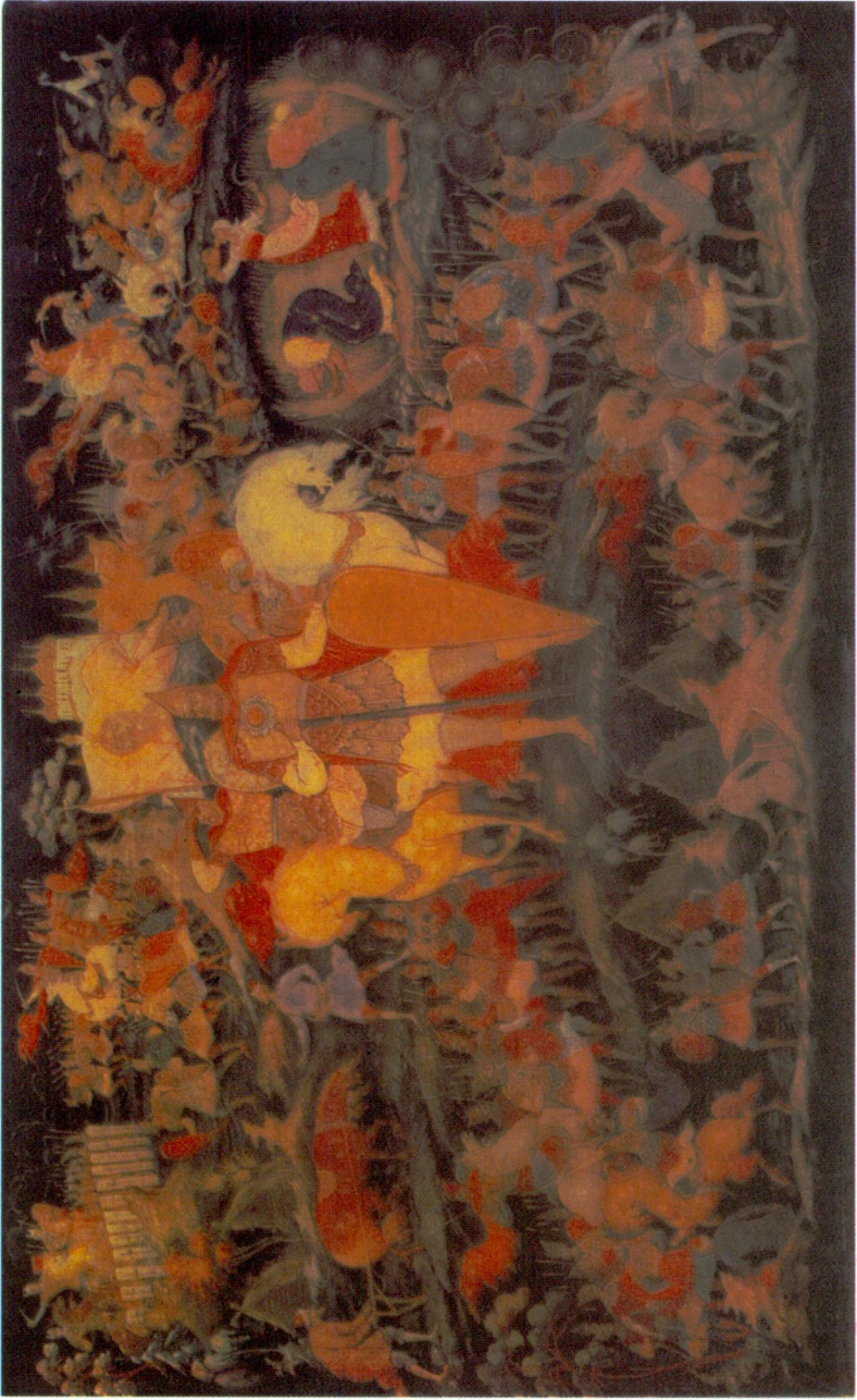
Muallâ Uydu Yücel