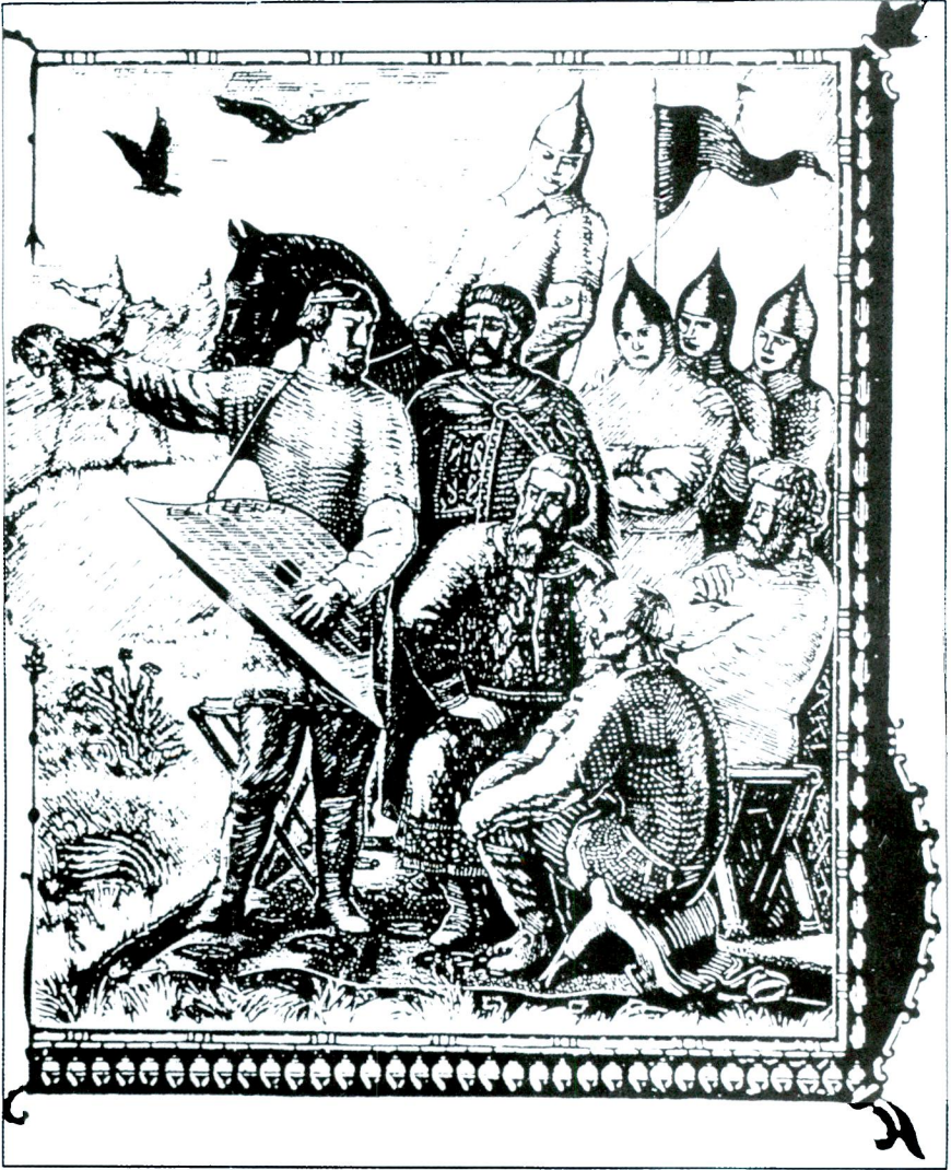
İğor Destanı'na Ait Bir Minyatür