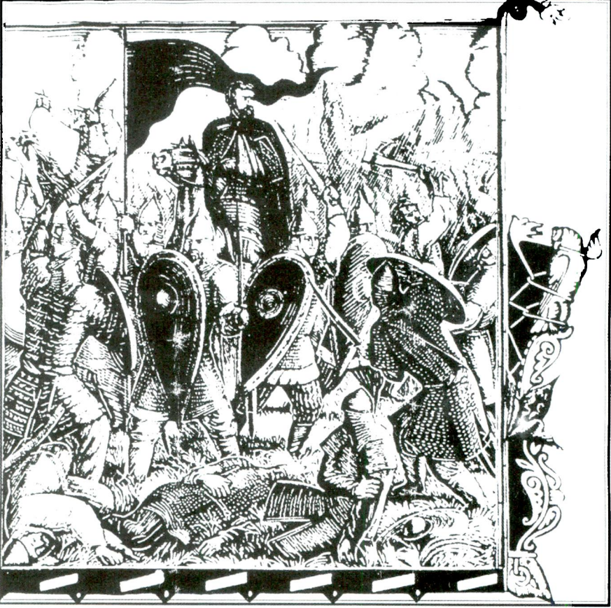
İgor Destanı'na Ait Bir Minyatür (Radzivilov Yılığı'ndan)