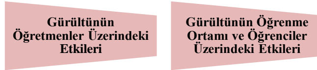
Şekil 5. Gürültünün etkileri

Gürültünün etkileri ana teması altında “Gürültünün Öğretmen Üzerindeki Etkileri”, “Gürültünün Öğrenme Ortamı ve Öğrenci Üzerindeki Etkileri” şeklinde iki alt temaya ayrılmıştır.