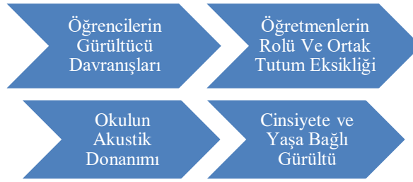
Şekil 3. Bina içi gürültüler

Bina içi gürültüler. ‘‘Bina İçi Gürültüler’’ öğretmen görüşlerinden alınan yanıtlar ile dört grupta toplanmıştır. Bunlar; ‘‘Öğrencilerin Gürültücü Davranışları’’, ‘‘Öğretmenlerin Rolü Ve Ortak Tutum Eksikliği’’, ‘‘Okulun Akustik Donanımı’’, ‘‘Cinsiyete ve Yaşa Bağlı Gürültü’’ dür. Bu sınıflandırmalar aşağıda Grafik 3’de sunulmuştur.