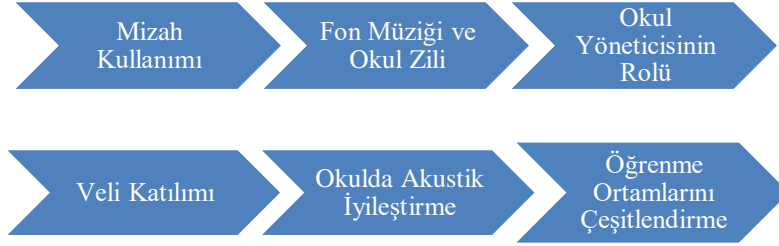
Şekil 9. Gürültüyü azaltma girişimleri ve öneriler

Gürültüyü Azaltma Girişimleri ve Öneriler. Bu gruplandırmada öğretmenlerin gürültüyü azaltmak amacıyla sundukları girişim örnekleri ve önerileri görüşmelerden alınan aktarmalar ile yansıtılmıştır. Bunlar; mizah kullanımı, fon müziği ve okul zili, okul yöneticisinin rolü, veli katılımı, okulda akustik iyileştirme ve öğrenme ortamlarını çeşitlendirmedir.