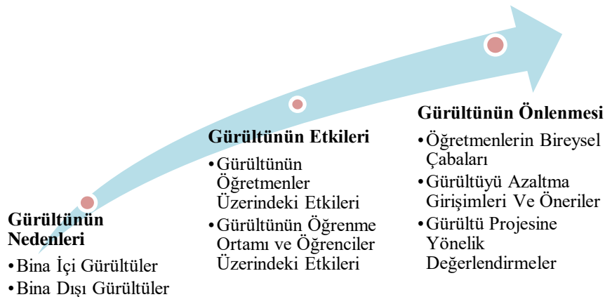
Şekil 1. Okulda gürültü kirliliği

Okulda gürültü kirliliğine ilişkin olarak yapılan öğretmen görüşmeleri üç ana temadan oluşmaktadır. Bunlar ‘‘Gürültünün Nedenleri’’, ‘‘Gürültünün Etkileri’’ ve ‘‘Gürültünün Kontrol Edilmesi’’ temalarından oluşmaktadır. Ana temalar aşağıdaki Grafik 1’de gösterilmiştir.