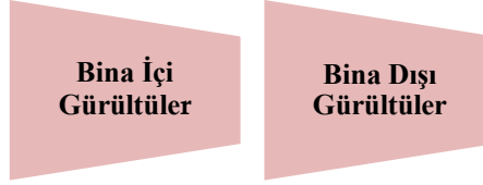
Şekil 2. Gürültünün nedenleri

Okulda gürültünün nedenleri ana teması iki alt temada toplanmıştır. Bunlar ‘‘Bina İçi Gürültüler’’ ve ‘‘Bina Dışı Gürültüler’’ olmak üzere aşağıda sunulmuştur.