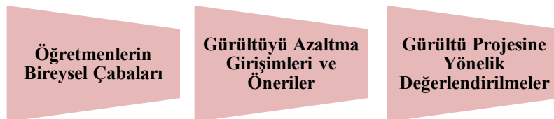
Şekil 7. Gürültünün önlenmesi

“Gürültünün Kontrol Edilmesi” ana teması “Öğretmenlerin Bireysel Çabaları”, “Gürültüyü Azaltma Girişimleri ve Öneriler” ve “Gürültü Projesine Yönelik Değerlendirmeler” alt temaları ile incelenecektir.