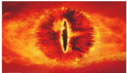
Kaynak: http://liveyourdream-ownyourlife.com/tag/mlm-policy-and-procedure ve http://www.sanatlog.com/etiket/gerilim/

Sauron, J.R.R Tolkien'in yazmış olduğu kitaplarda kurguladığı Orta Dünya evreninin kötü Maia'sıdır. İlk dönemlerde kötülük yapmayan Sauron kitapta anlatılan Orta Dünya'nın, çeşitli dönemlerinde kötü taraflara geçer. Pek çok ırka karşı kötülük yapan Sauron, özellikle yaptığı son savaşta yenilgiye uğrar ve bedenini kaybeder. Tek bir gözden ibaret hale gelir. Ancak ölmez, çünkü gücünün büyük bir