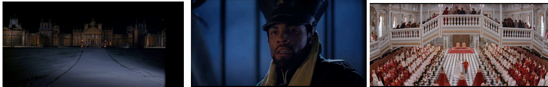
Resim 1-2-3. “Hamlet” Filminin İncelenen Kesitleri

“Başlangıç durumu, kurulu düzenin bozulmasından önce, kişileri, zaman ve uzamın sergilendiği an” 16 olarak tanımlanabilir. Film bir gece vakti Elsinore sarayının dış cepheden görüntüsü ile sarayın önünde gecenin soğukunda nöbet tutan asker ve kral Hamlet’in heykelinin birden canlanmasıyla başlar. Bu sahnede askerin tedirgin hali, bir şeyden korktuğunu anlatır. Nöbet değişiminde son günlerde gördükleri hayaleti kendi gözüyle görmesi için Hamlet’in en yakın arkadaşı Horatio’yu çağırmışlardır. Hayaleti gören ve konuşmaya çabalayan Horatio kendisiyle konuşmayan hayaletin oğlu Hamlet’le konuşacağını düşünür ve bu konuyu ona açar. Tereddütsüz bunu kabul eden Hamlet ertesi gece Horatio ve diğer askerlerle birlikte hayaletin görüldüğü yere gider. Ayrıca bu evrede diğer kişiler de kısaca tanıtılmıştır. Hamlet’in amcası Claudius ölen abisinin karısı Gertrude ile evlilik töreni yapmaktadır.