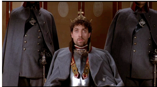
Resim 13. "Hamlet" Filminden Bir Kesit

"Bu evrede, ya başlangıç durumuna dönülür ya da yeni bir durumun başlangıcı ortaya çıkar." 20 Hamlet filmi diğer filmlerden farklı olarak sonuçlanmıştır. Filmde verilen görev, kahramanda dahil olmak üzere sekiz kişinin ölümü ile sonuçlanır; yanlışlıkla öldürülen Polonius, babasının acısına dayanamayıp kendini intihar eden Ophelia, Claudius'un emriyle eski arkadaşlarına kazık atan Rosencrantz ile Guildenstern, filmin sonlarına doğru oğluna anne sevecenliğiyle yaklaşan ancak yeni eşinin oğlunu öldürmek için hazırladığı zehirli şarabı içen Gertrude, yine kralın dolduruşuna gelen Hamlet'i öldürmeye çalışan ancak kendi kazdığı kuyuya kendi de düşen Leartes, kardeşini öldüren ve diğer bütün kişilerin ölümüne sebep olan Claudius ve son olarak bir türlü aklına hükmedemeyen sürekli bahaneler bulup kendisine verilen görevi erteleyen, bir türlü eyleme geçemeyen ve bu yüzden diğer kişilerin dolaylı da olsa ölümüne neden olan Hamlet. Son evrede yeni bir durumun başlangıcı ortaya çıkar. Verilen görev yerine getirilmiş ve tüm krizler çözümlenmiştir. Kral ve prens ölmüş ülke kralsız kalmıştır, ordusuyla Danimarka'dan geçen Fortinbras, Hamlet'in de isteğiyle kral olmuştur. Danimarka'da yeni bir dönem başlamaktadır.