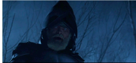
Resim 4-5. “Hamlet” Filminin İncelenen Kesitleri