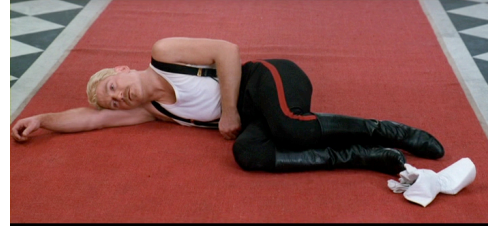
Resim 9-10-11-12. "Hamlet" Filminden İncelenen Kesitler