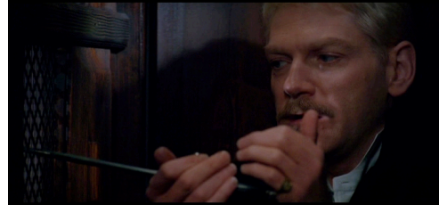
Resim 6-7-8-9. "Hamlet" Filminden İncelenen Kesitler