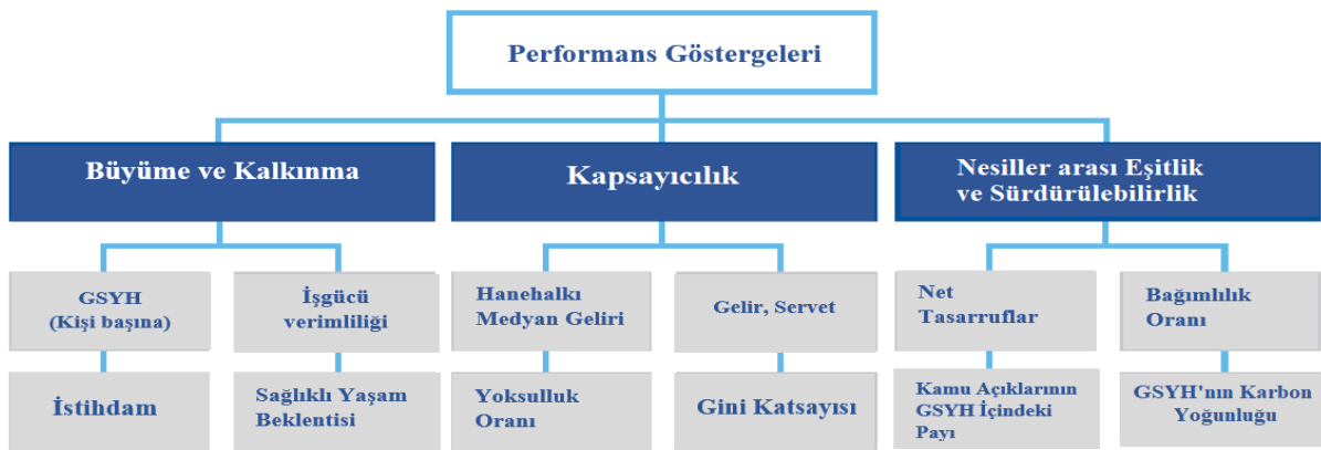
Şekil 1. Kapsayıcı büyüme temel performans göstergeleri

Yaşam standartlarında meydana gelen gelişmeleri değerlendirmek amacıyla bir ülkenin büyüme ve gelişme modelinin kapsayıcılığının göstergesi olan kapsayıcı büyüme performans göstergeleri kullanılmaktadır. Kapsayıcı büyüme performans göstergeleri ekonomik performans ve çevre koşullarının etkinliğinin ekonomik politika alanları içerisinde değerlendirilmesini sağlamaktadır (Samans vd., 2015). Kapsayıcı büyüme hedefine ulaşmak için yaşam standartlarının çok boyutlu doğası göz önüne alındığında GSYH'den daha kapsamlı performans göstergelerine ihtiyaç duyulmaktadır. Kapsayıcı büyüme performans göstergeleri sürdürülebilir kalkınma ve yaşam standartlarındaki iyileşme gibi göstergeleri değerlendirmeye alarak tek başına GSYH'nın sağladığı üretime dayalı ekonomik performans değerlendirmesine kıyasla daha kapsamlı bir resim çizmektedir. Kapsayıcı büyüme performans göstergeleri Şekil 1'de verilmiştir.