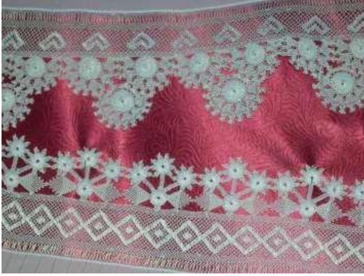
Fotoğraf 7. Yarışmada dereceye giren mevlit başörtüsü oyları; cilveli ve üçlü kiraz.