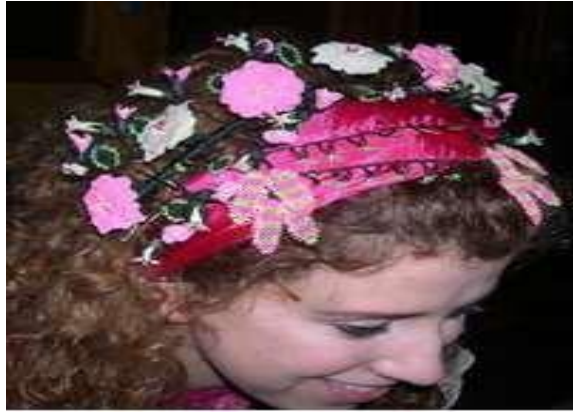
Fotoğraf 1. Taç oyası, Bolu-Göynük, Özel koleksiyon (Soysaldı Arşivi).

yapılan düğümsüz ilmekli örgülerdir. Dolayısıyla “lace” terimi “oya”nın değil “dantel”in karşılığıdır. İğne oyası ise düğümlü ilmekle, ince sık örme tekniği ile tek başına takı veya aksesuar olan ve giyimi ve eşyayı süsleyen bir zanaatın sanata dönüşen örnekleriyle dantelden çok ileridir.