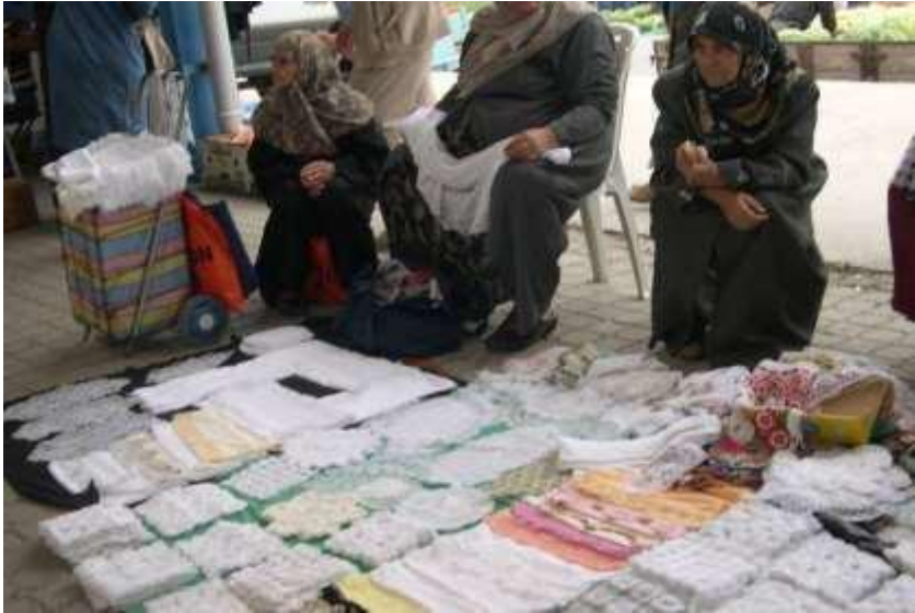
Fotoğraf 5. Göynüklü kadınların oya pazarında iğne oyaları satış sergisi.