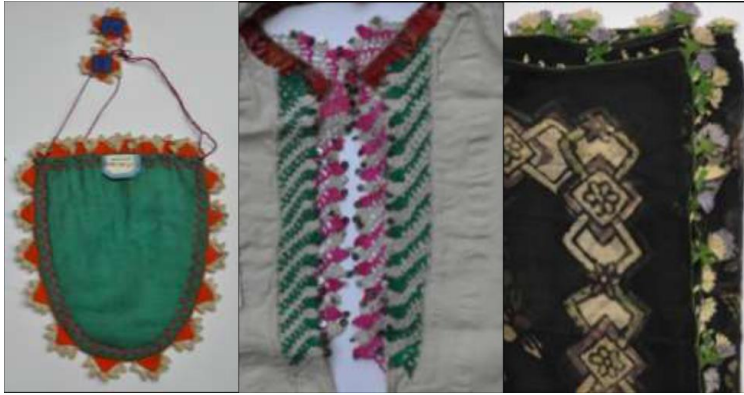
Fotoğraf 2. Oyaly para kesesi, kadın göynek yakalığı ve yazma oyası, Burdur Müzesi (Soysaldı 2013).

İğne oyaları sandık çeyizinin en zarif ve sanatlı işleri olmakla birlikte damat ailesine verilen hediyelerin en değerlileridir. İğne oyaları teknik ve kullanım alanı bakımından iki grupta ele alınabilir. Birinci grup iğne oyaları üç boyutlu, tabiatı kopya eden, ince, katmerli ve çok renkli detaylardan meydana gelmektedir. Oyalar Batı Anadolu giyim-kuşam kültürünün vazgeçilmez ve en belirgin unsurudur. Gelin tacı ve kadın fes oyaları 1 , göynek yakalığı 2 , Zeybek/efe başlığı ve yazma oyaları süsleme ve süslenme elemanı olarak kullanan kişinin statüsünü ve medeni halini ifade eden sembolik anlamlar taşıyan birer takıdır. El sanatlarının ve Türk etnografyasının zirve yapan üstün örnekleri olan bu oyalar birçok müze ve özel koleksiyonlarda yer almaktadır (Fotoğraf 1, 2).