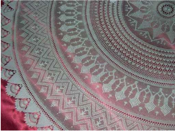
Fotoğraf 8. 2008 yılı oya yarışmasında birincilik alan iğne oyası masa örtüsü detayı.

Gönen’de üç boyutlu iğne oylarının günlük başörtüleri olan yazmalarda ve Şifon kenarlarında bebek yüz örtüsü olarak da kullanıldığı ifade edilmiştir. İki boyutlu iğne oylarının ise mevlit ve namaz başörtüsü