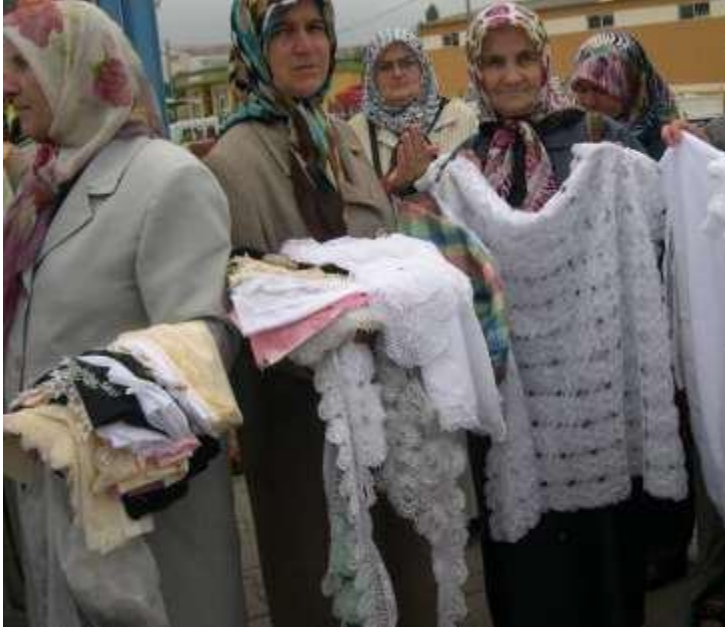
Fotoğraf 4. Oya pazarında Göynüklü kadınlar ve iğne oyası ürünleri.