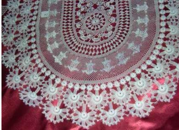
Fotoğraf 9. 2008 yılı oya yarışmasında dereceye giren karanfil örnekli sehpa örtüsü.

İki boyutlu oyalarda ise dut, çark, göbek, köprü tekniği ile motiflerin damar vb. ek süslemelerinde çoğunlukla iplik geçirme tekniği uygulanmaktadır.