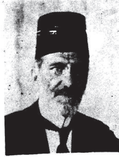
Vali Ali Seydi Bey

Elaziz Valiliğine atanmıştı. Damat Ferit Paşa, 4 Mart 1919 tarihinde Sadrazam olunca İttihadçı olarak bilinen valileri görevinden uzaklaştır-