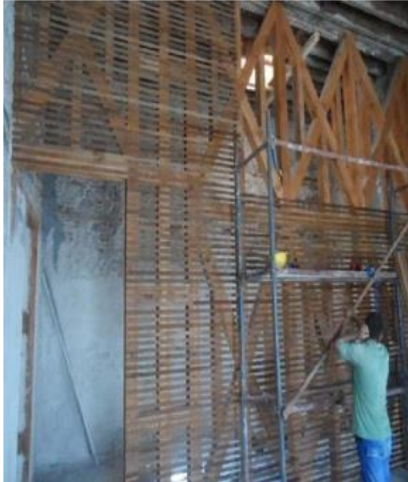
Şekil 5. Dolap kerestesi ile tamiri yapılan bağdadi duvar.

Kelimelerin oluşum sürecinde dilin ihtiyaç duyduğu bazı kavram ya da varlıkların karşılanması mevcut kelime veya kelime gruplarına yüklenmektedir (Alibekiroğlu, 2017). Bu durum özellikle bitki isimlendirmelerinde sıkça karşılaşılan bir durumdur (Uçar, 2013a; 2013b). Yüzlerce bitkinin isimlendirmeleri isimsiz bitkinin çağrışım aralığına ve benzetimine denk gelen keçiboynuzu, kuşburnu, aslanpençesi gibi mevcut kelimelerle karşılanmıştır. Benzer şekilde dolap kelimesinin geniş anlam gücü ile dilin ihtiyacına göre farklı anlam alanlarına akması ve genişlemesi de nesnenin görünüm ve işlevinin çağrışımından kaynaklanmıştır. Bir başka ifade ile dolap kelimesi benzetme ilgisi güdülerek başka varlıkların ve eylemlerin adlandırılmalarında yer bulmuştur.