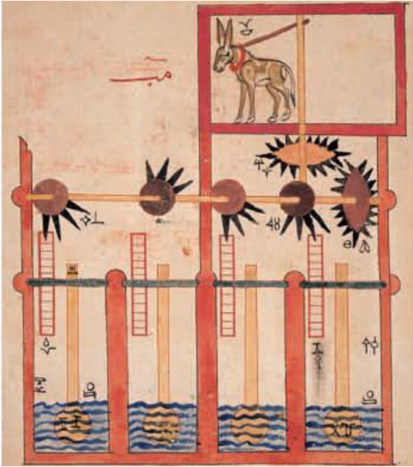
Şekil 2. El- Cezeri'nin dört zamanlı dönen su dolabı çizimi (Sezgin, 2008:20).

Yine İstanbul'un Dolapdere semti, ismini oradaki yeşil bahçelerin sulanması için kurulan su dolaplarından almıştır. Bahçe dolapları, akarsu dolaplarından farklı olarak yatay hareket eden mekanizmadan ibarettir. Dolap beygirinin (at, eşek vb.) mekanizma etrafında dönmesiyle su çıkarılmaktadır. Koşum hayvanının ürkmemesi veya başının dönmemesi için çobanlar hayvanların gözünü bağlayarak çalıştırmıştır (Sökmen, 2010: 33). Bu sistemler, geçmişte öyle geliştirilmiştir ki ünlü bilgin El-Cezeri dört zamanlı dönme dolap tasarlamıştır (Şekil 2). Böylece, koşum hayvanı her turunda bir seferlik su çıkarmak yerine bir turda dört seferlik su çıkarabilmektedir (Sezgin, 2008:20).