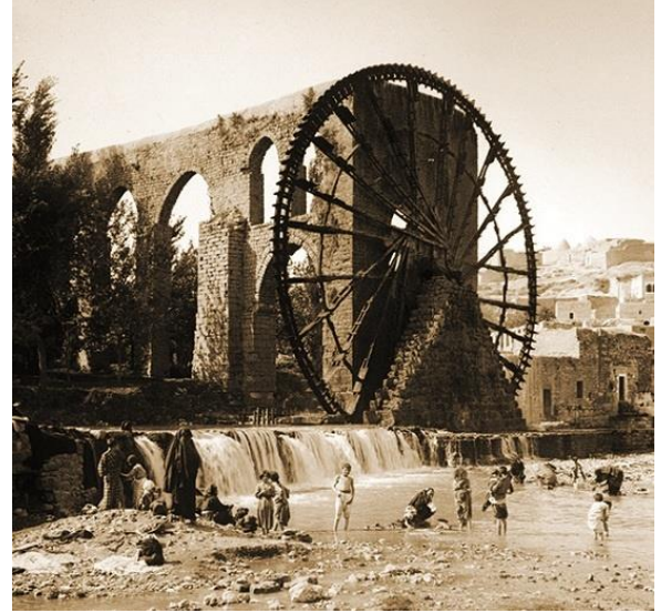
Şekil 1. Suriye-Hama Su Dolabı (Kılınç, 2012:66).

veya dolu olmak) kelimesiyle ilişkili olup olmadığı tespit edilememiştir. Dolap kelimesi Türkçe'den Sırpça'ya "dolap" ve Bulgarca'ya "dolap" şeklinde geçmiştir. Ayrıca, Tietze, Škaljić ve Räsänen gibi yazarlar dolap kelimesinin Türkçe "dolamak"tan geldiğini iddia etmesine karşın Eren (1999:118), bu görüşe katılmadığını belirtmiştir.