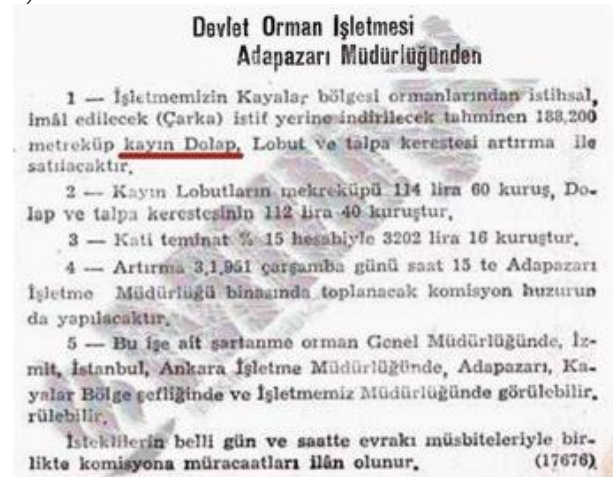
Şekil 4. Açık artırma ihale listesi (Milliyet, 1950).

Cumhuriyetin ilk yıllarında dolap kerestesinin de içinde bulunduğu birçok ürün, Mısır, Suriye, İtalya ve Fransa gibi ülkelere ihraç edilmiştir (Mitat, 1929:4). Henüz betonlaşmanın tam olarak hissedilmediği 1960'lı yıllara kadar geleneksel mimari için dolap kerestesi üretilmiştir. Örneğin Adapazarı Orman İşletme Müdürlüğü tarafından 1950 yılında duyurusu yapılan ihalenin emval listesinde kayın dolap kerestesi mevcuttur (Şekil 4).