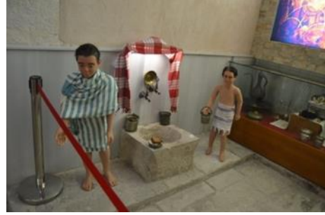
Şekil 13. Hamamda çocuklar bölümünden görünüm

Müzedede, vitrinde ya da vitrin dışında sergilenen eserlerin birbirlerini kaybetmemeleri ve ziyaretçilerin sergilenen eserlerle etkileşime geçerek verimli bir müze ziyareti geçirmelerini sağlaması açısından, eserlerin boyut ve renklerine dikkat edilmiştir. Bunun yanı sıra eğer sergilenen eser duvarda ise duvarın rengiyle, zemindeyse zemin rengiyle ya da vitrin içinde sergilenen eserin diğer sergilenen eserlerle arasında olan renk uyumu göz önünde bulundurularak sergi düzenlemesi yapılmıştır. Müzedede hem renkler arası uyuma hem de sergilenen eserlerle, eserlerin öyküsünün zorunlu kıldığı renklerin birbirleriyle örtüşüyor olması hususuna özen gösterilmiştir. Söz konusu müzedede eserler sergilenmek için müzenin neresinde konumlandırılırsa konumlandırılırsın ısı, ışık, soğuk, sıcak nem, kirlenme vb. gibi ölçütler göz önünde bulundurularak korunaklı bir biçimde sergilenmiştir.