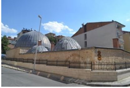
Şekil 6. Tahtalı Hamam Müzesinin kuzeyden genel görünümü

göreğine ait bir ritüeli canlandırmakta ve bu sergileme biçimi klasik müzecilikteki sergilemeye nazaran izleyiciyi daha derinden etkilemektedir.