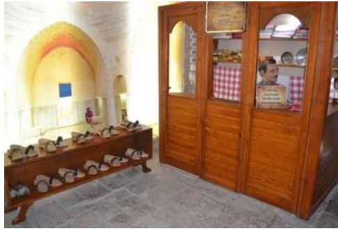
Şekil 14. Hamamcı ve hamamdan görünüm

Müzedede, vitrinde ya da vitrin dışında sergilenen eserlerin birbirlerini kaybetmemeleri ve ziyaretçilerin sergilenen eserlerle etkileşime geçerek verimli bir müze ziyareti geçirmelerini sağlaması açısından, eserlerin boyut ve renklerine dikkat edilmiştir. Bunun yanı sıra eğer sergilenen eser duvarda ise duvarın rengiyle, zemindeyse zemin rengiyle ya da vitrin içinde sergilenen eserin diğer sergilenen eserlerle arasında olan renk uyumu göz önünde bulundurularak sergi düzenlemesi yapılmıştır. Müzedede hem renkler arası uyuma hem de sergilenen eserlerle, eserlerin öyküsünün zorunlu kıldığı renklerin birbirleriyle örtüşüyor olması hususuna özen gösterilmiştir. Söz konusu müzedede eserler sergilenmek için müzenin neresinde konumlandırılırsa konumlandırılırsın ısı, ışık, soğuk, sıcak nem, kirlenme vb. gibi ölçütler göz önünde bulundurularak korunaklı bir biçimde sergilenmiştir.