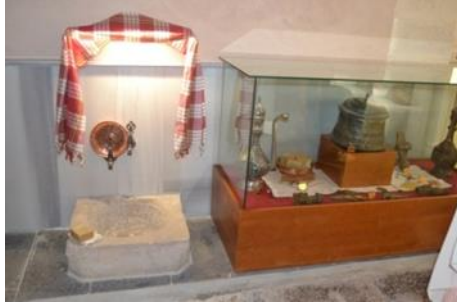
Şekil 12. Hamamdan kurna görünüm

dikkat edilmiştir. Nitekim müze binasının bir hamam olması ve sergilenen eserlerin hamam kültürüne ait olmasından ötürü, yapay ışıklandırmanın yanı sıra binanın kubbesinde var olan aydınlatma pencerelerinin sağladığı loş ışıktan da yararlanılarak daha doğal bir görüntü elde edilmiştir (Şekil 12).