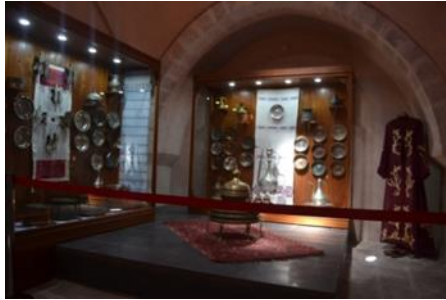
Şekil 8. Hamam Malzemelerinin sergilendiği alan

Tahtalı Hamam Müzesi'nin ziyaretçiler üzerindeki etkisinin-etkinliğinin artmasında eserlerin sergilendiği fiziki ortamın etkisi büyüktür. Müze binasının mimari yapısının, müzenin ve müzedeki koleksiyonların etkisini artırmada ya da azaltmada büyük rol oynadığı söylenebilir. Örneğin bir arkeoloji müzesinin tarihi niteliklere sahip bir binaya ya da etnografya müzesinin geleneksel mimaride inşa edilmiş bir binaya sahip olması, genel olarak müzenin etkisini artırmada etkin olan faktörler arasında gösterilebilir (Buyurgan, Tarlakazan ve Çevik, s. 94). Nitekim Tahtalı Hamam Müzesi, müze binası ile birebir alakalı olan, hamam kültürüne ait eserleri içeren bir koleksiyona sahip olmasından dolayı, müzenin ziyaretçiler üzerinde iz bırakmasına sebep olarak, ziyaretçi sayısını da artırmaktadır. Bu durum sürdürülebilirlik açısından değerlendirildiğinde fiziki ve sosyo-kültürel sürdürülebilirliğin, müzecilik alanında bir araya gelmesinin, müzenin etkisini kuvvetlendiren güçlü bir unsur olduğunu göstermektedir.