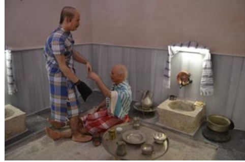
Şekil 2. Zengin hamamından görünüm

Teknoloji çağı olarak adlandırılan günümüz dünyasının etkisinin görüldüğü Tahtalı Hamam Müzesi'nde, akıllı cihazlar ve bunlarla eşdeğer yazılımların neticesinde oluşan çok sayıda yenilikten söz edilebilir. Müzede bilgisayar teknolojilerinin kullanımı özellikle teşhir açısından sanal ortamlar oluşturma ve sergileme yöntemleri içerisinde de sıklıkla kullanılmıştır. Nitekim söz konusu tekniklerden faydalanılan bölümlerden birisi de ziyaretçilerin dikkatini toplayarak, kazandırılmak istenenin daha etkin bir şekilde algılanmasını amaçlayarak, hamam kültürüne ait bir ritüelin canlandırılmasının yapıldığı, popüler bir film karesinden yararlanılan kısımdır (Şekil 1). Yine müzenin ve onun vermek istediği mesajın etkisinin artırılmasında, sensörlü-hareketli heykellerden yararlanılan alanlardan biri de "Zengin Hamamı" bölümüdür (Şekil 2). Bu bölümde, hikâyeleme tekniğinden yararlanılmış ve Osmanlı döneminde konaklarında hamam olduğu halde, halk ile bütünleşmek için evlerine yakın olan çarşı hamamlarında yıkanan "kübera" denilen devlet adamları ya da zenginler canlandırılmaya çalışılmıştır.