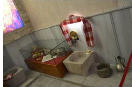
Şekil 9. Hamamdan görünüm alan

Müzedeki eserler vitrin içinde, dışında ya da duvarda sergilenmiş, vitrin duvarları ve eser arası boşlukların ya da vitrin dışında sergileme içinse eserler arası boşluklar, ortamın genişliği ve yüksekliğinin hem esere hem de eserin öyküsüne uygun olmasına dikkat edilerek etkili sunuşlar yapmaya çalışılmıştır.