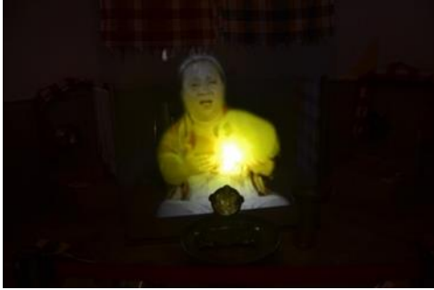
Şekil 1. Hamam kültürü tanıtım videosu