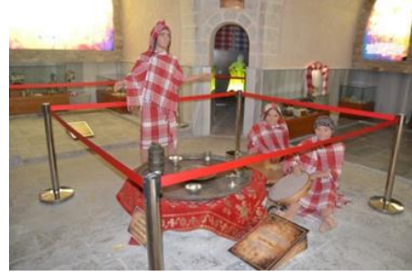
Şekil 4. Gelin aday seçme