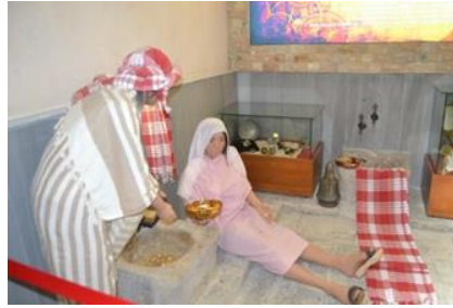
Şekil 5. Gelin hamamından görünüm

Yeni müzecilik anlayışının hüküm sürdüğü Tahtalı Hamam Müzesi'nde özellikle ve öncelikle teşhirde olan eserlerin kavramsal kurgusu yapılmıştır. Bu müzede sergilenecek eserlerin mekân içindeki yerlerinin belirlenmesinde, temaları belirleyen hikâyeler etkili olmuştur. Oluşturulan hikâyenin konusu, sergi tasarım öğelerinin tercih edilmesinde, tasarlanmasında ve sergilenecek eserlerin yerlerinin belirlenmesinde yol gösterici ve serginin gelişimi açısından yönlendirici olmaktadır. Bu sebeple teşhir ile ilgilenen uzmanların, öyküyü, teknoloji ürünlerini, etkileşimli sergi ürünlerini ve diğer tasarım elemanlarını etkili-etkin bir şekilde kullanabilmesi gerekmektedir (Buyurgan ve Buyurgan, 2018, s. 89). Tahtalı Hamam Müzesi sunduğu hamam kültürünü ve o kültüre ait eşyaları, uygun canlandırmalarla en etkili bir şekilde sunmakta ve bu durum izleyicileri o günlere götürerek etkiyi arttırmakta, müzenin amaçlarının gerçekleşmesini desteklemektedir. Eser odaklı sergilemenin hâkim olduğu müzede, sergilenen eserlerin öyküsü ve mesajları en etkili şekilde yansıtılarak, teknolojinin olanaklarından faydalanılmış, özgün teşhir biçimleri geliştirilmiştir. Nitekim müzede kompozisyonlardan biri olan "gelin hamamı" kurgusu, kurna'ya ve etrafına saçılmış altınlarla, içinde altın olan sudan altın kaplama hamam taşıyla yıkanan gelinle anlatılmaya çalışılmış ritüel (Şekil 5), eser ve öykü odaklı sergilemeye önemli bir örnek teşkil etmektedir. Kurgu dönemin gelenek-