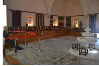
Şekil 7. Tahtalı Hamam Müzesinin ana girişinde yer alan soyunmalık kısmı

Tahtalı Hamam Müzesi'nin ziyaretçiler üzerindeki etkisinin-etkinliğinin artmasında eserlerin sergilendiği fiziki ortamın etkisi büyüktür. Müze binasının mimari yapısının, müzenin ve müzedeki koleksiyonların etkisini artırmada ya da azaltmada büyük rol oynadığı söylenebilir. Örneğin bir arkeoloji müzesinin tarihi niteliklere sahip bir binaya ya da etnografya müzesinin geleneksel mimaride inşa edilmiş bir binaya sahip olması, genel olarak müzenin etkisini artırmada etkin olan faktörler arasında gösterilebilir (Buyurgan, Tarlakazan ve Çevik, s. 94). Nitekim Tahtalı Hamam Müzesi, müze binası ile birebir alakalı olan, hamam kültürüne ait eserleri içeren bir koleksiyona sahip olmasından dolayı, müzenin ziyaretçiler üzerinde iz bırakmasına sebep olarak, ziyaretçi sayısını da artırmaktadır. Bu durum sürdürülebilirlik açısından değerlendirildiğinde fiziki ve sosyo-kültürel sürdürülebilirliğin, müzecilik alanında bir araya gelmesinin, müzenin etkisini kuvvetlendiren güçlü bir unsur olduğunu göstermektedir.