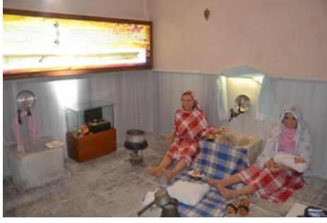
Şekil 3. Kırk hamamı görünümü