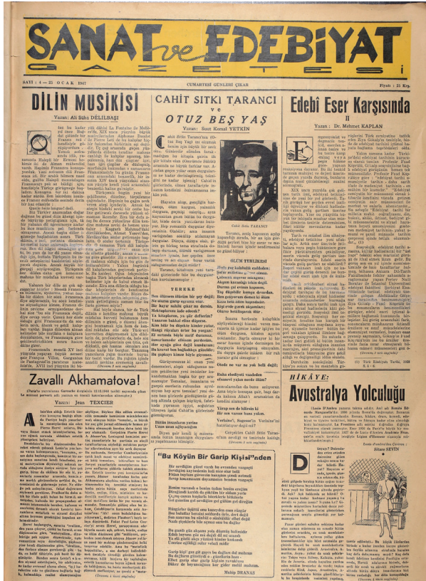
Görsel 1: Gazeteden Bir Örnek (25 Ocak 1947, S.4, s.1)

Gazetenin yayımlanmaya değer nitelikte olmayan yazılara yayın politikası gereği yer verilmeyince, yazı sorunu ile karşı karşıya kalmış; az sayıdaki kaliteli yazıyla bu işin sürdürülemezliği anlaşılmıştı. Hayatlarını başka işlerden kazanan zorunda kalan yazarlar 19 , yazı yazmaya yetecek kadar vakti bulamadığından gazeteye yazı bulmak giderek güçleşmişti 20 .