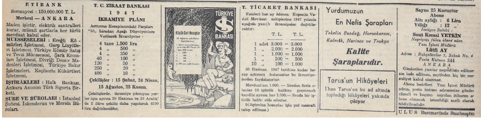
Görsel 2: İkramiye planları, şarap reklamları, abone ve adres bilgisine dair bir örnek (4 Ekim 1947, S.39-40, s.6)

Gazetede düzenli olmasa da bazı sayıların son sayfalarında bir sonraki sayıda yer alacak haber başlıkları ve yazarlarının bilgisine yer verilmiş, okuyucu gelecek sayıdaki içerik için haberdar edilmiştir. İş Bankası, Ziraat Bankası, Ticaret Bankası gibi bazı bankaların reklamları ve ikramiye planları gazetede yer almış, hangi şartlarda ikramiye kazanmaya hak kazanılacağı, ne kadar ikramiye dağıtılacağı, çekiliş tarihi gibi bir takım bilgiler yer almıştır. Banka ikramiye planlarıyla birlikte gazete sayfalarında yer alan az sayıdaki reklamlardan birini de şarap reklamları oluşturmuştur (Görsel 2).