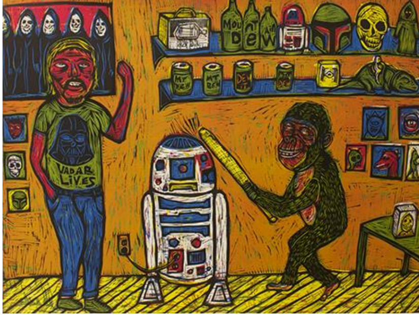
Görsel 8. Sean Starwars, Yıldız Savaşları "BASH", 4 Renkli Yüksek Baskı, 66x89cm, 2013

Charles Bukowski, Bayan Pacman, Phillip Guston ve Neil Blender etkilendiklerim arasındadır. Yol boyunca bir yerlerde, bir sanatçı olarak hedeflerimi, kendimi "geleneksel" baskının titiz saplantılarına köleleştirmeden gerçekleştirebileceğimi fark ettim. Kusursuz çizimler yapmak veya renk plakamı incelemek için yavaşlamıyorum. Oymaları düzeltirim, baskıları patlatırım ve ertesi gün bir sonraki baskıya geçerim. Birincil kaygım hicivli mizah duygusuyla dolu güçlü bir görsel yaratmak, yani komik resimler kullanarak komik hikayeler anlatmayı seviyorum (Rainbird, 2005:140).