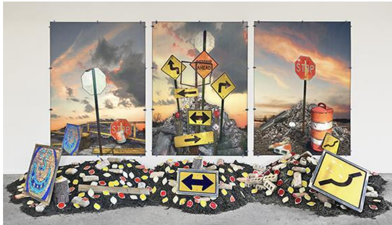
Görsel 3: Randy Bolton, Detour Ahead, Vinil Üzerine 3 Panelli Dijital Baskı, 2018

Bir süredir, çağdaş kültür ve toplum hakkındaki kararsız duygularımı ve korkularımı iletmeyi hedefledim. Son zamanlarda yaptığım büyük ölçekli dijital afiş baskılarım tuvale ve kağıt üzerine daha küçük ipek baskılarım, tarihi bir demokratik ses olarak baskıresim geleneğine dayanırken, çağdaş kamusal söylemin bir aracı olarak disiplini yeni yönere doğru genişletiyor. Nostaljik sirk gösterilerinin cesur biçiminden esinlenen çalışmalarım, çağdaş sosyal, çevresel ve politik meseleleri ve insanlık durumunun daha kişisel temalarını ele alırken geniş bir kitleye ulaşıyor: kayıp, acı ve pişmanlık (Rainbird, 2005:32).