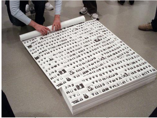
Görsel 1. Félix Gonzalez-Torres, "İsimsiz (Ateşli Silahla Ölüm)", Dijital Baskı, 114.1 cm x 83.6 cm

1980'lerde çağdaş sanatın önemli merkezi olan Amerika'da, politika ve yeni teknolojiler bir araya gelerek sanat üretimi için itici güç oluşturmuştur. Amerika'da geleneksel anlayışlar yeniden önem kazanmış, ağaç baskı ve gravür teknikleri kullanılarak öyküsel anlatım ile insan figürü gibi imgelere geri dönülmüştür (Tallman, 1996). 1990'lı yıllarda yaşanan teknik ve teknolojik gelişmeler sonucunda baskı sanatlarının daha geniş kitlelere ulaşabilmesi için yeni yöntemler aranmıştır. Bu arayış sanatçıları sınırlı edisyon geleneğinin dışında eserler üretmeye itmiş ve baskıresimde yeni uygulamalar keşfedilmiştir. Birçok sanatçı, yeniden üretilebilen, tişört, kâğıt bardak, paket kâğıdı gibi tüketim malzemeleri üzerine çalışmıştır. Hem kitlelere ulaşma amacına uygun olarak hem de ticari basılı materyallerle günlük yaşam içerisine kolaylıkla nüfuz edebilen eserler üretebilme kapasitelerinden dolayı ofset, fotolitografi veya ipek baskı gibi seri üretim için uygun teknikler bu dönemde daha fazla tercih edilmiştir.