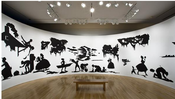
Görsel 2. Kara Walker, Kölelik! Kölelik!, 365x 2590 cm, 1997