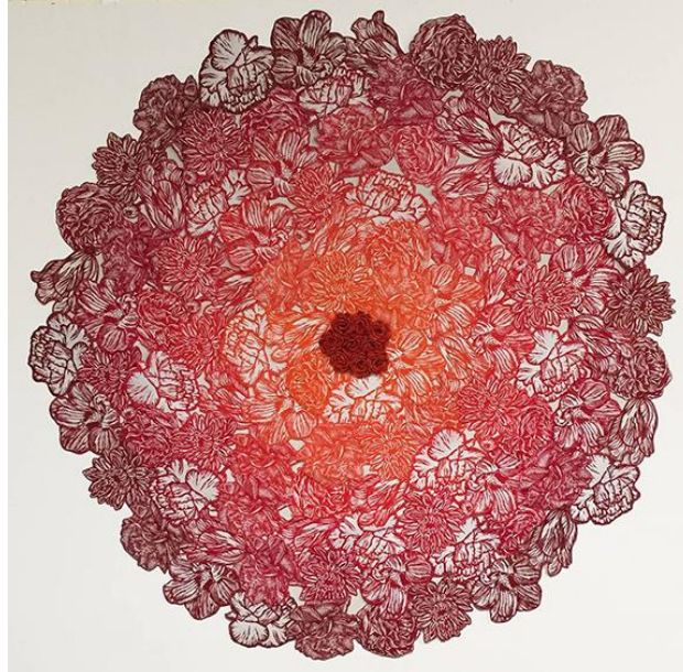
Görsel 7: Melissa Harshman, Kırmızı ve Turuncu, Yüksek Baskı, Dantel; 213,36x213,36 cm, 2017

Bit pazarları, bahçe satışları, antika mağazaları ve kendi kişisel aile fotoğrafları kitaplığım, fotoğraf bankamı sağlıyor. Eski yemek kitapları, sözlükler, not kitapları ve diğer basılı efemera türleri gibi eklektik kaynaklar yeni fikirler önerir ve ilham verir. Bu tanınabilir imgelerin çeşitli yan yana gelmelerinin anlam ve anlatım açısından yeni kombinasyonlar ve kompozisyonlarla değiştirilebileceği farklı yollarla ilgileniyorum. Bu görüntü deposunu taramak ve değiştirmek için bilgisayarı kullanıyorum. Bu, öğeleri hızlı ve kolay bir şekilde hareket ettirmeme, şeffaflık ve ölçek ile hatta renklerle oynamama olanak tanıyor. Geleneksel veya dijital baskı teknikleri aracılığıyla nihai görüntü daha sonra "kutudan çıkarılır". Amacım, estetik açıdan hoş ve kavramsal olarak önemli, genellikle seçilen görüntülerin anlamını yansıtan görüntüler yaratmaktır (Rainbird, 2005: 76).