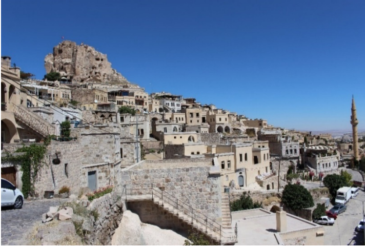
Şekil 1. Uçhisar Kalesi ve etrafı

Uçhisar, Nevşehir'in merkez ilçesine bağlı ve şehir merkezine 7 km uzaklıkta bulunan bir beldedir. 1985 yılında Birleşmiş Milletler Eğitim-Kültür ve Bilim Teşkilatı (UNESCO) tarafından dünyanın Olağanüstü Güzellikte Doğal ve Kültürel Mirası listesine katılmış ve 1986 'da kasabanın çevresinde bulunan ve mevcut konumuyla pek çok turistin doğa yürüyüşlerine ev sahipliği yapan Göreme Doğal ve Tarihi Milli Parkı da koruma altına alınmıştır (Uçhisar Belediyesi, 2020) (Şekil 1).