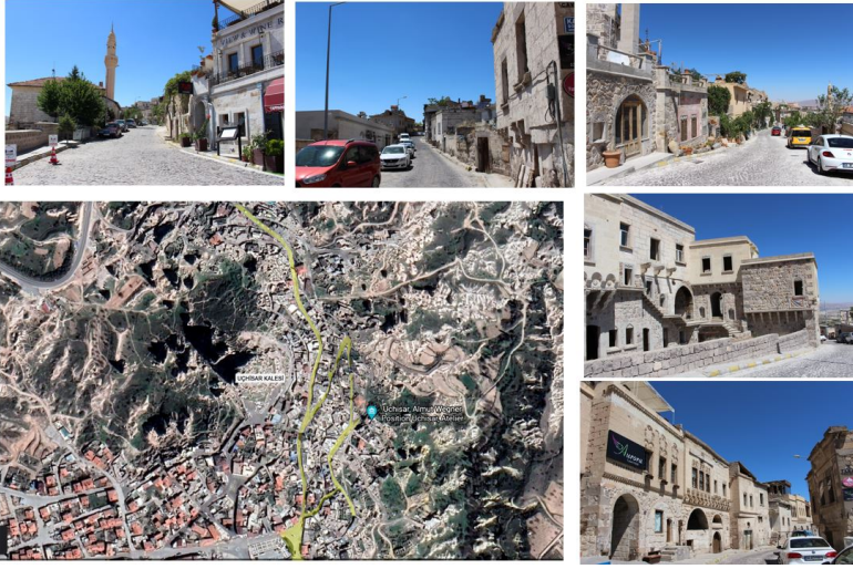
Şekil 3. Alan araştırması için seçilen yol ve etrafındaki otel yerleşimi (Görseller yazının fotoğraf arşivindedir)

Son olarak bölgenin araştırmaya değer görülmesindeki önemli nedenlerden biri de soylulaştırma yaşanan bölgede ortaya çıkan “yer değiştirme” durumudur. Uçhisar’ın kuşbakışı görünümünde, kale etrafı tarihi dokusu sebebiyle eski yerleşim, afet bölgesi sonrası yapılaşmaya açılan yerleşim bölgesi de yeni yerleşim olmak üzere ikiye ayrılmıştır. Bunun yanında kale etrafında gerçekleşen ticari dönüşümün mevcut kullanıcı üzerinde yer değiştirme baskısı yaratıp yaratmadığını araştırabilecek ortam sunması da bölgenin çalışma alanı olarak seçilmesinde etkili bir veridir. Tüm bu veriler ışığında çalışmada yöntem olarak öncelikle fiziksel verileri tespit etmek üzere yerinde gözlem yöntemi kullanılmıştır. Kale etrafında konutların tespiti için alan çalışması otellerin yoğunlukta olduğu bir köy yolu olan Göreme Caddesi’yle sınırlandırılmıştır (Şekil 4). Şekil 4’te gösterilen kale etrafını saran ve çoğunlukla otel girişlerinin olduğu ve birçok otele cephe veren işaretli yol üzerinde halen konut olarak kullanılan otellerin arasında kalmış konutlar tespit edilmiştir (Şekil 5). Saptanan yedi konuttan beşinin içinde en az 30 yıldır bu konutlarda yaşayanlarla görüşmeler yapılmıştır.