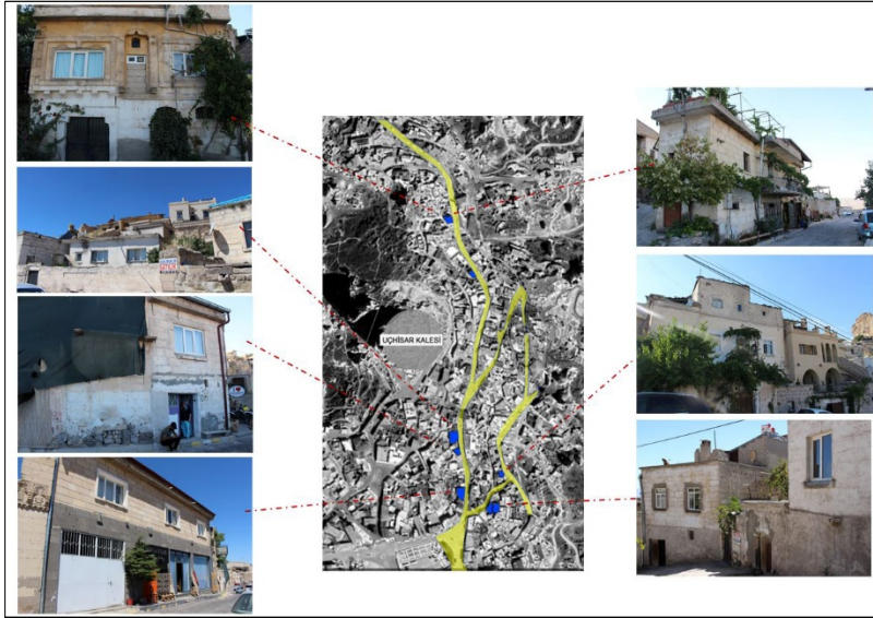
Şekil 5. Seçilen güzergâh üzerinde konut olarak kullanılan yapılar

Konutlara Uçhisar'da kaç yıldır yaşadıkları, taşınmayı düşünüp düşünmedikleri, çevresinde daha önce taşınanların hangi sebeple taşındıklarını, turizmle beraber gündelik hayatlarında herhangi bir baskı hissedip hissetmedikleri, bu bölgedeki değişimler hakkındaki fikirleri ve buraya ait