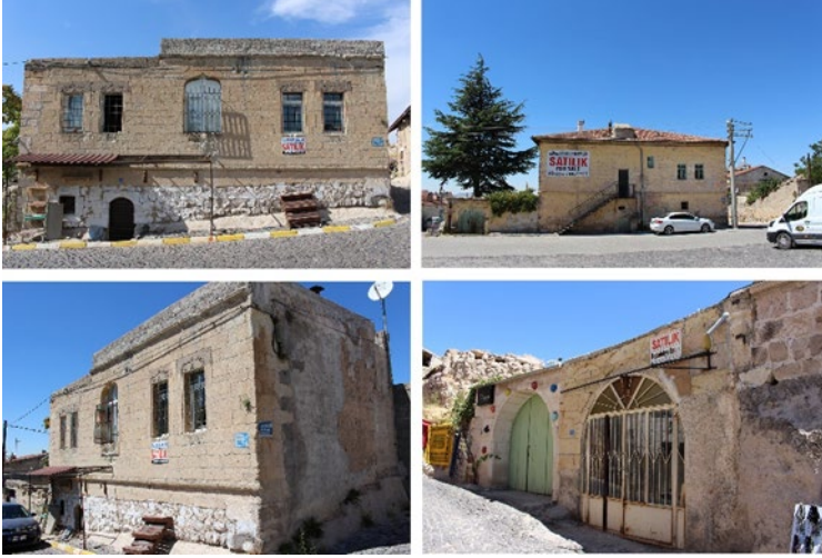
Şekil 6. Uçhisar kale etrafında satılık ilanı olan yapılar

çöküntü halinden kurtulması ve yenilenme sürecinde olması soylulaştırmanın getirdiği olumlu sonuçlardan biri olarak görülmektedir. Bunun yanında hem restorasyon çalışmalarının devam ettiği hem de kale etrafında birçok yapının satılık ilanları ile boş bir şekilde beklediği tespit edilmiştir (Şekil 6).