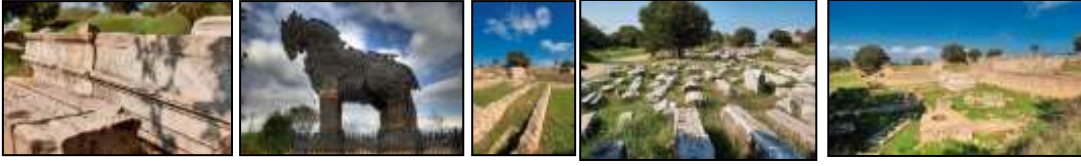
Resim 7.8. Troya Antik Kenti'nden görüntüler (Anonim, 2019d)

UNESCO Dünya Miras Listesi'ne Alınma Tarihi ve Alınma Kriterleri: 1988, (ii), (iii), (vi), Kategori: Kültürel, Yer: Marmara Bölgesi, Çanakkale