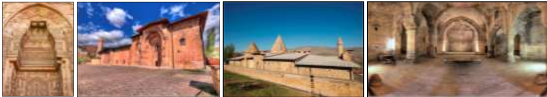
Resim 7.3. Divriği Ulu Camii ve Darüşşifası (Anonim, 2019d)

Minarede ezan sesi, Minberi mekânlar hası Ahmet Şah’ın şâhânesi, Selçuklular âbidesi (Anonim, 2016) olan Divriği Ulu Camii ve Darüşşifası, Resim 7.3. de gösterilmiştir.