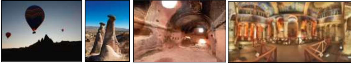
Resim 7.18. Göreme Milli Parkı ve Kapadokya Dünya Miras Alanı’ndan görünümler (Anonim, 2019d)

Göreme Milli Parkı ve Kapadokya; Göreme Milli Parkı, Derinkuyu Yeraltı Şehri, Kaymaklı Yeraltı Şehri, Karlık Kilisesi, Aziz Theodore Kilisesi, Karain Güvercinlikleri ve Soğanlı Arkeolojik Alanı olarak yedi bölüm halinde Dünya Miras Listesi’ne dâhil edilmiştir (Anonim, 2019d). Resim 7.18.’de Göreme Milli Parkı ve sınırları içerisinde önemli alanların fotoğrafları sunulmuştur.