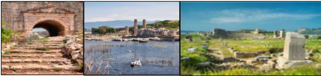
Resim 7.6. Xanthos ve Letoon'dan görünüm (Anonim, 2019d)

Antalya'nın Kaş ilçesine yakın mesafede olan ve UNESCO'nun Dünya Mirası Listesi'ne dahil edilen Likyalıların efsanevi antik şehirleri olan Xanthos- Letoon ile ilgili bilgiler sunulmuştur (Resim 7.6).