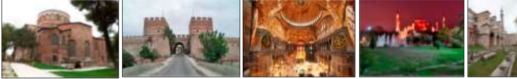
Resim 7.2. İstanbul’un Tarihi Alanları’ndan görünümeler (Anonim, 2019d)

Türkiye’nin ilk Dünya Miras Alanlarından biri olan İstanbul’un Tarihi alanları Resim 7.2.’de sunulmuştur.