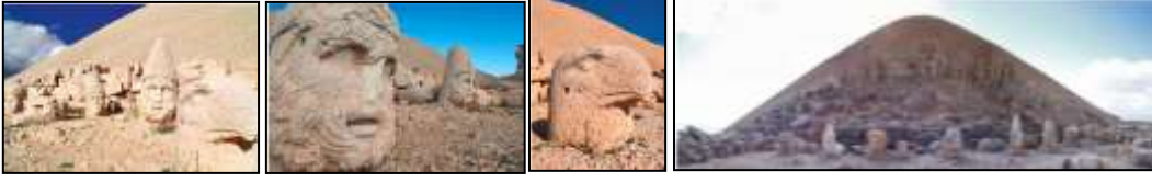
Resim 7.5. Nemrut Dağı'ndan görseller (Anonim, 2019d)

UNESCO Dünya Miras Listesi'ne Alınma Tarihi ve Alınma Kriterleri: 1987, (i), (iii), (iv), Kategori: Kültürel Yer: Güneydoğu Anadolu Bölgesi, Adiyaman