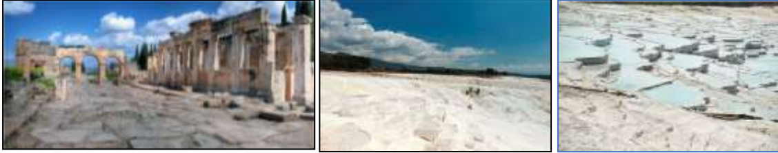
Resim 7.19. Hierapolis Antik Kenti ve Pamukkale Travertenleri (Anonim, 2019d)

Dünyaca ünlü Pamukkale beyaz cennet olarak bilinerek doğal kategoride, Türkiye'nin Dünya Miras Alanı Listesine girmiştir (Resim 7.19).