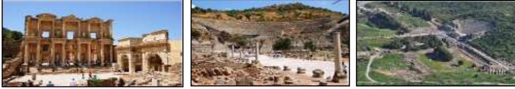
Resim 7.14. Efes Antik Kentinden görünüm (Anonim, 2019d)

Türkiye'nin Dünya Miras Alanı olan, Doğu ile Batı arasında başlıca kapı durumunda olan ve önemli liman kentlerinden biri olan Efes Antik Kentine yönelik fotoğraflar aşağıda sunulmuştur (Resim 7.14.)