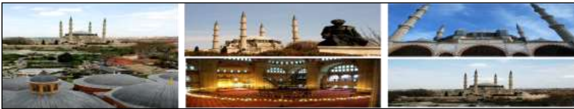
Resim 7.9. Edirne Selimiye Cami ve Külliyesi'nden fotoğraflar (Anonim, 2019d)

Mimar Sinan'ın, “Kalfalığımı Şehzade Camii'nde yaptım. Ustalığımı da Süleymaniye Camii'nde tamamladım. Amma bütün kudretimi bu Selim Han Camii'nde sarf edip, ustalığımı açık seçik ortaya koydum (Çelebi, 1986). Öyle büyük bir cami tasarısı hazırladım ki, Edirne içinde dünya halkının beğenisini kazanmayı hak eder” (Çelebi, 2003) dediği Edirne Selimiye Cami ve Külliyesi, önceden bizlere bir miras alanı olarak o yıllarda dile getirilmiştir ve yapmış olduğu eserleri sunulmuştur (Resim 7.9).