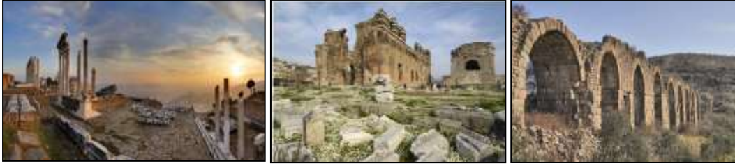
Resim 7.11. Bergama Çok Katmanlı Kültürel Peyzaj Alanı

UNESCO Dünya Miras Listesi'ne Alınma Tarihi ve Alınma Kriterleri: 2014, (i) (ii) (iii) (iv) (vi), Kategori: Kültürel, Yer: Ege Bölgesi, İzmir