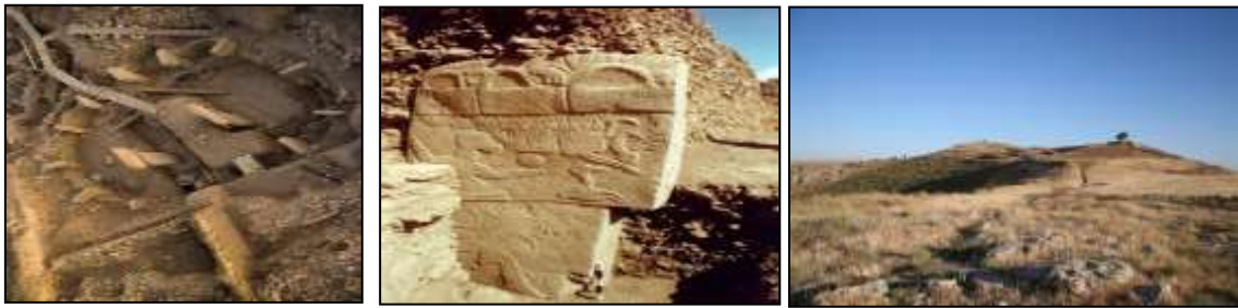
Resim 7.17. Göbeklitepe Arkeolojik Alanından görünüm (Anonim, 2019d)

Şanlıurfa'da bulunan ve tarihin sıfır noktası olarak tanımlanan Göbeklitepe Arkeolojik Alanı, sadece Türkiye için değil, tüm dünya için çok önemli bir değere sahiptir (Resim 7.17).