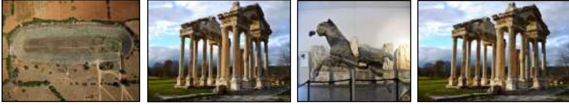
Resim 7.16. Afrodisias Antik Kenti ve Afrodisias Müzesi'nden görüntüler (Anonim, 2019d ve Anonim. 2019i)

UNESCO Dünya Miras Listesi'ne Alınma Tarihi ve Alınma Kriterleri: 2017, (ii), (iii), (iv), (vi) Kategori: Kültürel, Yer: Ege Bölgesi, Aydın