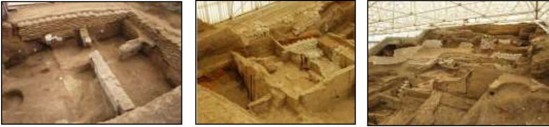
Resim 7.10. Çatalhöyük Neolitik Kenti kazı alanından görünüm (Anonim, 2019d)

Höyük adı farklı yükselteli iki tepesinin çatal şeklinde olmasından dolayı Çatalhöyük Neolitik Kenti olmuş ve Türkiye'nin Dünya Miras Alanları Listesinde yer almaktadır. Resim 7.10. 'da kazı alanından fotoğraflar sunulmuştur.