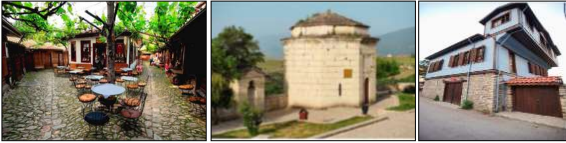
Resim 7.7. Safranbolu şehrinden kareler (Anonim, 2019d)

Türk kentsel tarihinin bozulmamış bir örneği olan Safranbolu Şehri ile ilgili görüntüler Resim 7.7. 'de sunulmuştur.