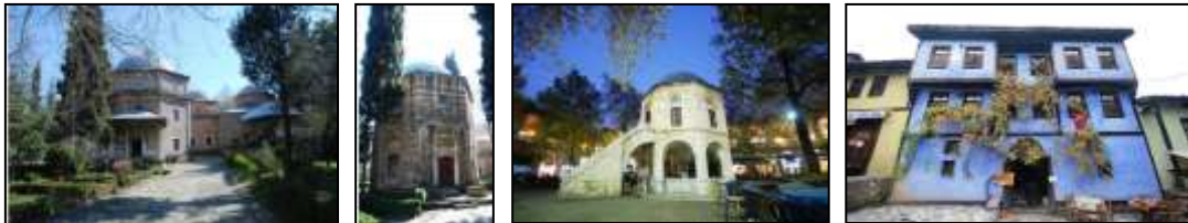
Resim 7.12. Bursa ve Cumalıkızık (Anonim, 2019d)

Osmanlı köy mimarisinin en güzel örneklerini günümüze kadar yaşatan Bursa ve Cumalıkızık, cumbalı evleri, Arnavut kaldırımlı taş sokakları, asırlık çınarları ve misafirperver halkı ile Türkiye Dünya Miras Alanları Listesinde yer almaktadır (Anonim, 2015). Resim 7.12.'de Bursa ve Cumalıkızık' la ilgili fotoğraflar sunulmuştur.