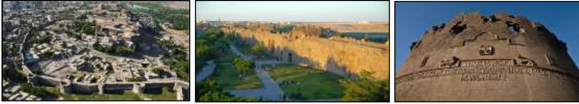
Resim 7.13. Diyarbakır Kalesi ve Hevsel Bahçeleri

Türkiye’nin Dünya Miras Alanı olan Diyarbakır Kalesi ve Hevsel Bahçeleri özgünlüğünü ve 7 bin yıllık tarihsel varlığını sürdürmeye devam etmektedir Resim 7.13. ’de Diyarbakır Kalesi ve Hevsel Bahçeleri ile ilgili alandan görünümeler sunulmuştur.