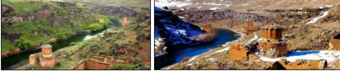
Resim 7.15. Ani Arkeolojik Alanı (Anonim, 2019d)

girmeye hak kazanmıştır. Resim 7.15.'de Ani Arkeolojik Alanı ile ilgili fotoğraflar sunulmuştur.