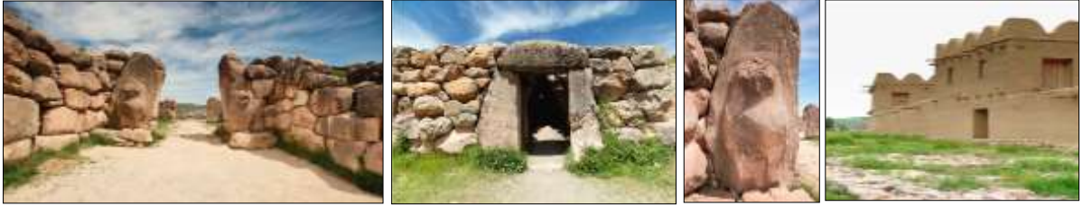
Resim 7.4. Hattuşa- Hitit Başkentinden ara kesitler (Anonim, 2019d)

Bir devrin ihtişamını aydınlatan ve kayalarına geçmişin izleri yansımış olan Hattuşa ile ilgili fotoğraflar Resim 7.4.'de gösterilmiştir.