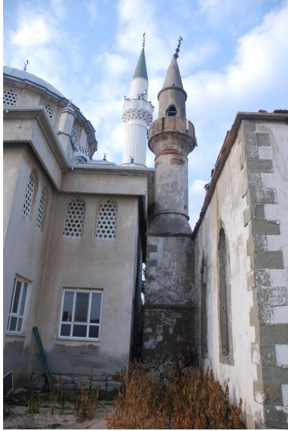
Res. 5: Koyunyeri Köyü Camii, Batı Cephe ve Minaresi