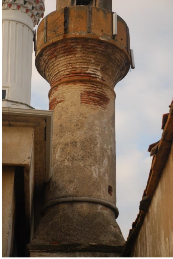
Res. 6: Silindirik Formlu Minarenin Gövdesi