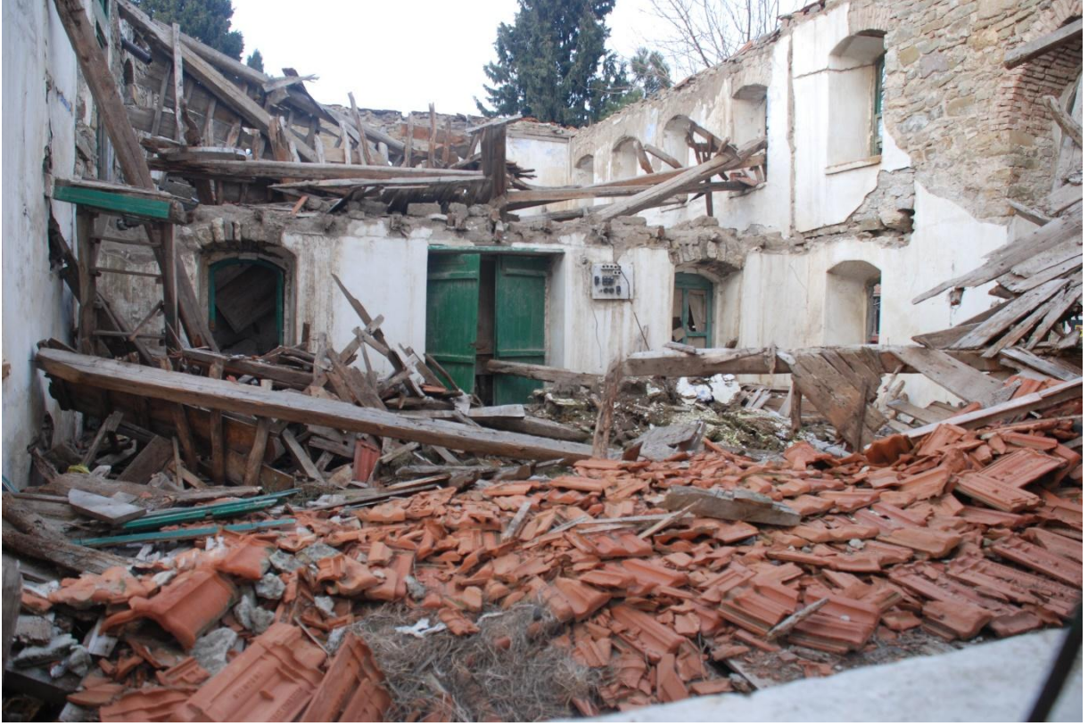
Res. 10: Koyunyeri Köyü Camii, Harimi