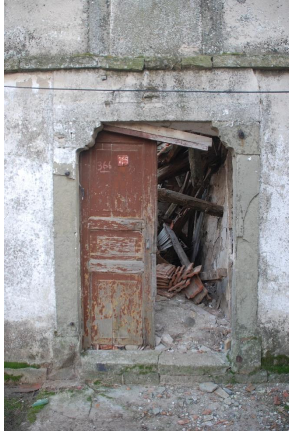
Res. 9: Caminin Giriş Kapısı