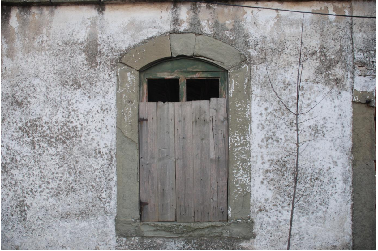
Res. 8: Basık Kemerli Dikdörtgen Pencere Formu