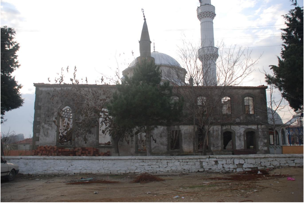
Res. 2: Koyunyeri Köyü Camii, Doğu Cephesi