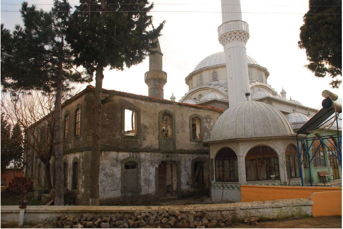
Res. 1: Koyunyeri Köyü Camii, Genel Görünüm