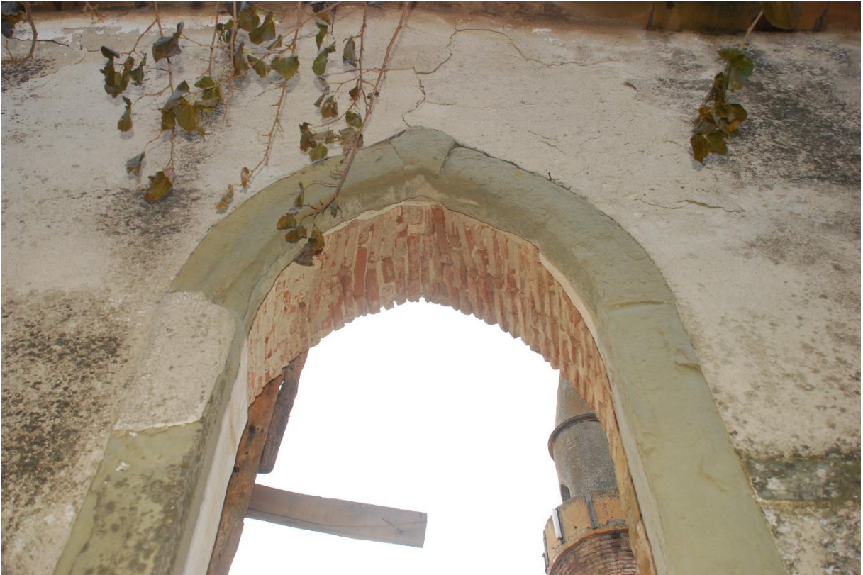
Res. 3: Pencerelelerin Kemer Karnında Tuğla Kullanımı