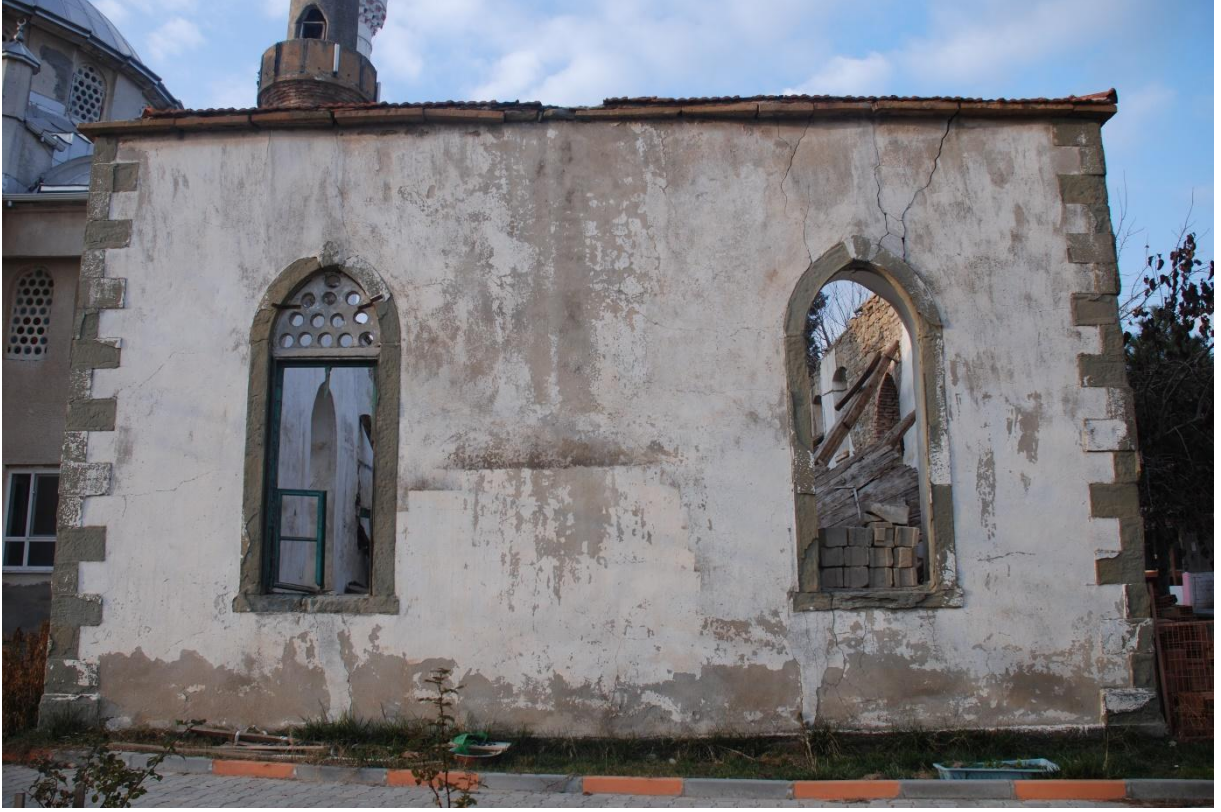
Res. 4: Koyunyeri Köyü Camii, Güney Cephesi