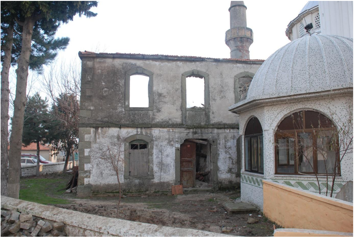
Res. 7: Koyunyeri Köyü Camii, Kuzey Cephe