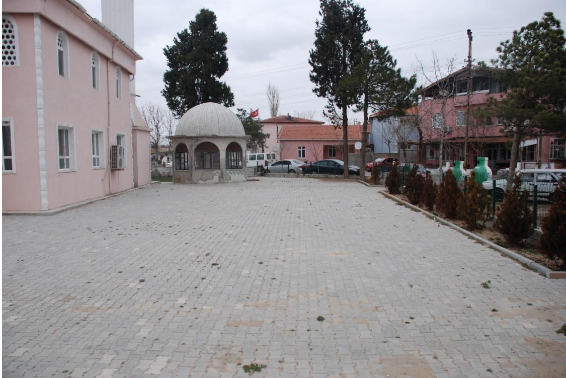
Res. 11: Koyunyeri Köyü Camisinin Bugünkü Yeri