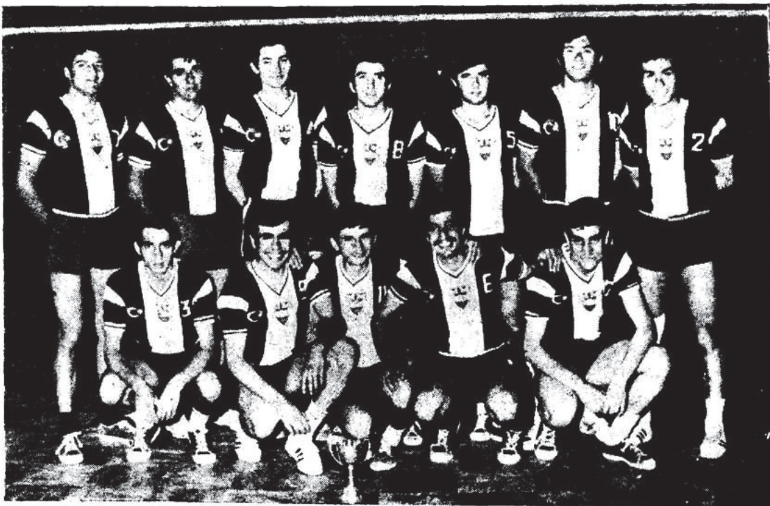
1970 - 1971 Türkiye Şampiyonu olan Mülkiye Voleybol Genç Takımı