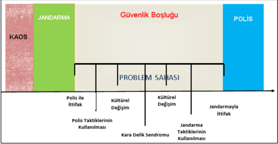
Şekil-2. Kolluk Yakınsama Süreci