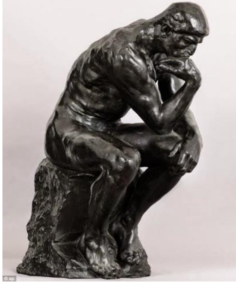
Görsel 7: Düşünen Adam, Auguste Rodin, 1882