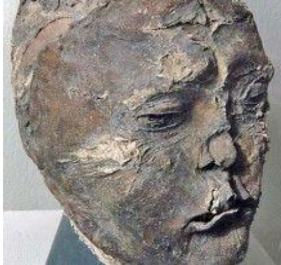
Görsel 4: Pazırık Kurganı Heykel Örneği

Orta Asya'nın Altay Dağlık Bölgesi'ndeki Pazırık Vadisi'nde yer alan MÖ 5. yüzyıla tarihlendirilen kurganlarda ele geçirilmiş çok önemli ve değerli eserlerle birlikte heykellerin de bu mezar yapılarının da aslında krallar ve soylular için inşa edilmiş olduğuna işaret etmektedir (Овчинникова, 1992, s. 206–208; Худяков, 2002) (Görsel 4).