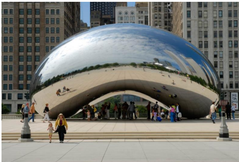
Görsel 8: Anish Kapoor, Bulut Kapı, 2006

İnteraktif olarak bir sanat yapıtı bölgenin en büyük meydanlarından birine yerleştirirken Anish Kapoor, aslında seyircinin hem kendini hem de etrafındaki yaşam alanını heykelin üzerinde görmesini amaçlamış ve sanatçı heykel ile insanların kendileri arasında bir bağ kurmalarını sağlamıştır (Karağaç, 2016, https://indigodergisi.com/2016/10/ansish-kapoor-chicago-bulut-kapisi-heykeli/ ).