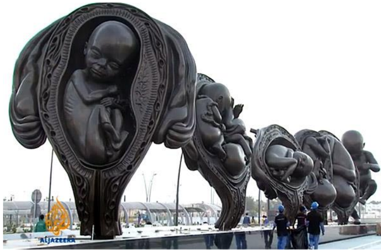
Görsel 9: Damien Hirst Mucizevi Yolculuk, 2013

( https://translate.google.com/translate?hl=tr&sl=en&u=https://gagosian.com/artists/damien-hirst/&prev=search&pto=aue ) (Görsel 9).