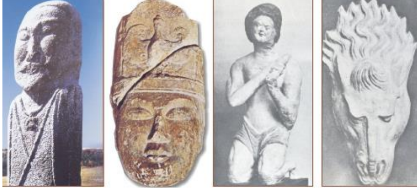
Görsel 3: Göktürk Dönemi Balbal ve Kül Tigin heykeli, Uygur insan heykeli ve Uygur atbaşı heykeli

Moğolistan coğrafyasındaki Göktürk çağından ve 8.yüzyıldan kalma Orhun yazıtlarında geçen balballarda isterse taş heykel, taş insan ya da kişi-taş denilsin, Avrasya steplerine yayılan bu insan heykellerinin, Türklerle ilişkili bir maddi kültür belirtisi olduğuna da şüphe yoktur (Bilici, 2009, s. 6) (Görsel 3).