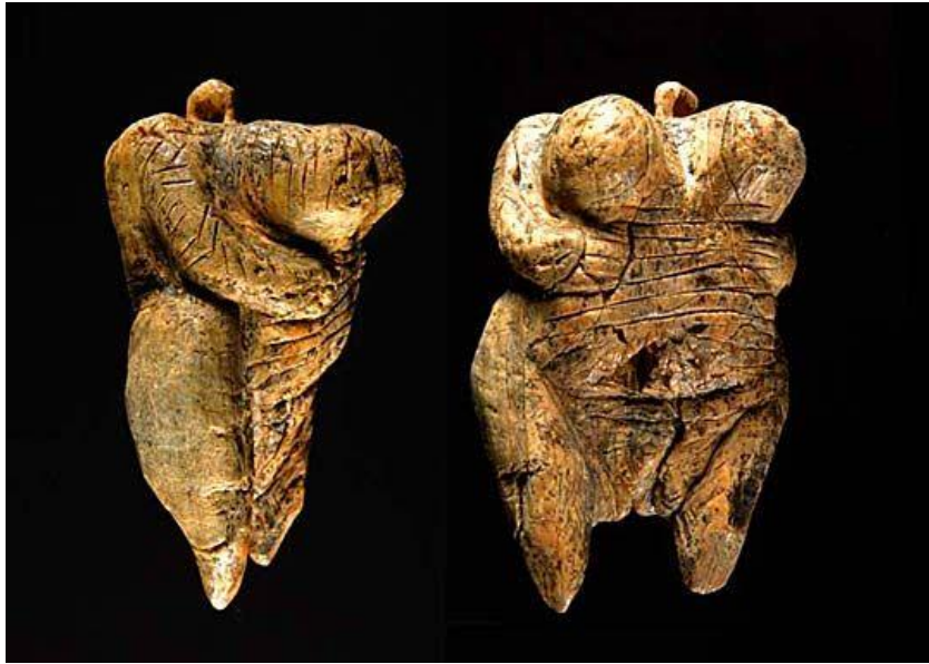
Görsel 2: Hohle Fels, MÖ 35.000

Tarihteki ilk insan heykel figürünün ise çıplak bir kadın olarak betimlendiği görülmüştür. Fakat bu heykelin baş kısmı kayıp olup heykelin de MÖ 35.000 civarında yapıldığı tahmin edilmektedir. Söz konusu diğer bir insan figürü de Almanya'nın "Hohle Fels" mağarasında ortaya çıkmıştır. Bu sebeple bu heykelin "Hohle Fels Venüsü" olarak da adlandırıldığı bilinmektedir ( https://yolvemacera.com/cagdas-heykel-sanatinin-en-ilgincler-orneklere/ )(Görsel 2).