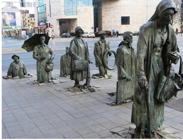
Görsel 13: Yoldan Geçenler, 1981

Yoldan Geçenler olarak adlandırılan heykel, baskıcı komünist rejim süresince kaybolanları anlatıyor ( http://ucankaplumbaa.blogspot.com/2015/09/heykel-sanatndan-hoslanmayan-birinin.html ) (Görsel 13).