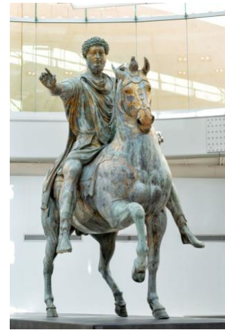
Görsel 6: The Capitoline Museum. Equestrian statue of Marcus Aurelius heykeli 20. Yy.

Miles (1997) ise buna ek olarak heykel sanatının böylece kentsel çevre içinde sanat eseri estetiği ve işlevsel değeri olan bir unsur olarak kent içinde belli bir alanın biçimlendirilmesinde, kullanılarak anlamlandırılmasında etkili olduğunu savunmuştur.