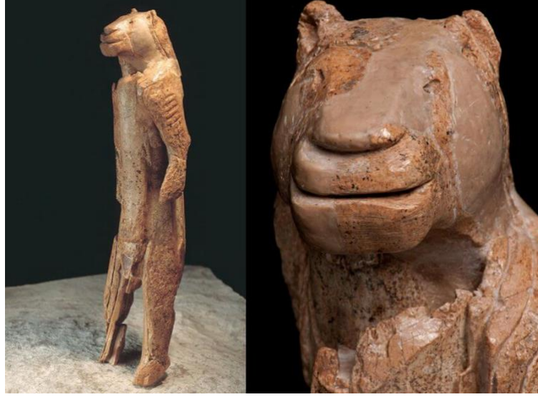
Görsel 1: Hohlenstein-Stadel Aslan Adam, 1939.

Tarihteki ilk insan heykel figürünün ise çıplak bir kadın olarak betimlendiği görülmüştür. Fakat bu heykelin baş kısmı kayıp olup heykelin de MÖ 35.000 civarında yapıldığı tahmin edilmektedir. Söz konusu diğer bir insan figürü de Almanya'nın "Hohle Fels" mağarasında ortaya çıkmıştır. Bu sebeple bu heykelin "Hohle Fels Venüsü" olarak da adlandırıldığı bilinmektedir ( https://yolvemacera.com/cagdas-heykel-sanatinin-en-ilgincler-orneklere/ )(Görsel 2).