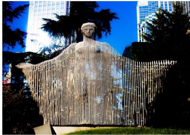
Görsel 14: Akdeniz Heykeli, 1980

Esere bakıldığında (Görsel 13) elinde çantasıyla, bisiklet tekerleğiyle, şemsiyesiyle her kesimden insanın olduğu görülmektedir. Aşama aşama kaybolanların geri döndüğünü ya da aslında onların hiç kaybolmadığı mesajını bize vermektedir denebilir. 1921 yılında Edirne’de doğan heykeltıraş İlhan Koman, dünyaca ünlü heykellerin sahibi olarak Türkiye’nin Da Vinci’si gibi tanınmaktadır. Heykellerinde matematikle sanatı bütünleştiren Koman, keserlerinde zaman ve sonsuzluk duygusunu bir arada vermeye çalışmıştır. Paris, Brüksel ve Stockholm’de birçok eseri bulunan Koman’ın Türkiye’de de en bilinen heykeli 1978-1980 yılları arasında tamamlanan Levent’teki Akdeniz Heykeli’dir. Kollarını açmış bir kadın figürü olarak yapılan bu heykelle kullanılan malzemelerden dolayı sanki uçucu bir hafiflik gösterirken, aslında kesintili dilimlerinden oluşan 112 metal levhanın yan yana getirilmesiyle oluşturularak hareketli bir görünüm elde edilmiştir. Farklı açılardan esere bakıldığında gövdesi sanki dalgalı bir şekle dönüşmektedir (Altaş, 2014, http://birgunbiryerde.blogspot.com/2014/03/istanbulda-akdeniz-heykeli-ilhan-koman.html ) (Görsel 14).