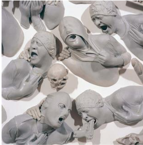
Görsel 10: Lido Rico, 2012

İspanyol heykel sanatçısı Lidó Rico'nun insan figürlü çalışmalarında ise malzeme olarak polyester reçine malzemelerinin kullanıldığı görülmektedir. Çağdaş bir heykel tasarımcısı olan Lidó Rico'nun heykellerinde çoğunlukla insan beynine odaklandığı görülmektedir. Sanatçı eserlerinde insan beyninin hem bilimsel olarak hem de felsefi yönde bir arada yaşamasına özel bir önem vererek insan konusunu ağırlıklı olarak eserlerinde ele almaktadır. Ayrıca sanatçı bireylerin kendi duygusu ile toplumun kültürel kurgusunu, çağdaş bir bireyi istila ediyormuş gibi görünen psiko-sosyal yorgunluklarla eserlerinde birleştirmeye çalışmaktadır. Sanatçının insan portrelerinde yer alan bu dışavurumcu jestleri yanında bu portreler, tek bir kişinin duygusal durumunun da temsili özelliklerini taşımaktadır. Lidó Rico eserlerinde, aslında kullandığı portrelere teatral bir hava verirken gerçekte, dış görünüşleriyle çelişkili olan iki unsuru, gerçeklik ve kurgu arasındaki bir tür gerilimi, çalışmalarının temeline oturtmuştur denebilir (Görsel 10).