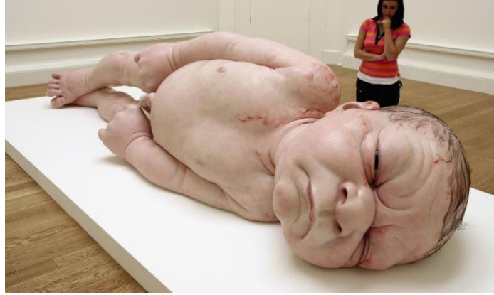
Görsel 11: Ron Mueck, A Girl Sculpture, 2017

Sanatçı, çalışmalarında reçine, cam elyafi, silikon ve diğer çeşitli malzemeleri kullanırken insanoğlu ile bu malzemeler arasında keskin benzerliklere de vurgular yapmaktadır denebilir (Görsel 11).