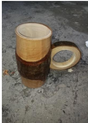
Şekil 15. Kupa (Ahatlar Köyü/Amasra) (Ayrıkça, 2018)