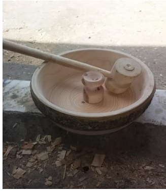
Şekil 17. Fındık kıracağı (Ahatlar Köyü/Amasra) (Ayırksa, 2018)