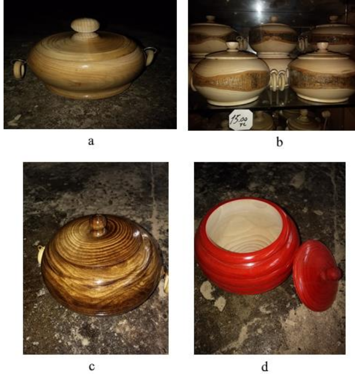
Şekil 7. Kabuksuz şekerlik, b: Kabuklu şekerlik, c: Eskitme boyalı şekerlik, d: Boyanmış şekerlik (Ahatlar Köyü/Amasra )Ayırksa, 2018)

Tornada şekerlik formu alan ahşap daha sonra zımparalanmaktadır. Zımparalama işlemi pürüzsüz yüzey elde etmek için yapılmaktadır. Zımparalanan şekerliğin astar verniği sürülmekte bu işlem, torna üzerinde ya da fırçayla sürülerek yapılabildiği gibi vernik tabancası ile de yapılmaktadır. Astar vernik kuruduktan sonra esas vernik sürülmektedir. Şekil 7’de tamamlanmış şekerliklere örnekler görülmektedir.