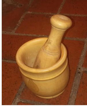
Şekil 16. Havan (Ahatlar Köyü/Amasra) (Ayırksa, 2018)