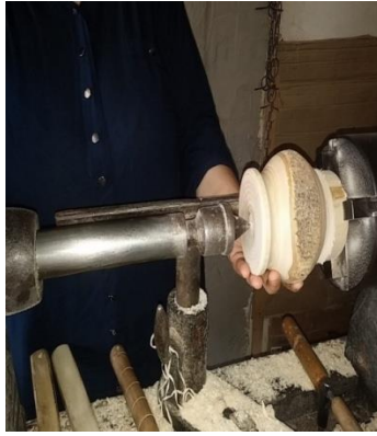
Şekil 5. Tornaya ahşabın bağlanması ve oyularak şekillendirilmesi (Ahatlar Köyü/Amasra) (Ayrıksa, 2018)

Tornada ahşap dönerken yan tarafta sabit duran bıçak ahşabın kabuğunu soyarak silindirik şeklini almasını sağlamaktadır. Kabukları soyulan ağaçlar zımparalanmakta ve tekrar tornaya takılmaya hazır hale getirilmektedir. Ardından şekillendirme işlemine geçilmektedir. Oval olan uçları ile oval yerlerin ve iç kısımların oyulmasında kullanılan gerdengez, ahşabın dışını şekillendiren lifti, ucu eğimli olan ve ahşabın eğimli kısımlarının oyulmasını sağlayaneydi bu aşamada şekillendirmeye yardımcı olan araçlardır (Şekil 5).