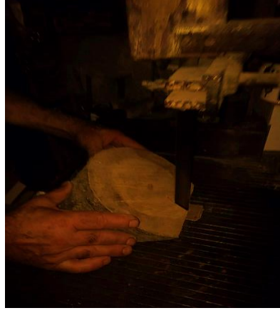
Şekil 3. Ağacın şeritli testere ile kesilmesi (Ahatlar Köyü/Amasra) (Ayırksa, 2018)

Ağacın tornaya bağlanabilmesi için merkezleme deliği sütunlu matkap tezgâhındadelinmektedir ( Şekil 4).