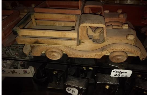
Şekil 21. Oyuncak kamyon (Çekiciler Çarşısı/Amasra) (Ayrıksa, 2018)