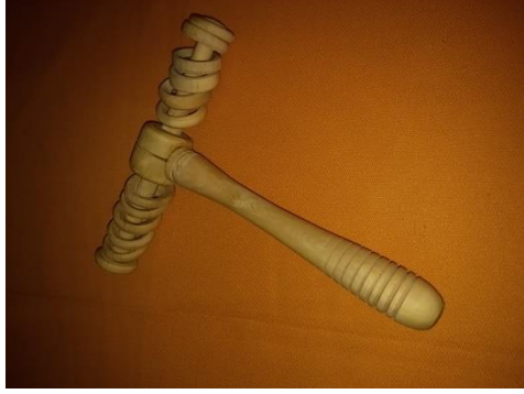
Şekil 20. Oyuncak çingirak (Çekiciler Çarşısı/Amasra) (Ayrıksa, 2018)