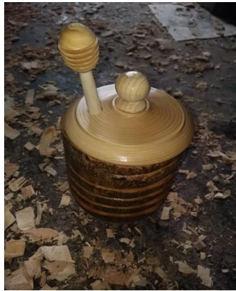
Şekil 18. Bal kavanozu (Çekiciler Çarşısı/Amasra) (Ayırksa, 2018)