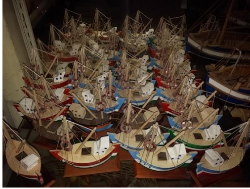
Şekil 11. Tekneler (Çekiciler Çarşısı/Amasra) (Ayırksa, 2018)