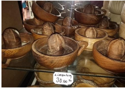
Şekil 14. Limon sıkacakları (Çekiciler Çarşısı/Amasra) (Ayrıkça, 2018)