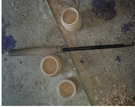
Şekil 1: Eydi(Ahatlar Köyü/Amasra) (Ayırksa, 2018)