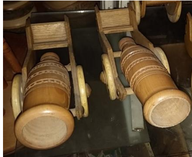
Şekil 9. Savaş Topu biblosu (Çekiciler Çarşısı/Amasra) (Ayrıkça, 2018)