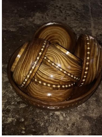
Şekil 13. Çerezlik(Ahatlar Köyü/Amasra) (Ayrıkça, 2018)