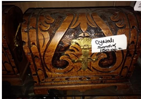
Şekil 12. Oymalı sandık (Çekiciler Çarşısı/Amasra) (Ayırksa, 2018)