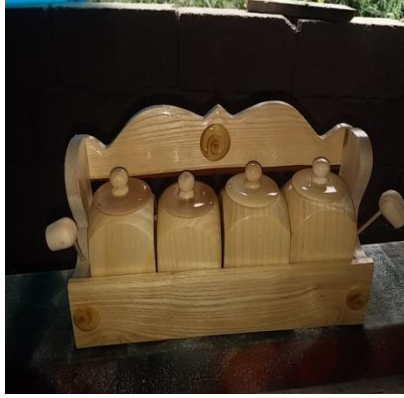
Şekil 19. Baharatlık (Ahatlar Köyü/Amasra) (Ayrıksa, 2018)