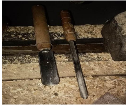
Şekil 2. Gerdengez (Ahatlar Köyü/Amasra) (Ayırksa, 2018)

Çekicilik sanatında kullanılan gereçler vernik, gomalak ve zeytinyağıdır. İçerisine yiyecek konulacak ürünlerde zeytinyağı veya gomalak vernik olarak kullanılmaktadır. İspirtonun içine reçine benzeri bir malzeme konularak yapılan gomalığın hammaddesi Hindistan'dan gelmektedir.