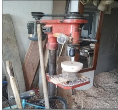
Şekil. 4. Sütunlu matkap tezgâhında merkezleme deliği açma (Ahatlar Köyü/Amasra) (Ayırksa, 2018)

Ağacın tornaya bağlanabilmesi için merkezleme deliği sütunlu matkap tezgâhındadelinmektedir ( Şekil 4).