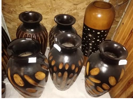
Şekil 10. Vazolar (Çekiciler Çarşısı/Amasra) (Ayırksa, 2018)