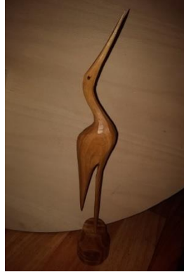
Şekil 8. Leylek figürü (Çekiciler Çarşısı/Amasra) (Ayrıkça, 2018)

Aşağıda bu ürünlerden bazılarına örnekler görülmektedir (Şekil 8, 9, 10, 11, 12, 13, 14, 15, 16, 17, 18, 19, 20, 21).