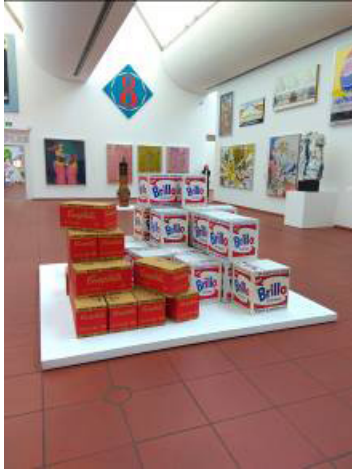
Resim 7: Ludwig Müzesi'nin Pop Sanat Koleksiyonu Salonuna Giriş

Köln'deki Ludwig Müzesi ise, birçok farklı kaynakta Avrupa'daki en önemli on çağdaş sanat müzesinden biri olarak gösterilmektedir. Müzenin, kendisini tanımlarken diğer çağdaş sanatlar müzelerinden ayrıldığı nokta ve tanıtımında vurgulamak için kullandığı yanı, (Resim 7) Avrupa'daki müzeler arasında en iyi Pop Sanat koleksiyonuna sahip müze olmasıdır. Ludwig Müzesi başta, bağımsız bir kurum olan Wallraf-Richartz Müzesi adı altında 1976 yılında kurulmuştur. Sonradan, Peter Ludwig isimli bir yatırımcı müzeye dönemin parasıyla 45 milyon dolar değerinde 350 modern sanat yapıtı bağışlamıştır. Bunlar: Picasso, Rus avangardları ve Amerikan Pop Sanatından örneklerdir. Bu bağışla birlikte Köln Şehri Yönetimi 1900 yılından sonra müzenin "Museum Ludwig" (Ludwig Müzesi) olarak isminin değişmesi kararını almıştır. Her iki kurumun koleksiyonlarının bir süre aynı binada sergilenmesinin ardından, 1986 yılında Peter Busmann ve Godfrid Haberer isimli mimarlar tarafından Ludwig Müzesi'nin şu an Köln Katedrali yanında yer alan yeni binası tasarlanmıştır.