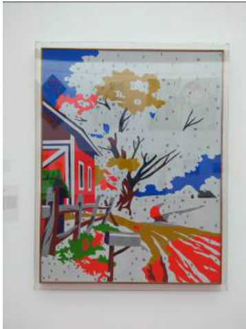
Resim 9: Andy Warhol, "Kendin Yap", 1962