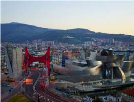
Resim 13: Bilbao Guggenheim Görünüm

Bilbao, Kuzey İspanya'da bir liman ve sahil kentidir. İleri teknoloji ve finans kenti olarak adını duyurma çabasında olan bu şehir için Bilbao Guggenheim bu projenin önemli bir kolu olmuştur. Dolayısıyla Bilbao Guggenheim, aslında kent yenileme projesinin ya da stratejisinin bir parçasıdır. Amerikalı mimar Frank Gehry, kentin Nervion nehri kıyısındaki görünümünü tamamen değiştiren bu tasarımı, Bilbao'nun çarpıcı bir simgesi haline dönüştürmüştür. " Bask yönetimi, müzeyi kurmak ve işletmek, Guggenheim koleksiyonunu ve ismini kullanabilmek ve kendi modern sanat koleksiyonunu oluşturmak için yaklaşık 100 milyon sterlin harcadı. Guggenheim Vakfı, müzenin teşhir programını yönetiyor " (Artun, 2006, s.155).