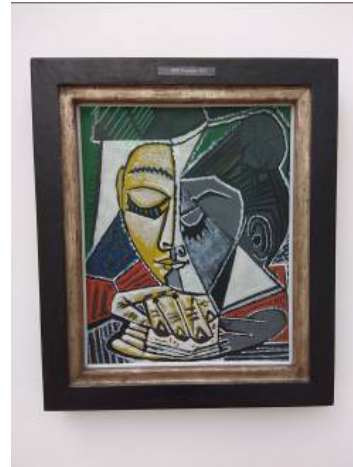
Resim 10: Pablo Picasso, "Kitap Okuyan Kadının Kafası", 1953

İsmen kaynaklarda sıkça karşımıza çıkan ünlü eserler dışında, bir de uygulama ve/veya fikir anlamında sanat dünyasında farklı boyutlar açarak, kazanımlar sağlayan eserler vardır. Andy Warhol'un (Resim 9) "Kendin Yap" isimli manzara resmi bunlardan birisidir. Kendi resmini bir model olarak ortaya koyan sanatçı, başkalarının bu resmi tamamlayabileceği fikri üzerinden yapboz tarzındaki resimlerini üretmiştir. Tamamlanmamış bir işi sergilemesi de, resmine başkasının müdahale edebileceğini söylemesi de resmin yapıldığı dönemde radikal ve yenilikçidir. Roy Lichtenstein'in gerek kendi ilgi alanı, gerekse bir baba olarak çocuklarının önerileri ile çizgi film karakterleri ve çeşitli illüstrasyonları eserlerinde hem konu olarak, hem de noktalamalarından ötürü üslupsal anlamda değerlendirmesi onun diğerlerinden farklılaşmasını sağlar.