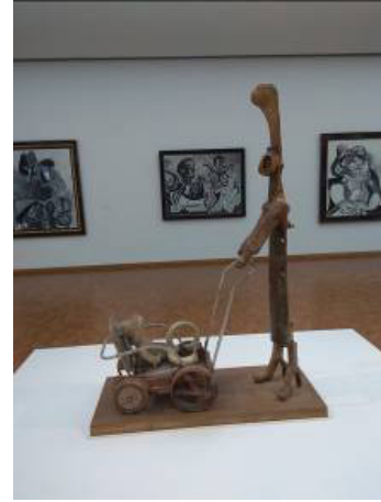
Resim 8: Ludwig Müzesi'nin Picasso Koleksiyonu Salonundan Görünüm

Koleksiyonunda 1900'lerin başlarından itibaren farklı akımlardan eserler bulunan müzede, Fovizmin önemli temsilcilerinden Henri Matisse'in "Oturan Kız" isimli resmi, Maurice de Vlaminck'in "Çiçekler ve Meyvelerle Ölüdoğa" eseri, Andre Derain'nın "St. Paul-de-Vence Görünümü" resmi sergilenmektedir. Sonrasında Auguste Macke'nin "Yeşil Ceketli Kadın" ve Franz Marc'ın "Sığırlar", Max Pechstein'in "Odada İki Çıplak Kadın" gibi örnekler dikkati çekmektedir. Alman Dışavurumcularından Ernst Ludwig Kirchner, Erich Heckel'in eserleri için ayrılmış bir salon dışında Dışavurumcu eğilimler diye bir başlık atıldıktan sonra Rus avangard Dışavurumcular diye ayrıca bir kısım da oluşturulmuştur. 1905-1935 yılları arasına ait, 600'ü aşkın eserlik Rus avangard sanat koleksiyonu ayrıca dikkat çekicidir. Natalia Goncharova, Alexander Rodchenko ve Kazimir Malevich bunların arasında öne çıkmaktadır.