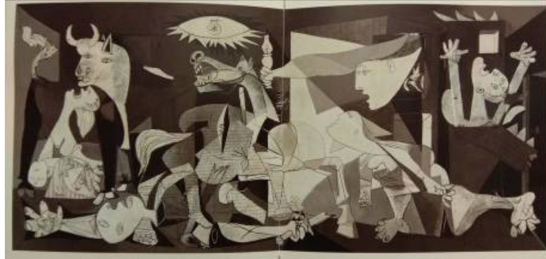
Resim 11: Pablo Picasso, "Guernica", 1937, 3,5m x 7,8m.

Salvador Dali'nin farklı dönemlerinden denemeleri Reina Sofia Müzesinde dikkati çekmektedir. 1923 yılında yaptığı kübist etkiler taşıyan "Ölü Doğa" kompozisyonundan, figüratif resimlerine, geçirdiği farklı dönemlerine ait yapıtlar ile Gerçeküstücü aşamaya geldiği süreci gözlemlemek sanat izleyicisi için keyiflidir. Dali'nin 1925 yılında yaptığı "Penceredeki Figür" ve "Kız kardeşimin Portresi" resimleri de, sanatçının geçmişini tanımlamak açısından önemlidir. 1926 yılı "Kırmızı Kuşlar"ı ile Max Ernst de 20. yüzyılın ilk yarısında üretim yapan sanatçılar arasında yerini almaktadır. Yüzyılın ilk yarısından dikkati çeken eserler arasında, Reina Sofia'nın Kübizm kısmında, Georges Braque'dan birçok yapıt yer almaktadır.