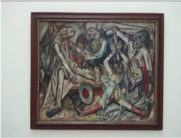
Resim 5: Max Beckmann, "Gece", 1918-19, Tuval Üzeri Yağlıboya.