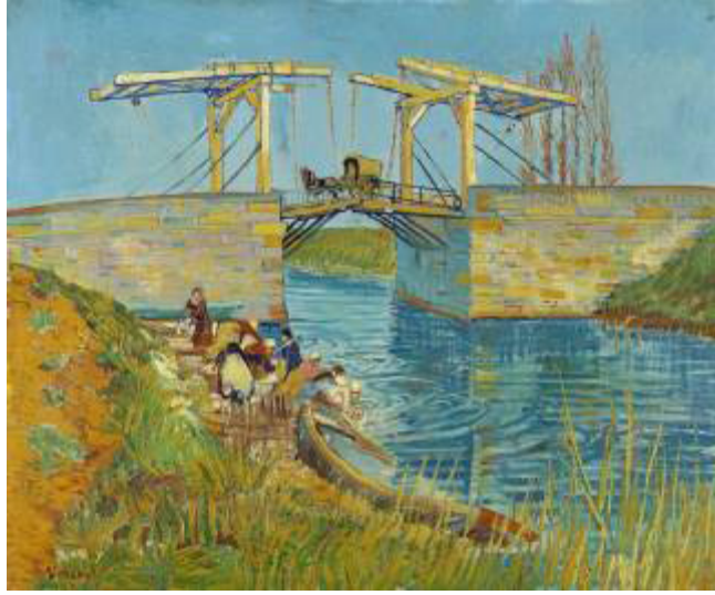
Resim 1: Vincent Van Gogh, “Bridge at Arles”, 1888, Tuval Üzeri Yağlıboya.