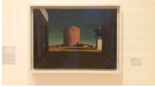
Resim 2: Giorgio de Chirico, "Kızıl Kule", 1913, Tuval Üzeri Yağlıboya

isimli resmi, Giorgio de Chirico'nun (Resim 2) "Kızıl Kule" isimli ünlü eseri, Piet Mondrian'ın "Gri ve Kırmızılı Kompozisyon No.1"i, Kandinsky'nin "Kırmızı Noktalar ile Peyzaj No.2"si, Joan Miró'nun "Oturan Kadın II" adlı resmi, Paul Klee'nin "Sihirli Bahçe"si, Rene Magritte'in "Işığın İmparatorluğu" adlı yapıtı, Salvador Dalí'nin "Sıvı Arzuların Doğum"u ve daha birçok önemli yapıtın bulunduğu bu koleksiyonun, Bienallerin anası olarak bilinen kıdemli organizasyon Venedik Bienali ile aynı kentte olması müzeyi konumu gereği daha da önemli kılmaktadır. Bir anlamda Venedik Bienali gibi bir etkinlikle, müze birbirlerinden beslenmektedir denebilir.