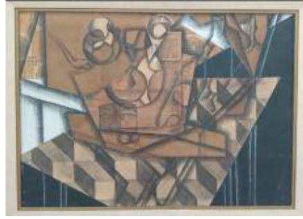
Resim 4: Juan Gris, "Çay Fincanları", 1914, Tuval Üzerine Kolaj ve Füzlen.