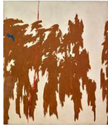
Resim 14: Clyfford Still, İsimsiz, 1964, Tuval Üzeri Yağlıboya, 273.5 x 236 x 3.5 cm.