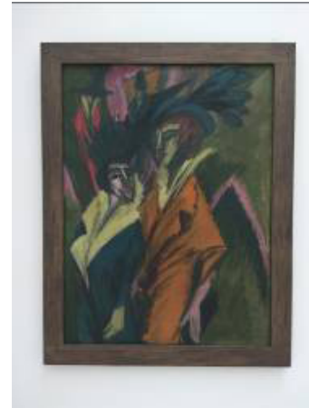
Resim 6: Ernst Ludwig Kirchner, "Sokaktaki İki Kadın", 1914, Tuval Üzeri Yağlıboya.

Klee ve Beuys dışında, Franz Marc, Max Beckmann ve Ernst Ludwig Kirchner'in önemli eserleri müzenin içinde gezinirken hemen dikkati çekmektedir. Franz Marc'ın "Üç Kedi"si, Max Beckmann'ın (Resim 5) "Gece" isimli yapıtı, Ernst Ludwig Kirchner'in (Resim 6) "Sokaktaki İki Kadın" isimli eseri bilinirlik ve sanatçıların içinde buldukları akımları temsil etmeleri açısından ilk akla gelenlerdendir. Salvador Dali'nin "Çekmeceli Milo Venüsü", Francis Bacon'ın "Otoportre için Üç Çalışma"sı, Jean Dubuffet'nin "Rene Drouin: Açık Eller" isimli resmi, Günther Uecker'in "Masa"sı, Lucio Fontana'nın "Konsept 65T 46 (Beklentiler)" isimli eseri bunlardan sadece birkaçıdır. K20 Kunstsammlung'un üst katında yer alan duvar üzerine kurşun kalem Sol Le Wit deseni, Minimalizm akımını temsil eden yerleştirmelerinden farklı olarak, sanatçının desen ve farklı malzemelerle ilişkisinin görülmesi açısından önemli ve büyük ebadı ile etkileyicidir.