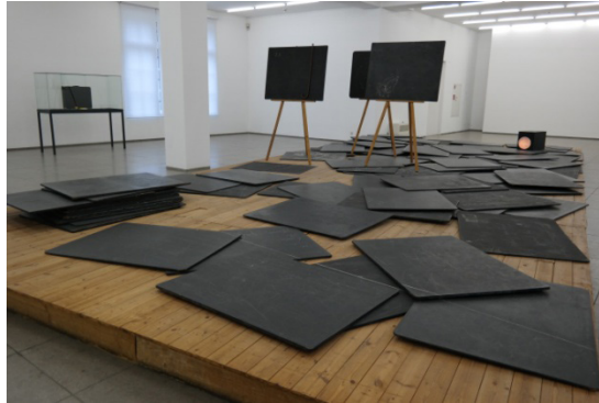
Resim 12: Joseph Beuys, “Yönlendirici Kuvvetler”, 1974