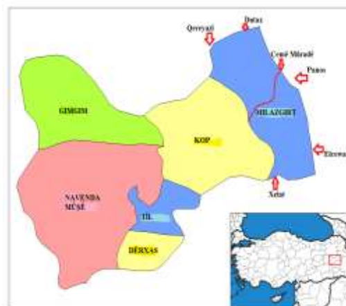
Nexşe 1. Lokasyona Navçeya Milazgirtê

Milazgirt, li gorî sînorenên fermî yên Komara Tirkîyeyê navçeyêke bajarê Mûşê ye û li bakurrojhilatê wê dimîne. Lêbelê ji aliyê erdnîgarî û çandî ve hem gelek ji Mûşê dûr e hem jî zêdetir nêzîkî çanda Kop, Qereyazî, Dutax, Xelat, Panos û Ercişê ye. Ji aliyê eşîr û malbat û xizmayetîyê ve dîsa zêdetir nêzî navçeyên binavkirî ye. Loma bi taybetî di xebata zimanî an jî çandî de nixandînen li gorî sînorenên fermî mimkûn e amar û encamên şaş bigihînin destên me.