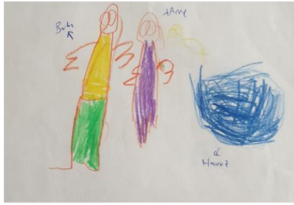
Resim 4. kardeşiyle havuzda yüzmeyi seven Suriyeli erkek çocuğun çizimi