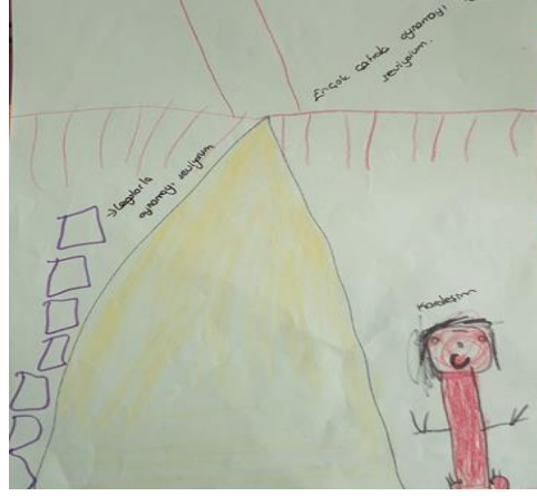
Resim 3. Kardeşiyle çatıda (dam/teras) oynamayı seven Türk kız çocuğunun çizimi