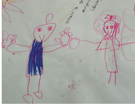
Resim 1. Erkek arkadaşıyla parkta oynamayı seven Türk kız çocuğun çizimi