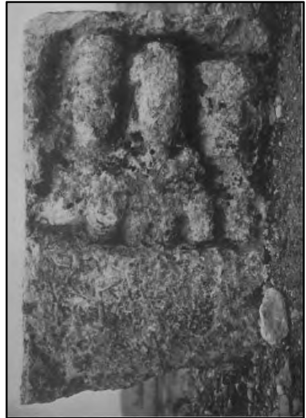
Resim 4. Erkek Büstü (Albayrak 2019: 182) Resim 5. Mezar Steli (Albayrak 2019: 183)