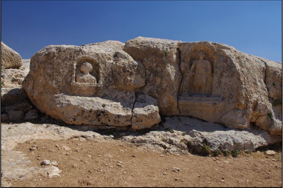
Resim 1. Tepe'de Yer Alan Rölyefler (Albayrak 2019: 178)