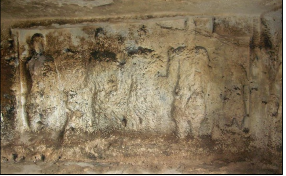
Resim 2. Pogon Mağarası (Albayrak 2019: 184)