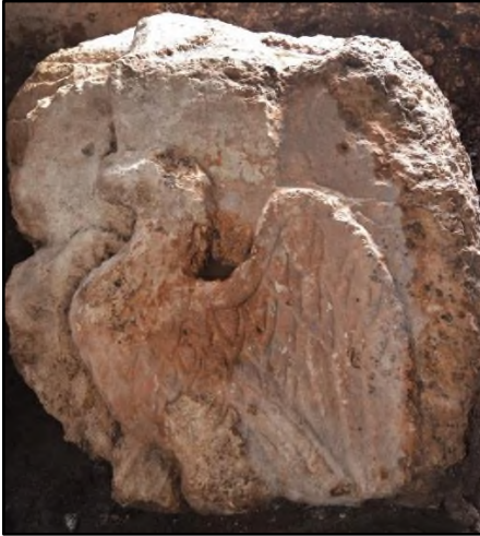
Resim 6. Kartal Figürü.