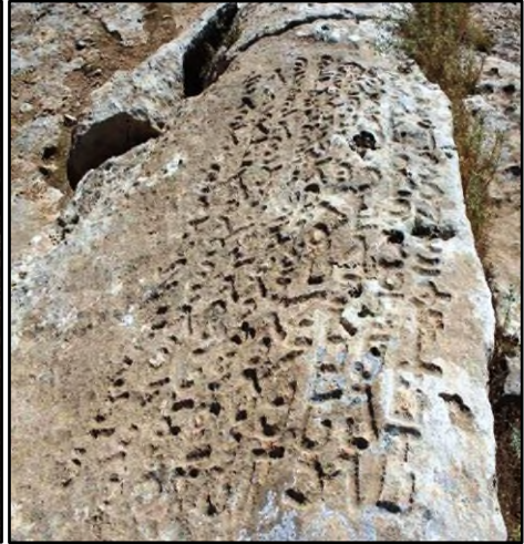
Resim 7. Tepe Üzerindeki Yazıt.