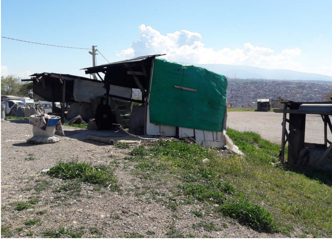
Fotoğraf 2. Turizme yönelik çalışmalar; kadınlar tandır ekmeği yapıp satmaktadır