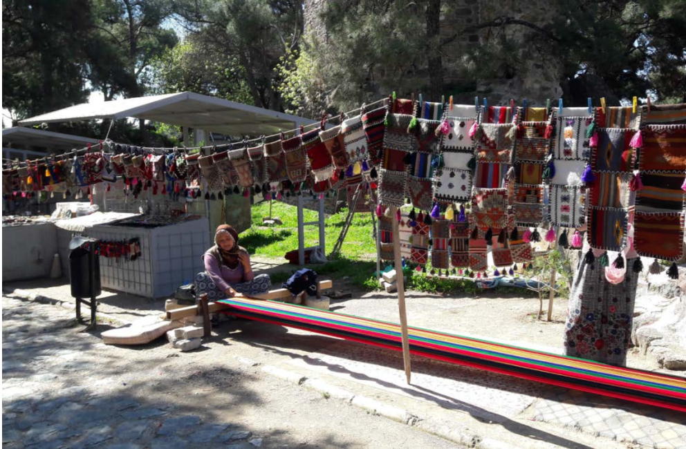
Fotoğraf 1. Turizme yönelik çalışmalar; kadınlar tarafından dokuma çanta yapılıp satılmaktadır

İzmir'de kentsel dönüşüm için öncelikli proje uygulama alanlarından biri olarak Kadifekale belirlenmiştir. Bölgede bulunan heyelan riski dolayısıyla Bakanlar Kurulu tarafından Kadifekale'ye ilişkin 1978, 1981, 1998 ve 2003 tarihlerinde çıkarılan Afete Maruz Bölge kararları (Tekeli, 2018:47) bu dönüşümün meşru söylemini oluşturmaktadır. Projenin diğer nedenleri arasında ise coğrafi konumu nedeniyle kent prestiji bakımından önem taşıması ve tarihi önemi nedeniyle kent turizminin geliştirilmesine yönelik sahip olduğu potansiyeldir (Fot. 1, Fot. 2) (Miriöglu,2013,81). 2006 tarihinde alana ilişkin kamulaştırma kararı alınmıştır (Savcı 2009: 251, Akdağ 2009: 760). 2007 tarihinde onaylanan İzmir Kentsel Bölge Nazım İmar planında Kadifekale Kentsel Dönüşüm Proje alanı rekreasyon alanı, çevresi de kentsel yenileme alanı olarak planlanmıştır (Mutlu 2009, 73). Kadifekale ve çevresinin arkeolojik sit alanı olarak korunması ve düzenlenmesine yönelik Kültür Bakanlığı tarafından birçok çalışma yürütülmüştür (Fot. 3, Fot. 4).