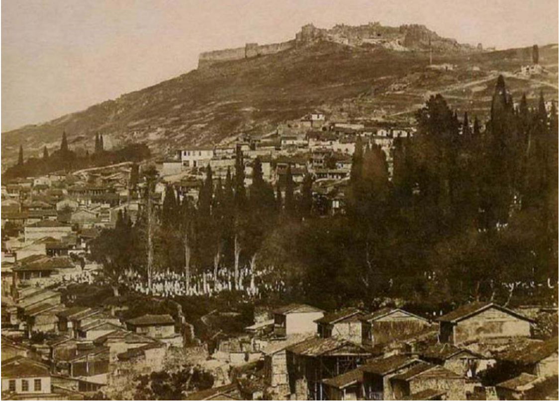
Şekil 1. 1870'lerde Kadifekale (URL-1)