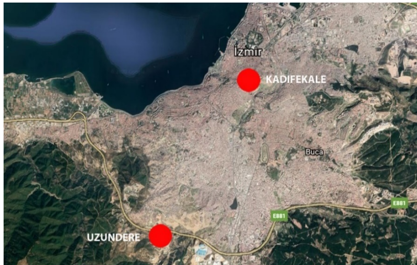
Şekil 3. Uzundere Yerleşim Alanının Kadifekale'ye göre Konumu

Kentsel dönüşüm projesi öncesinde, her ne kadar Kadifekale ile kent arasında görünmeyen sınırlar mevcut olsa da kentle kurdukları ilişkiler sayesinde kent içinde var olmayı ve kentte görünür olmayı başaran Kadifekaleliler, kentsel dönüşüm projesi sonrasında kentin dışına itilerek bu şanslarını da kaybetmişlerdir. Kentsel dönüşüm projesi sonrasında Kadifekaleliler ile kent arasında var olan görünmeyen sınırlara bir de fiziksel sınırlar eklenmiştir (Şekil 3). Uzundere Toplu Konut alanı kent merkezinden oldukça uzakta yer almakta ve kent ile arasından geçen otoban sadece fiziki bir öge değil, kentle olan ilişkiyi ayıran temsili bir sınır olarak kendini göstermektedir. Mustafa D. (30) bu durumu “Biz İzmir’den Ayrıyız. Çevre otobanının üzerindeki o köprü bizi İzmir’den ayırıyor, iklimimiz dahi değişiyor” şeklinde belirtmektedir (Kılıç ve Göksu, 2018: 211).