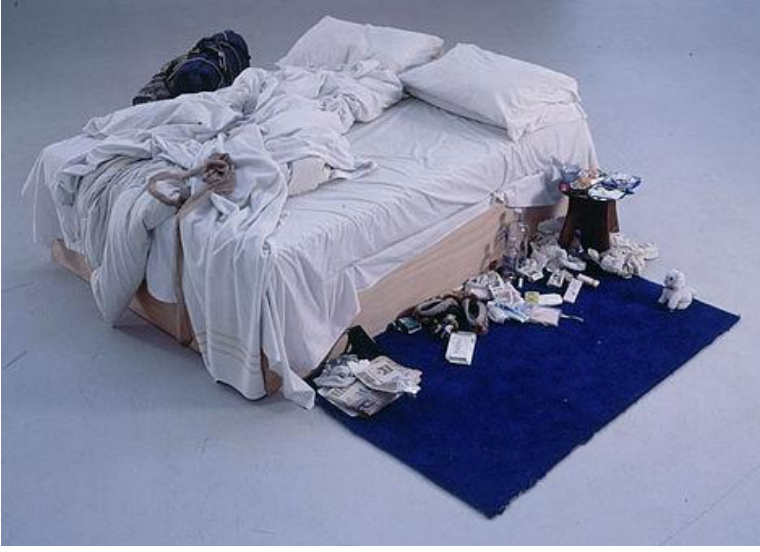
Tracey Emin, My Bed , 1998

akla gelenlerden biri Tracey Emin'in "yapıtlarıdır". Burada Emin'in, My Bed (Yatağım) adlı çalışması anılabilir.