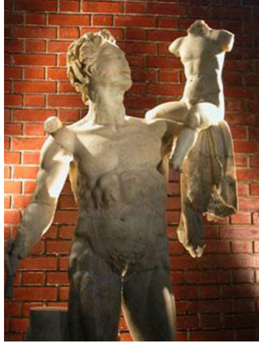
Resim 5: Afrodiasyas Müzesi'nden örnekler Erişim Tarihi: 11.11.2013_ http://www.aphrodisias.info/fotograflar/

Afrodiasyas'lı heykeltıraşların eserlerine bakıldığında aslında her birinin kendine özgü bir tarz ortaya koymuş oldukları görülmektedir. Ayrıca eserlerden ve konularından, kendilerine özgü birer düşünür oldukları da anlaşılmaktadır.