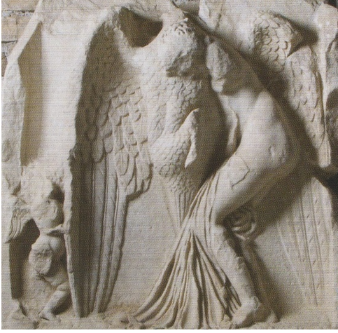
Resim 7: Sebastion kabartmalarında Zeus ve Leda