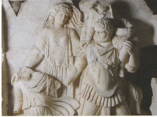
Resim 8 Sebastion Kabartmalarından Enez'in ailesini Troya'dan kaçırılışı, onu koruyan Afrodit

Resim Kaynakçası: Bektaş Cengiz, Afrodisyas, Arkeoloji ve Sanat Yayınları,2008,İstanbul, syf:91