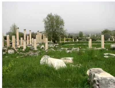
Resim 1: Afrodisias agoradan bir görüntü