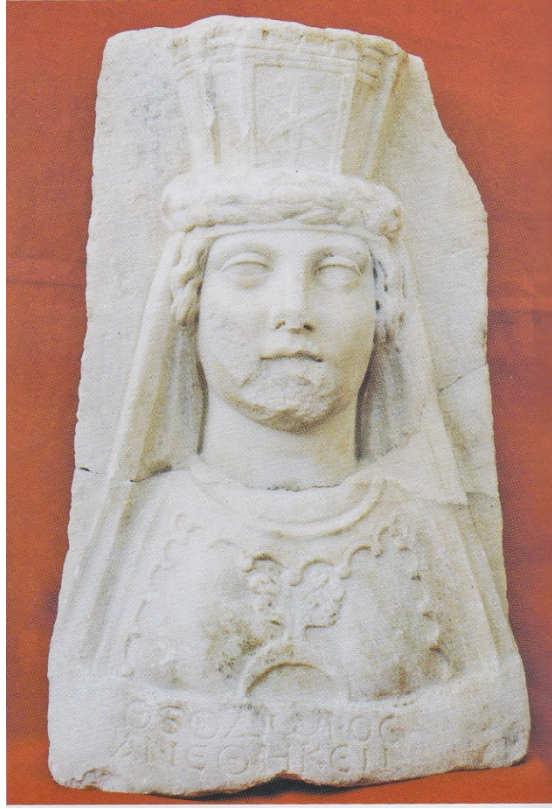
Resim 4: Afrodisiaslı Afrodit Büstü

Bektaş Cengiz, Afrodisyas, Arkeoloji ve Sanat Yayınları,2008,İstanbul, syf:32