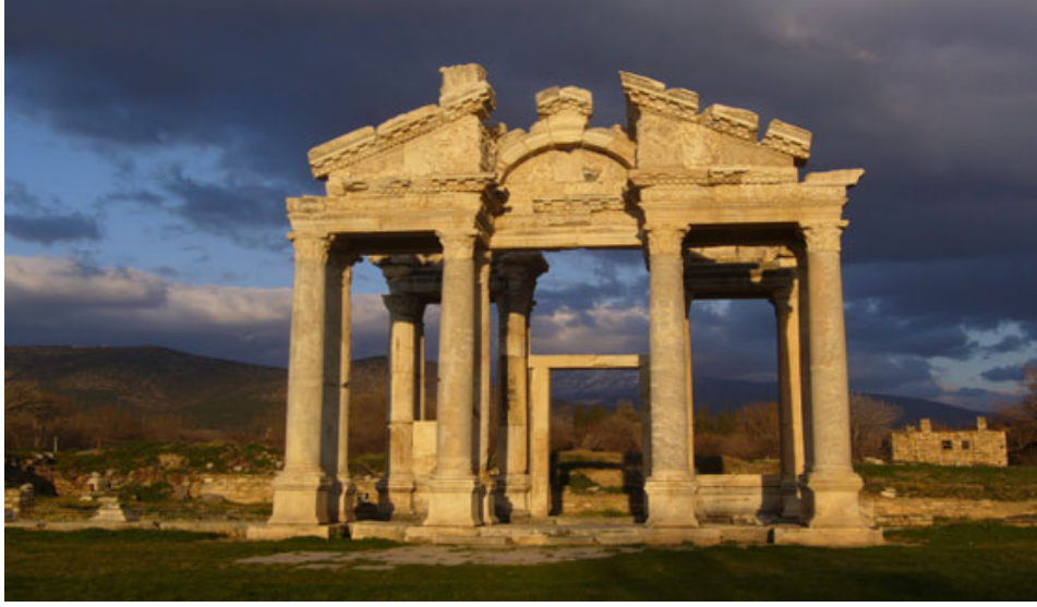
Resim 3: Afrodiasias Kenti