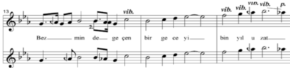
Şekil 5. Vibrato (Özbilen, Ayangil: 2016).

Aşağıdaki görselde vibrato örneği gösterilmiştir.