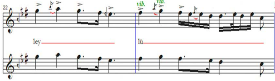
Şekil 7. Vurgu (Özbilen, Ayangil: 2016).

Şekil 7. Nerkis Hanım'ın seslendirdiği Hüzam "Sükunlu geçer ömrüm" icrasından notaya alınmıştır (Özbilen, Ayangil: 2016).