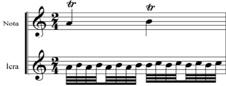
Şekil 6. Tril (Kaçar, 2005)

Aşağıdaki görsel de tril örneği gösterilmiştir.