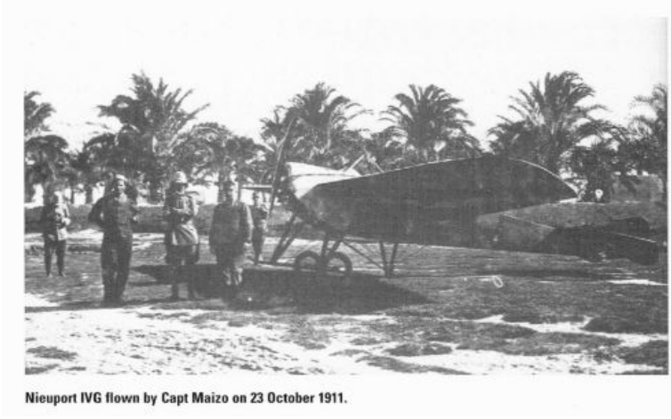
Resim 3: Trablusgarp Savaşında İtalyan Kuvvetlerince Kullanılan Niuport Tipi uçak.