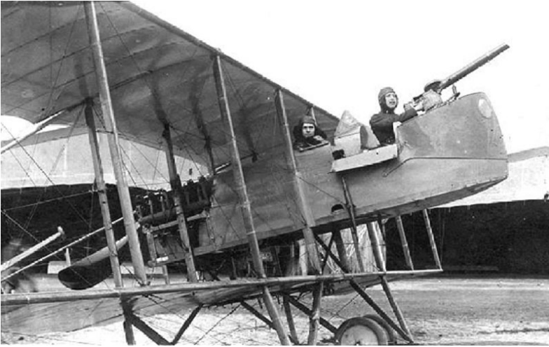
Resim 2: Trablusgarp Savaşında İtalyan Kuvvetlerince Kullanılan Farman MF-11 Tipi Keşif Bombardıman uçağı.