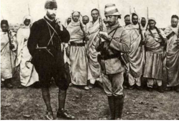
Resim 5: Mustafa Kemal Atatürk ve Libyalı Direnişçiler

Resim 4: Trablusgarp Savaşında İtalyan Kuvvetlerince Kullanılan Balonların Osmanlı Mevzilerini bombalaması.