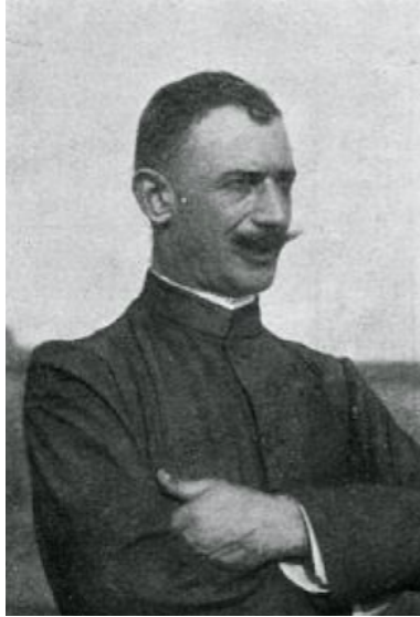
Resim 6: İtalyan Pilot Yüzbaşı Carlo Piazza