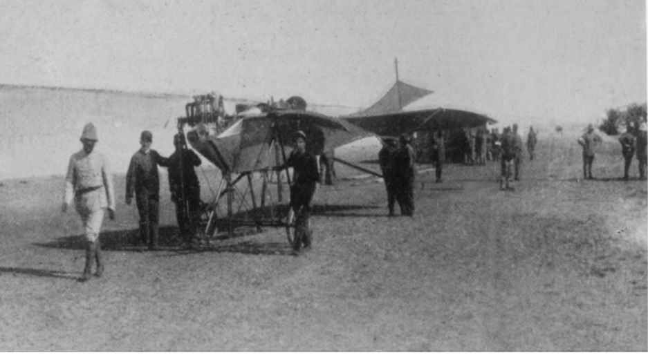
Resim 1: Trablusgarp Savaşında İtalyan Kuvvetlerince Kullanılan Etrich Taube tipi uçak