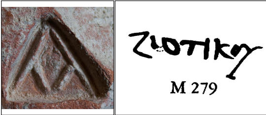
Fig. 5. a) Kara 2019: Kat. No. 178 (Cankardeş - Şenol 2015: 238, Res. 13); b) Kara 2019: Kat. No. 190 (Robinson 1959: 110, Pl. 58, M 279)