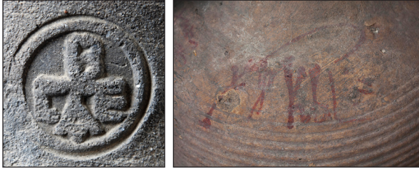
Fig. 1. a) Kara 2019: Kat. No. 1 (Kara 2015: Fig. 5); b) Kara 2019: Kat. No. 26a (Çibuk 2019: Kat. No: 27)