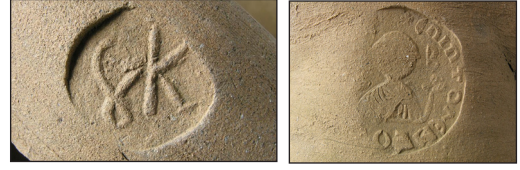
Fig. 2. a-b) Kara 2019: Kat. No: 49a-b (Kara 2015: Fig. 3a-b)