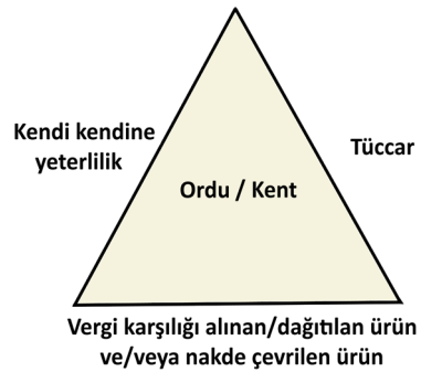
Fig. 7. Annona civica ve militarisin askeriye ve kent tedarikiindeki kurgusal konumu (Çizim: Ü. Kara)