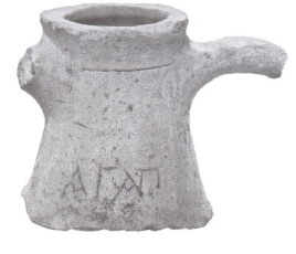
Fig. 6. a) Kara 2019: Kat. No. 219 (Kara 2015: Fig. 9a-b); b) Kara 2019: Kat. No. 236 (Minchev 2011: Fig. 12)