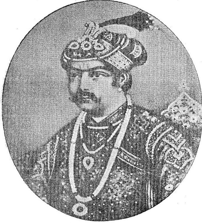
سندستاندہ تورک ایمپراطور لری ہمایون شاہ

Gücerât Hükümdarı bu talebe -Malva vilayetini zapt ederek Gücerât'a ilhak etmiş ve Birâr, Handis, Ahmednagar Râcâları ile hafî bir muahede yapmış olduğundan- bir müstakbel Hint Hükümdarı gururuyla şiddetli bir cevab-ı red verdi ve mukavemete hazırlandı.