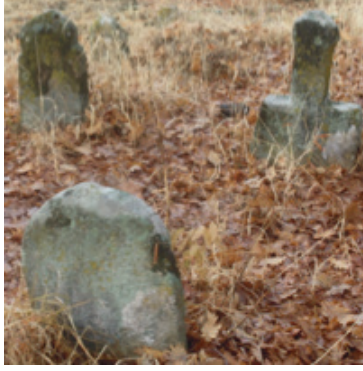
Foto 1.2.25. İçpınar Köyü Köy Dışındaki Mezarlıkta XXVI No.lu Mezar

İnsan başı şeklinde şahideye sahip olan bu mezarın sandukası bulunmamaktadır. Diğer mezarların birçoğunun sandukalarının kısmen toprak altında olması bu mezarın sandukasının toprak altında olduğu kanısını güçlendirmektedir. Mezarın ayak taşı oldukça basit yapılmıştır. Ayak taşı üst kısımda üçgen bir başlık ile son bulmaktadır. Dikdörtgen gövdeye sahip olan şahide taşı düz bir kesimle boyun kısmına geçilmiş ve boyun kısmı oldukça uzun tutulmuştur. Boyun kısmı tam yuvarlak olmayıp ön yüzeyde düz tutulmuştur. Baş kısmı nispeten tahrip olmuştur. Taşırılmış formda yapılmış olan baş kısmı ön yüzeyde düz diğer taraflarda baş şeklinde dairesel forma yakındır. Baş kısmının yan yüzeylerinde bazı oyma çizgiler fark edilmekle birlikte bunların orijinal olup olmadığı bilinmemektedir.