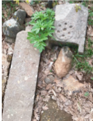
Foto 1.2.19. İçpınar Köyü Köy Dışındaki Mezarlıkta XX No.lu Mezar

Bu mezar tamamen tahrip olmuş olup mezara ait taşlar çevreye yayılmıştır. Aynı yerde bulunan ve sadece üst kısmı bulunan şahide taşı, bir ayak taşı ve kapak taşının bir kısmı bulunmaktadır. Şahide taşı taşırılmış kavuk şeklinde olup üst tarafı düz yivlerle hareketlendirilmiş bir kavuk ile son bulmaktadır. En dikkat çeken unsur ise kapak taşından kalanlardır. Büyük kısmı tahrip olmuş kapak taşının üzerinde kabartma şeklinde dairesel bir motif bulunmaktadır dairenin içinde ortada bir adet, etrafında daire oluşturacak şekilde dizilmiş altı adet toplam yedi adet oyuk bulunmaktadır. Bu motife benzer motifler, Kiğı Açıkğüney Köyü'nde bulunan Arnavut mezarlarında bulunmaktadır. Açıkğüney köylüleri bu motife Hızır yıldızı ismini vermektedirler. Ancak bu motifin kahve tepsisini sembolize ettiğini çeşitli çalışmalar ve yine Açıkğüney köyündeki bazı mezar taşlarındaki bu motif ile birlikte verilen kahve veya su ibrikler göstermektedir.