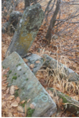
Foto 1.2.10. İçpınar Köyü Köy Dışındaki Mezarlıkta XI No.lu Mezar

Yan kapakları ve şahide taşı sağlam vaziyette olmasına rağmen mezar sandukasının geriye kalan kısımları tahrip olmuştur. Yüzeyi kaplayan yosunlardan dolayı süsleme olup olmadığı tespit edilememiştir. Dikdörtgen bir çerçeveye sahip olan şahide üçgen bir şekilde son bulmaktadır.