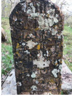
Foto 1.2.18. İçpınar Köyü Köy Dışındaki Mezarlıkta XIX No.lu Mezar