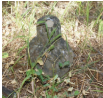
Foto 1.2.4. İçpınar Köyü Köy Dışındaki Mezarlıkta V No.lu Mezar

Bu mezarın sadece şahide taşının baş kısmı bulunmaktadır. Diğer birimleri tamamen kaybolmuştur. Şahide taşı sarıklı kavuklu 5 şeklinde olup bu tür kavukların Osmanlı'da devlet erkânına ait olduğu 6 ve kâtibi kavuk olarak da adlandırıldığı bilinmektedir. Daha çok 18 ve 19. yüzyılda görülmektedir. Mezarlıkta çok sayıda bu tür başlık bulunmaktadır. Ancak birçoğu mezarın bulunduğu yerde olmayıp kırılmış ve çevreye dağılmış vaziyettedir. Şahide başı taşırılmış bir sarık ile kavuğu dolanmaktadır. Kavuk düz yivli çizgilere sahiptir. Düz yivli kavuk kısmı mezarlıktaki benzerleri gibi yüksek tutulmuştur.