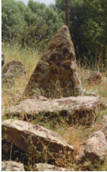
Foto 1.1.1. İçpınar Köyü Eski Mezarlıkta I No.lu Mezar

Bu mezar fazla bir özelliğe sahip olmamakla birlikte üçgen ayak taşına sahiptir. Şahide taşı yerinde olmayıp çevresinde ve üzerinde bulunan kırık taşlardan anlaşıldığı kadarıyla sanduka tipi bir mezardır. Sanduka tipi mezar olan bu mezarın kapak kısmı kırılmış ve yan kapaklar da yerinden oynamıştır. Ancak yan kapaklar sağlam vaziyettedir. Mezarın toprak üstünde bulunan bölümün taban kısmı yaklaşık 55 cm yüksekliği ise 85 santimetre yüksekliğe sahiptir. Üzerini kaplayan yosunlardan dolayı süsleme olup olmadığı anlaşılmamaktadır.