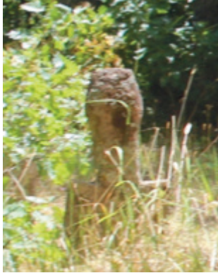
Foto 1.2.21. İçpınar Köyü Köy Dışındaki Mezarlıkta XXII No.lu Mezar

İnsan başı şeklinde tasarlanmış şahideye sahip olan bu mezarın sanduka ve ayak taşı bulunmamaktadır. Şahidenin dikdörtgen bir gövdesi olup boyun kısmı yüksek tutulmuş ve baş kısmı boyun gibi uzundur. Baş kısmı ortadan taşınılı şekilde yapılmış olup yüzeyi çok fazla deforme olduğundan ve yosunlardan dolayı süsleme veya yazıya haiz olup olmadığı anlaşılmamaktadır.