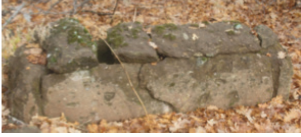
Foto 1.2.8. İçpınar Köyü Köy Dışındaki Mezarlıkta IX No.lu Mezar

Dikdörtgen bir sandukadan ibaret olan bu mezarın sandukası tahrip edilmiştir. Şahide ve ayak taşı bulunmayan mezarın sandukası parçalara ayrılmış olmasına rağmen bir bütün halinde bir arada durmaktadır. Çevrede bulunan bazı şahidelerin bu mezara ait olması gerekmektedir. Bu haliyle mezarda herhangi bir süsleme veya yazı tespit edilememiştir.