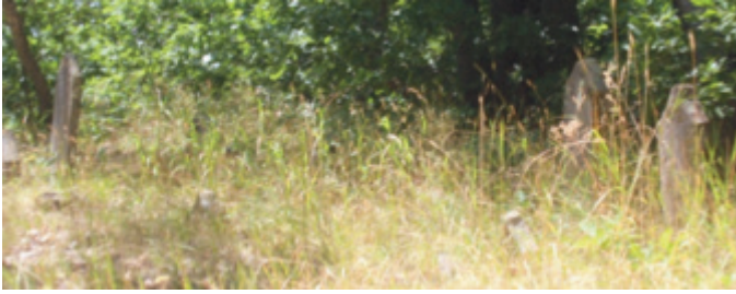
Foto 1.2.2. İçınar Köyü Köy Dışındaki Mezarlıkta II ve III No.lu Mezarlar

Bu mezarların şahide ve ayak taşları sağlam olup herhangi bir süslemeye sahip değildir. Mezar taşlarının şahideleri dikdörtgen bir gövdeye sahip olup üst kısımda 5 cm bir çıkıntı ile baş kısmı hareketlendirilmiştir. Başlık kısmı üçgen bir şekilde devam edip üzeri düz tutulmuştur. Her iki mezar yapısında da yazı unsuru bulunmamaktadır. Bu mezarların mezarlıktaki daha yeni mezarlar olduğu düşünülmektedir. Buna benzer birkaç mezar taşı ve mezar daha yüzeyde bulunmaktadır. Ancak bu mezarların yakın dönemlerde yapıldığı değerlendirildiğinden örnek olması bakımından çalışmaya daha eski görüntü veren bu iki mezar alınmıştır.