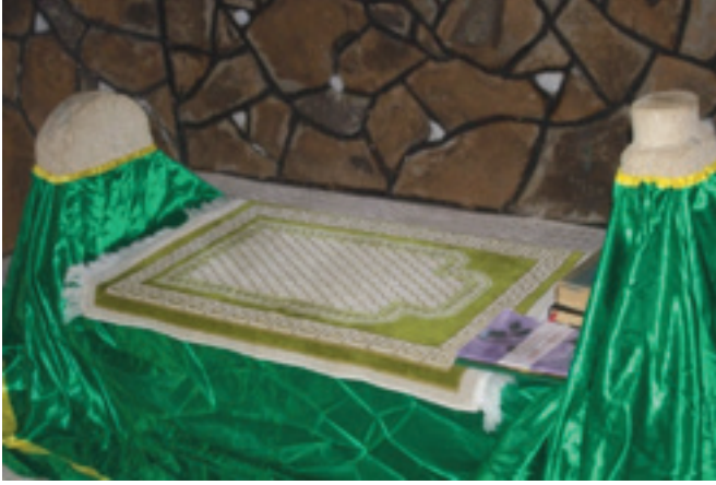
Foto 1.2.16. İçpınar Köyü Köy Dışındaki Mezarlıkta XVII No.lu Mezar

Bu mezar daha sonradan müdahale görmüştür. Yan kapakları orijinal olan mezarın şahide ve ayak taşı sonraki dönemlerde yenilenmiştir. Vefat edenin torunları tarafından yeni bir şahide ve ayak taşı hazırlanmış ve şahide taşının üzerine günümüz Türkçesi ile ismi ve vefat tarihi not düşülmüştür. Tarih olarak 1895 tarihi düşülmüş olan mezarın orijinalinde de bu tarihin olduğu köylüler tarafından ifade edilmiştir. Burada yatan kişi Seyydi Şeyh Hacı Abdülcelil'dir. Günümüzde mezarın üzerine bir türbe yaptırılmıştır.