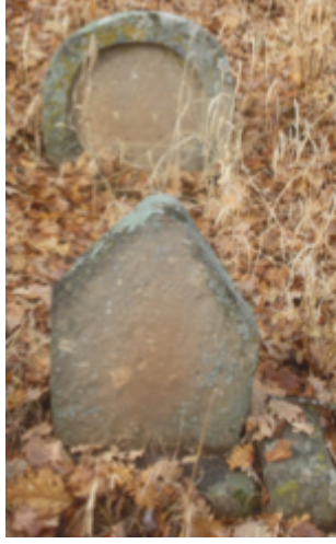
Foto 1.2.3. İçpınar Köyü Köy Dışındaki Mezarlıkta IV No.lu Mezar