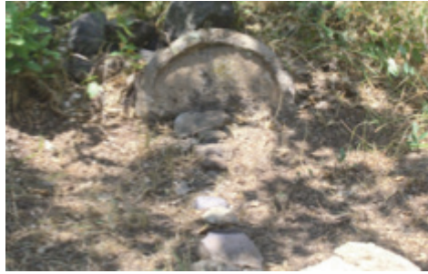
Foto 1.2.14. İçpınar Köyü Köy Dışındaki Mezarlıkta XV No.lu Mezar

Şahide ve ayak taşı sağlam olan bu mezarın sanduka kısmı toprak altında kalmıştır. Şahidesi ve ayak taşı da büyük oranda toprak altında olan mezarda süsleme olup olmadığı anlaşılamamaktadır. Şahidesi yuvarlak kemerli bir kitime kısmına sahiptir. İç tarafta yer alan bu kısımda herhangi bir süsleme ya da yazı bulunmamaktadır.