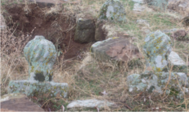
Foto 1.1.2. İçpınar Köyü Eski Mezarlıkta II No.lu Mezar

maktadır. Yan kapaklar oldukça kalın taşlardan yapılmış olup 25 cm genişliğe sahiptir. Mezarın iki adet şahideye sahip olması ve iki kavuk şeklinde başlığının bulunması mezarın iki kişiye ait olabileceği kanısını güçlendirmektedir. Ancak bunun ile ilgili herhangi bir bilgi bulunmamaktadır. Şahide taşı yüzeyde olduğu kadarıyla dikdörtgen bir formda yapılmıştır. Bu dikdörtgen üst kısımda içe doğru düzgün bir şekilde devam edip ortada başlığa dairesel bir boyun ile geçilmektedir. Şahide taşında bulunan başlıklar sarıklı olup dairesel bir yapıya sahiptir. Her iki başlık helezonik yivli silmeler ile hareketlendirilmiş olup kuzey tarafta olan başlığın yivleri güney taraftakine göre daha ince işlenmiş olup silme sayısı daha fazladır. Başlıklar üst kısımda küçük birer çıkıntı ile son bulmaktadır. Ancak bu çıkıntılar tahrip olmuştur. Başlık dışında herhangi bir yazı unsuru veya süslemenin olup olmadığı tahribat ve kalan kısımların toprak altında olmasından dolayı anlaşılamamaktadır. Bu tür sarık şeklinde mezar taşlarının Osmanlı'da XVI. yüzyıl ile XVII. yüzyıla kadar kullanıldığı bilinmektedir. 3 Bu sarıklar Osmanlı'da ulema tarafından kullanılmaktadır. 4 Bu bilgiler ışığında buradaki mezarın en geç XVII. yüzyıl sonlarına ait olabileceği düşünülmektedir. Ancak yapılacak daha geniş kapsamlı çalışmalar ile tarihi tam olarak ortaya konabilecektir.