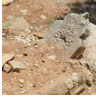
Foto 1.2.5. İpınar Ky Ky DıŐındaki Mezarlıkta VI No.lu Mezar Őahide