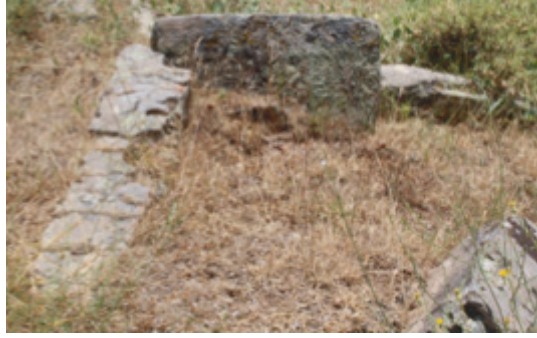
Foto 1.1.6. İçpınar Köyü Eski Mezarlıkta VI No.lu Mezar

Bu mezar yaklaşık 15 metre uzunluğunda devam eden sandukanın bitiminde yer alan bir ayak taşı ile son bulmaktadır. 15 metrelik kuzey tarafta bulunan yan kapak birkaç mezara ait olmalıdır. Aralarda bulunan bazı taşlar bunun göstergesidir. Ancak şahide ve ayak taşları tahrip edilip yerlerinden edilmiştir. Güney tarafta bulunan kapak taşı da mezarlar boyunca uzanmaktadır. Kapaklar oldukça kalın tutulmuş kimi yerde 30 cm'ye yaklaşmaktadır. Var olan ayak taşı dikdörtgen şeklinde olup kapaklar ile aynı formda oldukça kalın tutulmuştur. Yapılacak kazı çalışmaları neticesinde mezar taşlarının tam mahiyeti ortaya çıkacaktır.