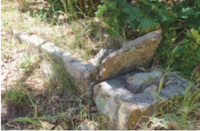
Foto 1.2.9. İçpınar Köyü Köy Dışındaki Mezarlıkta X No.lu Mezar

Yan kapakları ve şahide taşının geçirildiği taban taşı dışındaki taşlar bulunmamaktadır. Herhangi bir süslemesi bulunmayan mezarın yan kapakları ve şahide taban taşından anlaşıldığı kadarıyla ince işçiliğe sahip bir mezar"dır. Üst kapağı bulunmayan mezarın yan kapakları da toprak altında kaldığından bir süsleme unsuru olup olmadığı hakkında fikir edinilememektedir.