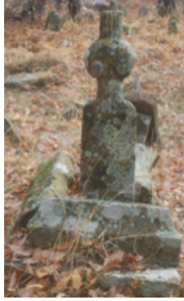
Foto 1.2.22. İçpınar Köyü Köy Dışındaki Mezarlıkta XXIII No.lu Mezar

Bir grup sarıklı mezar grubu içinde yer alan bu mezarın şahidesi ve sanduka taşları sağlam olup ayak taşı da mezar yüzeyinde bulunmaktadır. Sandukanın üst kapağı bulunmamakta ancak bu kapağın prizmatik bir kapak olduğu değerlendirilmektedir. Yan kapaklar ve ayak taşı yerinden oynatılmıştır. Şahide taşını taşıyan yüzeydeki arka kapak bulunduğu gruptakiler gibi içbükey bir oyma ile hareketlendirilmiştir. Şahide taşı dikdörtgen bir taş olup dairesel bir boyundan baş kısmına geçiş yapılmıştır. Baş kısmı taşırılmış sarık şeklinde kavukludur. Kavuk kısmı sarığın alt orta kısmında ve üst kısımda dikey düz çizgilere sahiptir.