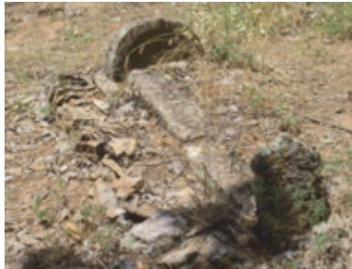
Foto 1.2.15. İçpınar Köyü Köy Dışındaki Mezarlıkta XVI No.lu Mezar

Tüm birimleri sağlam olarak günümüze ulaşmış olan bu mezarın kesin tarihini verecek herhangi bir yazısı bulunmamaktadır. Dikdörtgen prizma şeklinde olan sandukasının üst kısmı hariç diğer birimleri toprak altında kalmıştır. Şahide taşı yuvarlak formda olup iç yüzey yuvarlak kemerli bir niş şeklinde oyma tekniğinde yapılmış bir alana sahiptir. Bu kısımda herhangi bir yazı ya da süslemeye rastlanmamıştır. Ayak taşı dikdörtgen bir gövdeden sonra içe doğru bir kavisle baş kısmından ayrılmış ve baş kısım kaş kemer şeklinde son bulmaktadır.