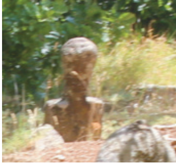
Foto 1.2.20. İçpınar Köyü Köy Dışındaki Mezarlıkta XXI No.lu Mezar

Bu mezarın sadece şahidesi günümüze ulaşmıştır. Toprak altında sanduka kısmının olup olmadığı bilinmemektedir. Ayak taşı da yerinde yoktur. İnsan başı şeklinde tasarlanmış olan şahide üzerinde herhangi bir süsleme bulunmamaktadır.