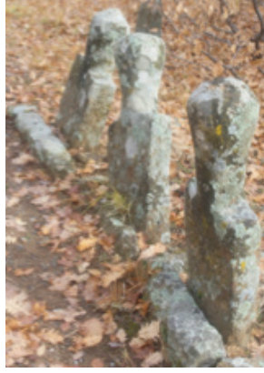
Foto 1.2.26. İçpınar Köyü Köy Dışındaki Mezarlıkta XXVII No.lu Mezarlar