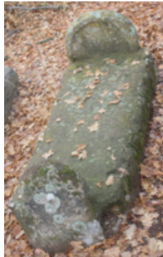
Foto 1.2.24. İçpınar Köyü Köy Dışındaki Mezarlıkta XXV No.lu Mezar

Bu mezar yuvarlak şahide taşına sahip yuvarlak kemerli niş şeklinde yapılmış mezarlar içinde yer almaktadır. Mezar sanduka şeklinde olup şahide taşı ve ayak taşı sağlam vaziyettedir. Ancak sandukanın kapak kısmı sonradan müdahale görmüş ve harç ile kapatılmıştır. Ayak taşı basit bir taş olup üçgen bir üst kısımla son bulmaktadır. Şahide taşı dairesel olup iç kısımda yuvarlak kemerli niş bulunmaktadır. Yüzeyinde herhangi bir süslemeye rastlanmamıştır. Sandukanın büyük kısmı toprak altında olduğundan bu yüzeyde de bir süsleme olup olmadığı tespit edilememiştir. Bu mezarın 1895 tarihli mezarda medfun olan Seydi Abdulcelil Bey'in dedesine ait olduğu köylüler tarafından ifade edilmektedir.