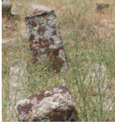
Foto 1.1.3. İçpınar Köyü Eski Mezarlıkta III No.lu Mezar

Köyün içinde bulunan ve şahide taşı, ayak taşı ve sandukasının bir kısmı sağlam vaziyette olan bu mezarın üzerinde, unsuru yosun ve likenlerden ve bir kısmının da toprak altında kalmasından dolayı, süsleme olup olmadığı tam olarak anlaşılmamaktadır. Şahide ve ayak taşı dikdörtgen formda yapılmıştır. Şahide taşının iç yüzeyinde üst kısımda kitabelik kısmı bulunmaktadır. Kitabelik dikdörtgen formda köşelerde birer santim silmelerle ile sınırlandırılmıştır. Ancak bu kitabe kısmında herhangi bir yazı veya süsleme bulunmamaktadır. Orijinalinde bu şekilde olup olmadığı veya bir yazıya sahip olup olmadığı hakkında da bir bilgi yoktur. Sandukanın üst kısmında pehle/kapak taşı bulunmamaktadır. Ancak sandukanın yan kapaklarının bulunması ve çevredeki taşlar dikkate alındığında bir kapak taşının olduğu ve daha sonra yerinden söküldüğü anlaşılmaktadır. Sandukanın iki tarafında bulunan ve yaklaşık 22 cm genişliğinde olan yan kapaklar sağlam vaziyettedir. Ancak büyük çoğunluğu toprak altında olduğundan sanduka yan kapakları üzerinde süsleme veya yazı unsuru olup olmadığı bilinmemektedir.