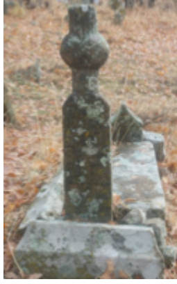
Foto 1.2.6. İçpınar Köyü Köy Dışındaki Mezarlıkta VII No.lu Mezar