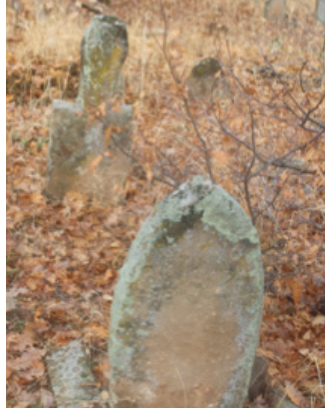
Foto 1.2.27. İçpınar Köyü Köy Dışındaki Mezarlıkta XXVIII No.lu Mezar

Bu mezar da insan başlı şeklinde tasarlanmış mezarlar grubunda yer almaktadır. Sandukasının yan kapakları, ayak ve şahidesi günümüze sağlam ulaşmıştır. Sandukanın dikdörtgen çerçevesini oluşturan taşlar sağlam olup üst kısımları hariç tamamen toprak altında kalmıştır. Ayak taşı basit bir formda olup sivri bir üçgen ile son bulmaktadır. Şahide taşının gövdesi dikdörtgen olup düz bir girinti ile boyun kısmına geçilmiştir. Boyun kısmı yanlarda hafif iç bükey şeklindedir. Baş kısmı taşırılmış şekildedir ve bir fesi andırmaktadır. Üçlü grup olarak bulunan taşlardan farklı olarak fes şeklindeki üst kısım bir fesin üstü gibi düz şekilde tasarlanmıştır.