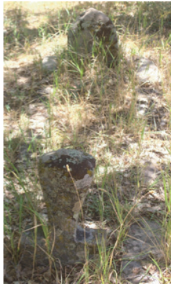
Foto 1.2.11. İçpınar Köyü Köy Dışındaki Mezarlıkta XII No.lu Mezar

Bu mezar şahidesi, ayak taşı ve yan kapakları ile sağlam vaziyettedir. Tüm birimlerinin büyük çoğunluğu toprak altında kaldığından üzerinde herhangi bir hareketlilik olup olmadığı bilinmemektedir. Şahidesi insan başı şeklinde yapılmıştır. Ana gövde inceltilerek boyun şekli verilmiş olup baş kısmı daha taşıntılı tutulmuştur. Ayak taşı ise üçgen alınlıkla son bulmaktadır.