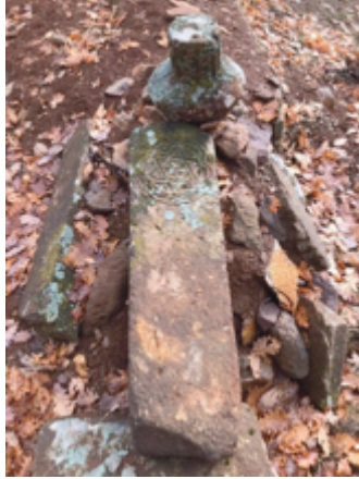
Foto 1.2.17. İçpınar Köyü Köy Dışındaki Mezarlıkta XVIII No.lu Mezar

Tüm taşları yerinden çıkarılmış olan bu mezarlık benzer sanduka ve başlığa sahip bir grup mezar ile aynı sıra içinde bulunmaktadır. Şahide taşının sadece baş kısmı kalmıştır. Baş kısmı tıpkı aynı sırada olan diğer mezar taşları gibi sarıklı kavukludur. Dikdörtgen bir şekle sahip olan ayak taşının üst kısmı tahrip olmasına rağmen kavisli bir yapıya sahip olduğu kalan kısımlardan anlaşılmaktadır. Ayak taşının ortasında daire şeklinde bir oyma bulunmaktadır. Bu dairenin içinde ortada bir gülbezek motifi yer almaktadır. Gülbezek motifinin çevresini Mührü Süleyman diye tabir ettiğimiz altı kollu yıldız çevrelemektedir. Altı kollu yıldız çift oluklu şekilde tasvir edilmiştir. Bu motifin etrafında daireye teğet şekilde devam eden kemer formlu şekiller sıralanmıştır. Daire formunun hemen üzerinde tahribattan dolayı tam mahiyeti çıkarılamayan bir motif bulunmaktadır. Görülebildiği kadarıyla bir lale motifidir. Mezarın sandukası oldukça düzgün bir işçiliğe sahip taşlardan oluşmaktadır. Bu taşlar yerinden oynatılmış ancak mezar üzerinde dağınık haldedir.