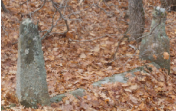
Foto 1.2.28. İçpınar Köyü Köy Dışındaki Mezarlıkta XXIX No.lu Mezar

Bu mezar yapısal özellikleri açısından diğer mezarlardan ayrıdır. Sanduka tipi mezar olan bu mezarın sandukası oldukça ince tutulmuş ve üçgen prizma şeklinde son bulmaktadır. Sandukanın üst kapağını oluşturan bu kısmın aşağıda devam edip etmediği toprak altında kaldığından tespit edilememiştir. Ayak taşı üçgen şeklinde bir taştır. Bu taş dış taraftan üçgen prizma şeklinde tasarlanmış iç kısımda ise düz tutulmuştur. Şahide taşı dikdörtgen prizma şeklinde bir gövdeye sahiptir. Gövdeden boyun kısmına işçiliği iyi olmayan bir girinti ile geçilmektedir. Boyun kısmının alt tarafı kalın tutulmuş yukarı doğru gidildikçe inceltilecek baş kısmına geçiş yapılmıştır. Baş kısmı taşırılmış bir insan başını anımsatmakla birlikte bu kısım tahrip edildiğinden mahiyeti tam olarak anlaşılamamaktadır.