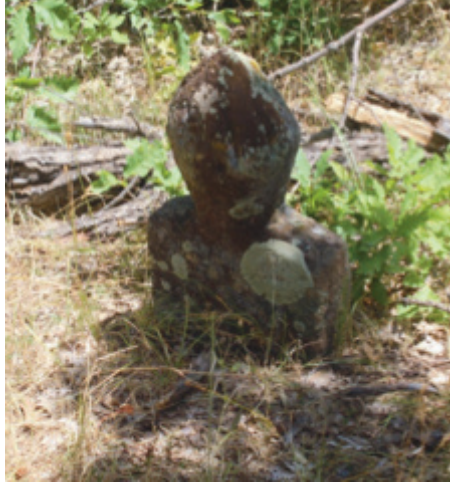
Foto 1.2.7. İçpınar Köyü Köy Dışındaki Mezarlıkta VIII No.lu Mezar

Bu mezarın sadece şahide taşı kalmıştır. Şahide taşının büyük bölümü toprak altında olduğundan alt yüzeylerde süsleme veya yazı olup olmadığı bilinmemektedir. Şahide taşının görünen tarafı bir insan başı şeklinde tasarlanmıştır. Üst kısımda bazı oymaların olduğu zar zor görülebilmektedir. Ancak yüzeyi kaplayan yosunlardan dolayı ancak kazı ve restorasyon sonrası bu oymaların mahiyeti hakkında bilgiler ortaya çıkacaktır. Bu tür mezar taşı mezarlık alanında birkaç mezarda daha görülebilmektedir.