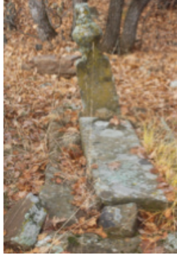
Foto 1.2.23. İçpınar Köyü Köy Dışındaki Mezarlıkta XXIV No.lu Mezar

sahip değildir. Taşırılmış kavuk düz bombeli bir yapıya sahiptir. Kavuk kısmı da silinmiş süslemesiz bir haldedir.