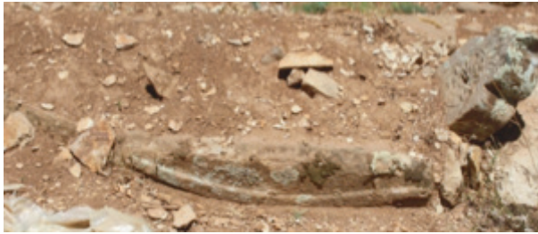
Foto 1.2.5. İçpınar Köyü Köy Dışındaki Mezarlıkta VI No.lu Mezar