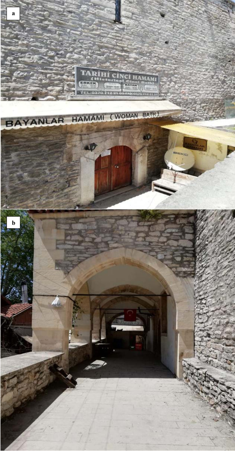
Fotoğraf 5. a: Cinci Hamamı bayanlar giriş kapısı b: Cinci Hamamı dış görünüm