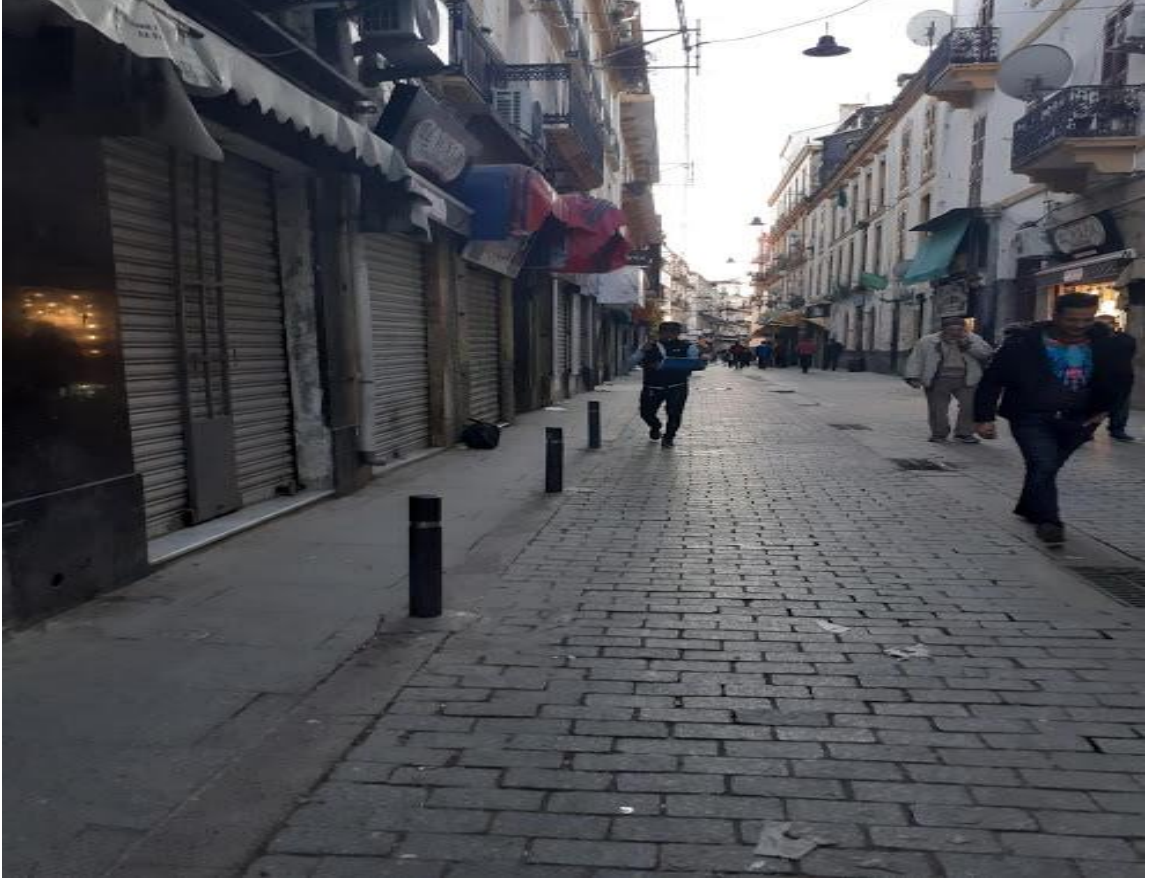
Saat 17.10 ve Konstantin’de el ayak çekilmiş

Konstantin’de 17.00’de çarşılar kapanır. Dükkânlar kapanmaya başlarken ortalık sakinleşiyor.