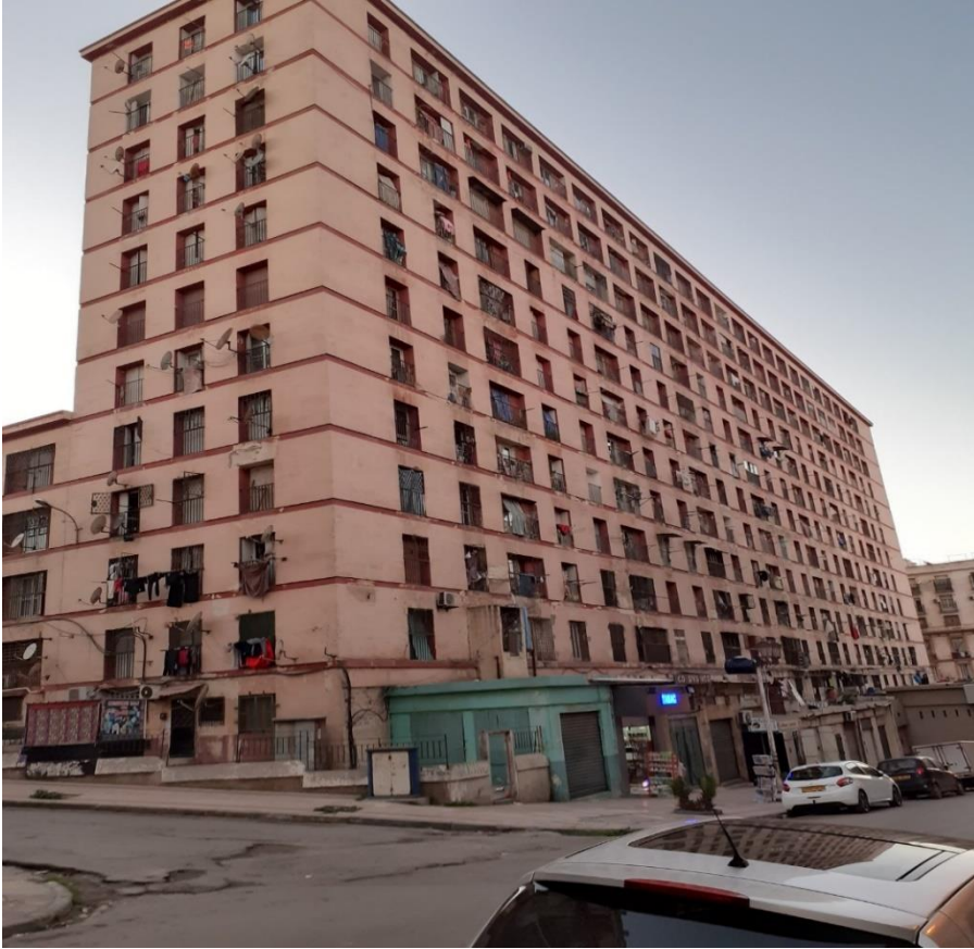
Vehran'da bir bina...