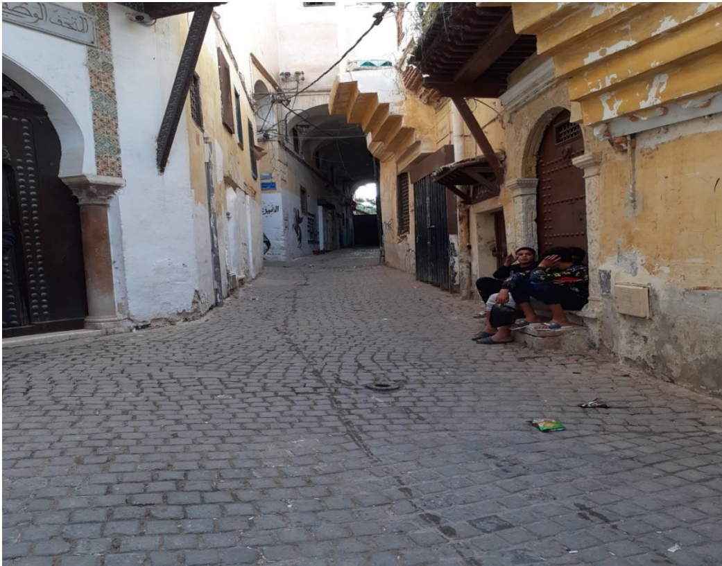
Cezayir Kasbah'ta sokak