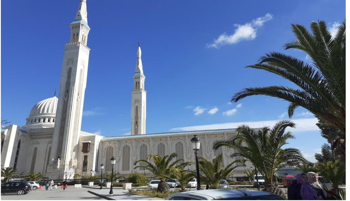
Konstantin Emir Abdulkadir Camii