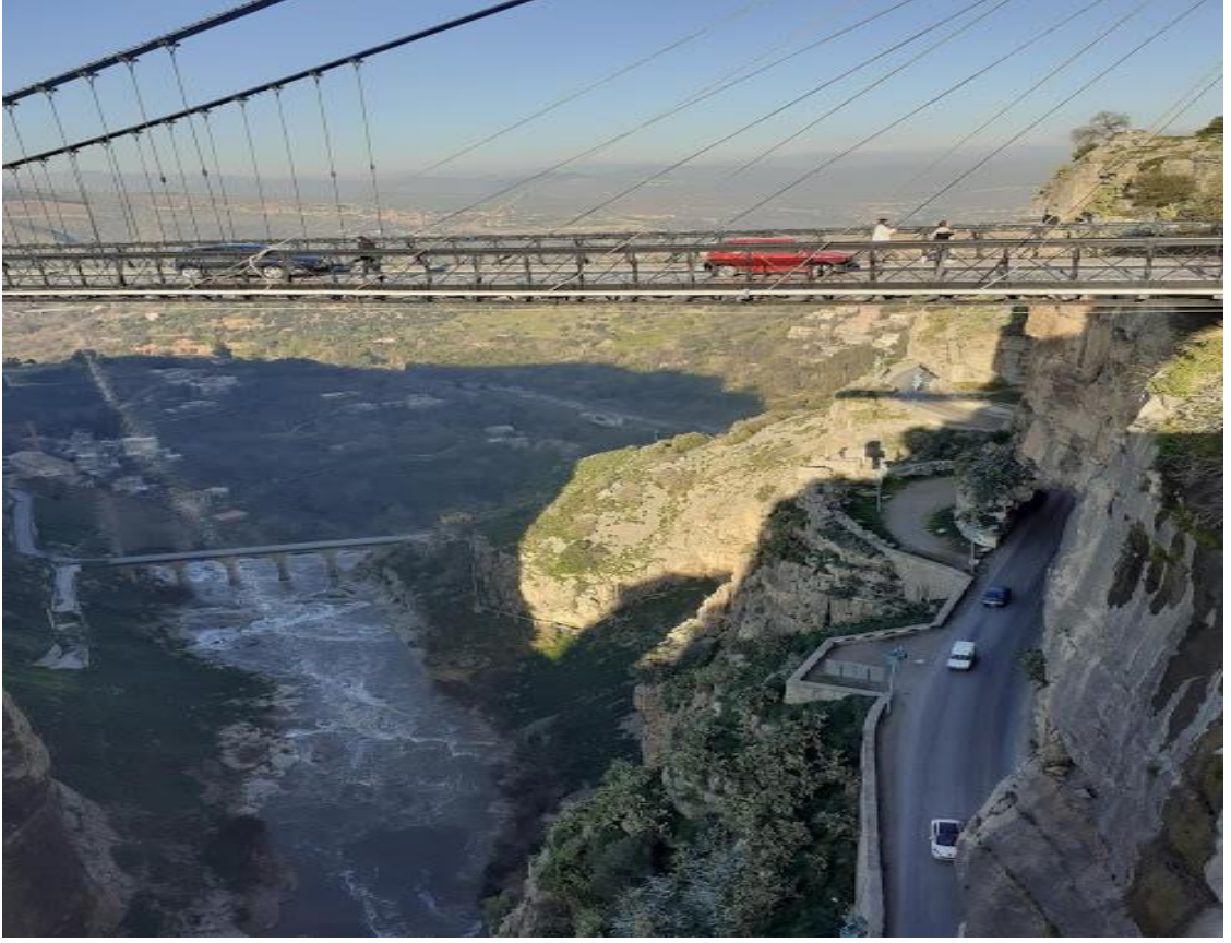
Konstantin'de kanyon ve köprüler