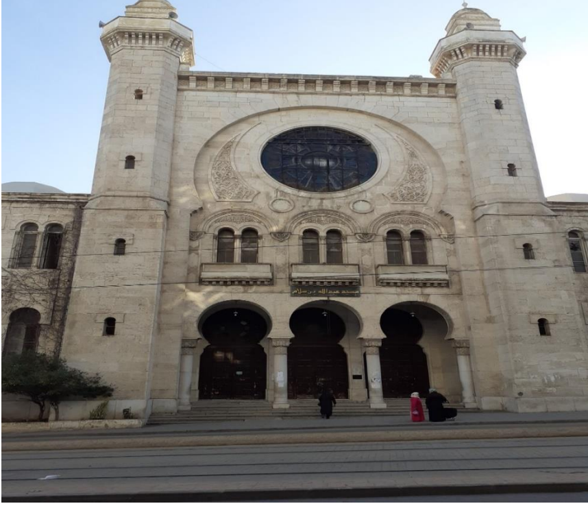
Vehran, Abdullah b. Sellam Camii