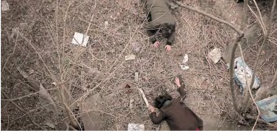
Görsel - 15

Yükseklik göstergesi olası bir ölümün işaretçisidir. Öz oğlunu öldüren Gang Do'ya acı dolu bir ders vermek için bir oyun tezgahlayan Mi Son'un aslında Gang Do'nun annesi olmadığı anlaşılmıştır. Onun amacı Gang Do'yu kendine bağlamak ve öldükten sonra da onun aynı acıyı yaşamasını sağlamaktır. Mi Son, intikamını bu şekilde planlamıştır.