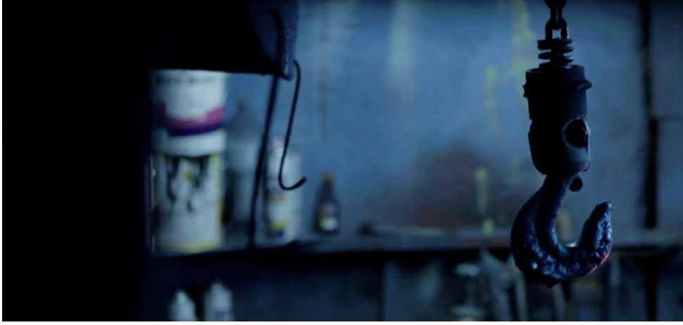
Görsel - 1

Film kendi dükkanında intihar eden bir adamın görüntüleriyle başlar. Demir askı az sonra yaklaşan ölümü gösterir. Adamın intiharı ekonomik sebeplere ve Gang Do'nun tehditlerine dayanmaktadır.