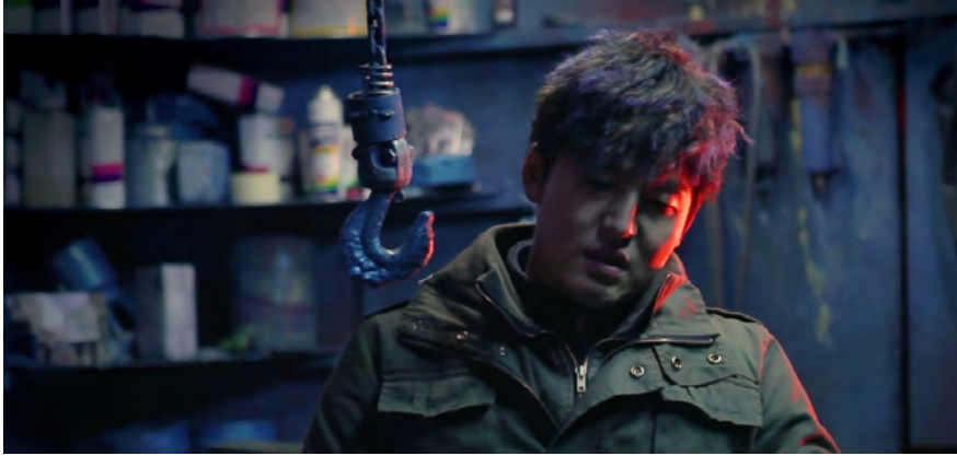
Görsel - 13

Bir gün Gang Do eve gelir ve evin her tarafının dağıldığını görür. Annesi biri tarafından kaçırılmıştır. Gang Do'nun korktuğu başına gelmiştir. Gang Do, haraç topladığı ya da tefecilik yaptığı tüm esnafı tek tek dolaşarak annesini kimin kaçırdığını bulmaya çalışır. Ancak her birinden büyük tepki alır. Annesini onlar kaçırmamıştır.