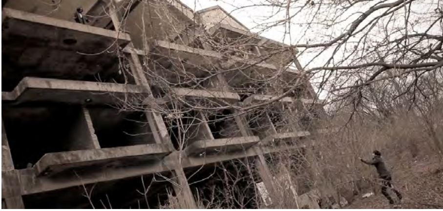
Görsel - 14

Yükseklik göstergesi olası bir ölümün işaretçisidir. Öz oğlunu öldüren Gang Do'ya acı dolu bir ders vermek için bir oyun tezgahlayan Mi Son'un aslında Gang Do'nun annesi olmadığı anlaşılmıştır. Onun amacı Gang Do'yu kendine bağlamak ve öldükten sonra da onun aynı acıyı yaşamasını sağlamaktır. Mi Son, intikamını bu şekilde planlamıştır.