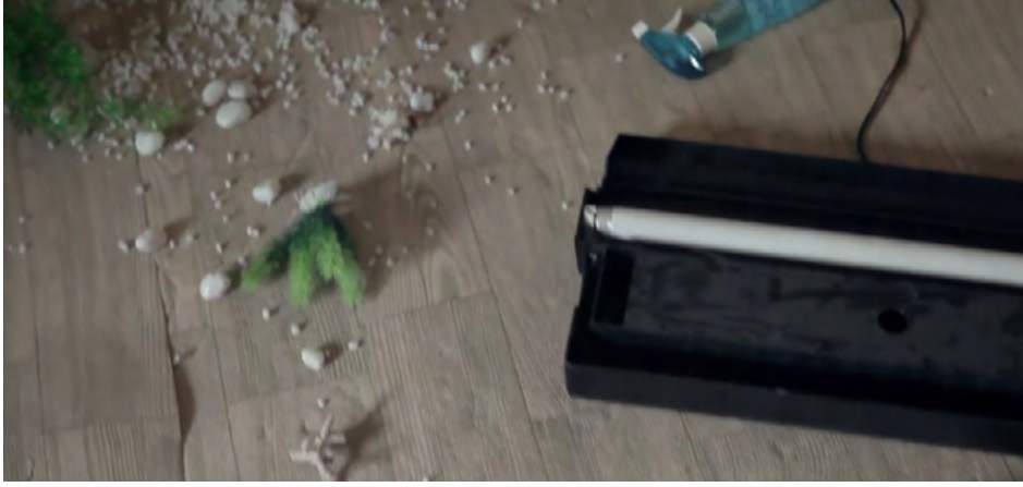
Görsel - 12

Bir gün Gang Do eve gelir ve evin her tarafının dağıldığını görür. Annesi biri tarafından kaçırılmıştır. Gang Do'nun korktuğu başına gelmiştir. Gang Do, haraç topladığı ya da tefecilik yaptığı tüm esnafı tek tek dolaşarak annesini kimin kaçırdığını bulmaya çalışır. Ancak her birinden büyük tepki alır. Annesini onlar kaçırmamıştır.