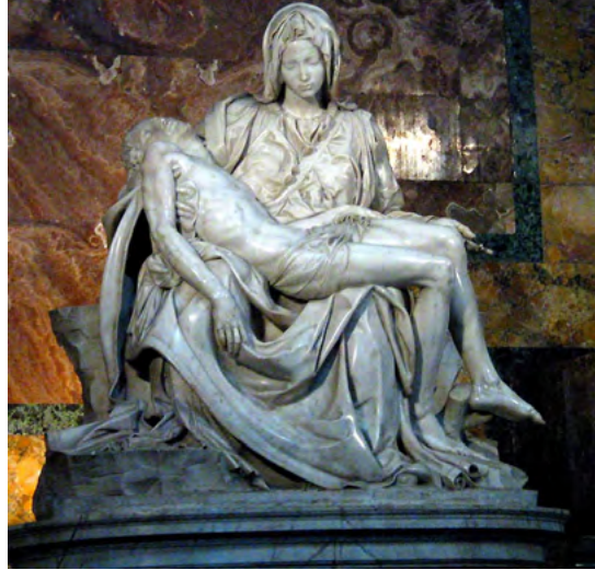
"Pieta" - Michelangelo (1498)

Filmin göstergebilimsel çözümlemesine geçmeden önce, filmin adını aldığı Michelangelo'nun ünlü Pieta heykelinden bahsetmek gerekmektedir. Pieta heykeli, İsa'nın çarmıhtan indirildiği ve Meryem'in onu kucağına aldığı anı canlandırır. Meryem bir eliyle İsa'yı kendi bedenine doğru sıkıca çekerken bir eliyle de onu seyircilere doğru sergiler ve fedakarlığından dolayı ona saygı duyulmasını ister. Filmde de yönetmen ana-oğul ilişkisi üzerine seyirciyi de ikilemede bırakan duygu git gelleri yaşatmayı tercih etmiştir.