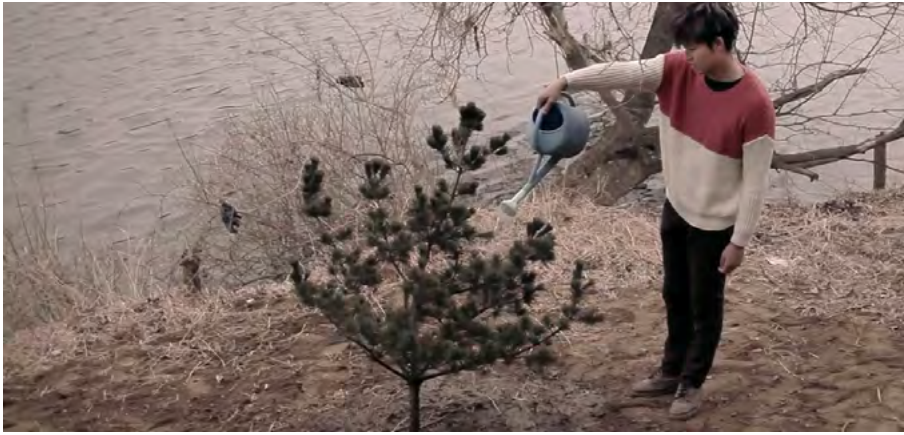
Görsel - 17

Mi Son'u gömmek için toprağı kazan Gang Do büyük bir şok yaşar. Zira, intiharına sebep olduğu Mi Son'un öz oğlunun cesediyle karşılaşır. Olayı çözen Gang Do, artık ebediyen annesi olarak göreceğı Mi Son'u da cesedin yanına yatırarak kendisi de onların yanına yatar. Bu bir kabullenişin göstergesidir.