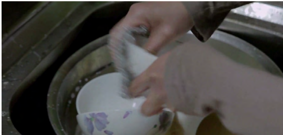
Görsel - 6

Mi Son, Gang Do'yu takip eder ve zorla evine girer. Hemen mutfaktaki kirli bulaşıkları yıkamaya koyulur. Bu gösterge, Mi Son'un oğlu Gang Do'ya kendini