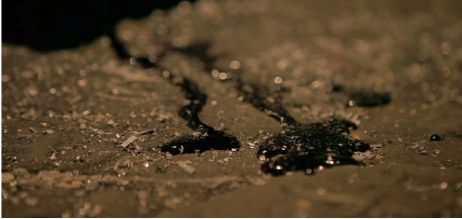
Görsel - 4

Gang Do tahsilat yapmak üzere bir esnafın dükkanına gidip zor kullanmaya başlar. Esnafın gözündeki korku Gang Do'nun etrafına korku salan bir tetikçi, mafya için çalışan bir tefeci olduğunu kanıtlamaktadır.