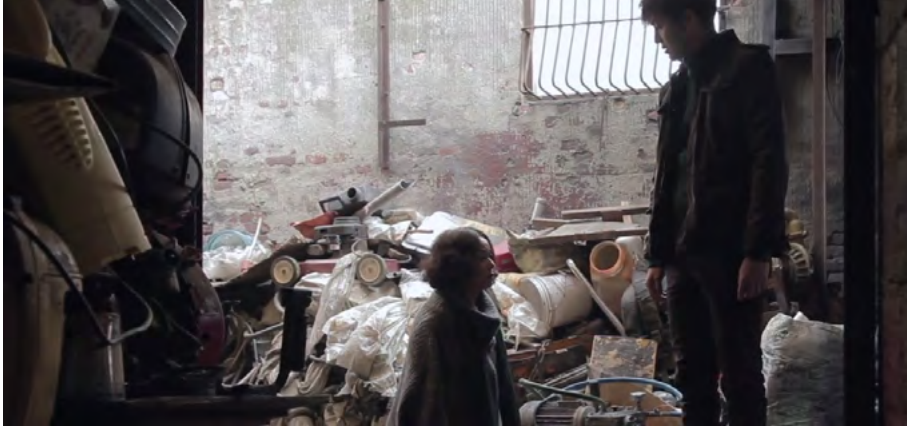
Görsel - 7

kabullendirmesi için geçerlidir. Ev temizliđi genelde kadınların ilgilendiđi bir mevzu olduđundan dolayı, her erkeđin anne ya da eř olarak bir kadına ihtiya duyabileceđini de simgelenmektedir.