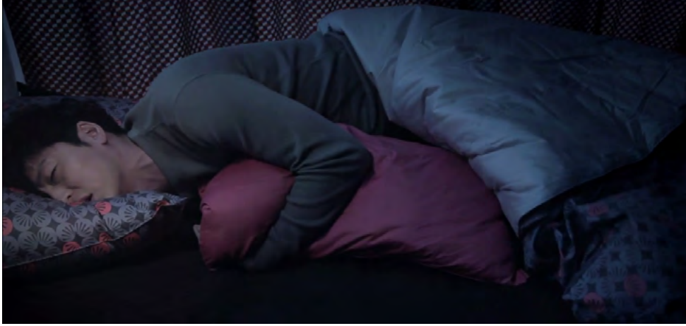
Görsel - 2

Film kendi dükkanında intihar eden bir adamın görüntüleriyle başlar. Demir askı az sonra yaklaşan ölümü gösterir. Adamın intiharı ekonomik sebeplere ve Gang Do'nun tehditlerine dayanmaktadır.