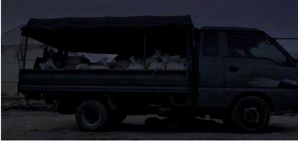
Görsel - 18

Gömme işleminden sonra yaşama dair herhangi bir beklentisi kalmayan Gang Do, filmin başlarında kolunu koparttığı esnafın yaşadığı yere gelir ve adamın karısının az sonra kullanacağı kamyonetin altına kendini zincirleyerek ölümü bekler.