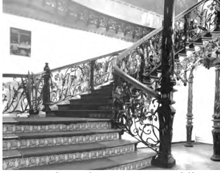
Resim 10: Raimondo D’Aronco, Hidiva Sarayı

Doğrusal veya kabartmalı bezemeler- sonsuz şekil çeşitliliktedirler. Formlar kıvrılan, durgun, akıcı, pürüzsüz ve akışkandır. Bir nesnenin veya yapının gövdesi, doğada kararsız, biyolojik ve ruhsal yaşam güçleriyle donatılmış, yaşayan, gelişen bir organizmanın nitelikleriyle karakterize edilmiştir. Yükselen, sallanan kütleler, organik formların hızlı ve pürüzsüz hareketi, şeffaf ve hafif doğrusal süsleme ritimleri, demir destekleri ve ızgaraları yapıdan binaya, malzemeden malzemeye, ahşaptan demire, taştan alçıya, alçıdan mermere, hacimli formlardan süslemelere veya tam tersi olmak üzere hep geçiş halinde ifade edilmiştir.