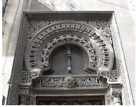
Resim 16 - 17: Skibiński, Aga Bala Guliyev Konağı

Sarkıt kornişiyile kabarık köşe rizalitler tamamlanmış bina kompozisyonu tamimiyle tek hacim halinde çözülmüş ve büyük plastiklikte farklılık göstermektedir. Eugeniusz Skibiński'nin 20. yüzyıllar başlarındaki inşa edilmiş bu konak Azerbaycan ulusal mimarisinin bir abidesi konumundadır.