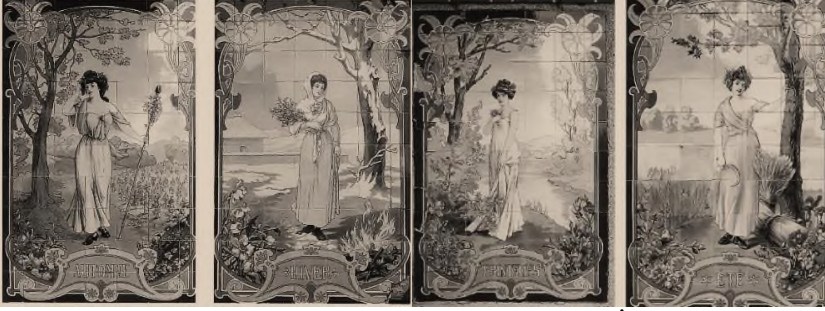
Resim 11: Raimondo D'Aronco, Villa Mon Plaisir. İç mekân çini panolar.

değerlendirilmektedir. Art Nouveau kompozisyonunun diyolojik doğası tam olarak bu olmuştur.