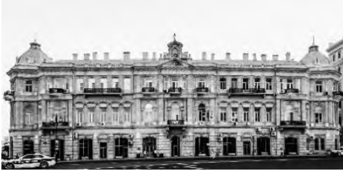
İsa Bey Hacinsky Konağı