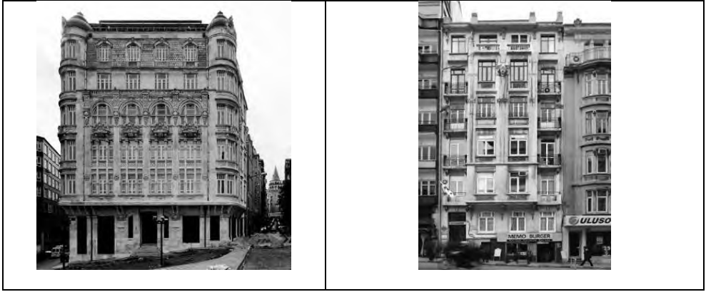
Tablo 2: Bakü Art Nouveau Yapıları