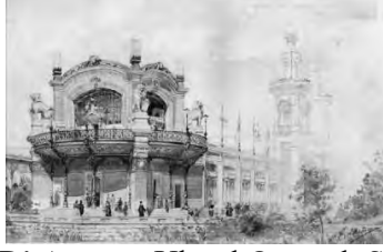
Resim 3: Raimondo D' Aronco, Ulusal Osmanlı Sergisi Pavyonu, 1893.

İstanbul'u Avrupai hâle getirme sürecini hızlandırmak olmuştur. Bu yüzden şehrin büyük ölçekte planının oluşturulması amacıyla sözleşmeler yapılmıştır.