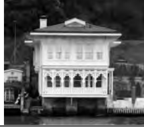
Ahmet Ratip Paşa Köşkü https://www.themaggar.com/art-nouveau-tarzi-binalar-istanbul/