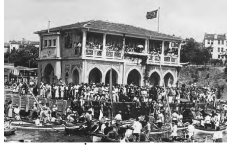
Resim 6- 7: Haydarpaşa ve Moda İskeleleri.