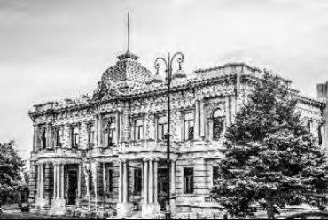
Seyid Mirbabayev Sarayı

https://azens.az/az/news/azneftin_binasi_seyid_mirbabayevin_sarayi