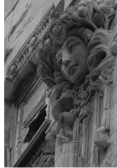
Resim 16: Botter Apartmanı, İstanbul.

İstanbul'un mimarisinin stilize edilmiş formları ve süsleme motiflerinin temaları çok çeşitlidir. Bu konu çağ sınırı fikriyatıyla bağlantılı simgesel-edebi çağrışımların geniş bir katmanına bürünmektedir. Birinci duygu halimemnunniyetsizlik, özlem, dönemin gerçeğine olan hayal kırıklığı, o gerçekliğin acımasızlığı, ayrılıkları, tarihin tüketilişini, uçurum hissi ve niceleri Art Nouveau bakış açısı olmuştur. Gençlik, yeniden doğuş, sonsuz yaşam, umutlar, ön sezgiler, beklentiler ise ikinci duygu halini oluşturmuştur. Zamanın geçiş hissi, kararsızlık, güvensizlik, dayanağı ve temeli kaybetme bu hislerden ayrılamaz olmuştur. 'Bu yüzden mi ki rüzgarla sallanan uzun dallı çiçekler, esnek otlar, yosunların ve kamışların uzun gövdeleri sevilir, bu yüzden değil mi ki Art Nouveau yalın geometrik formlardan ve düz kenarlardan kaçınır...' (Sokolov, 1912).