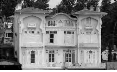
Yıldız Sarayı, Ada Köşkü