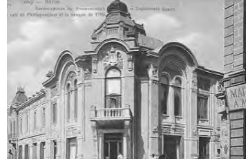
Sadikhov Kardeşleri Evi

https://azens.az/az/news/azneftin_binasi_seyid_mirbabayevin_sarayi