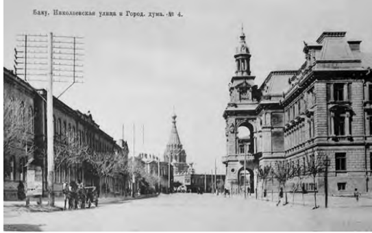
Resim 9: Józef Gosławski, Bakü Şehir Meclis Binası.

20. yüzyıl başlarındaki yetenekli mimarlarının son temsilcisi olan sivil mühendis Ziverbek Ahmedbekov, ulusal mirası ve onun gelişiminin propagandasını yapmıştır. Tasarımcının Taza-Pir Camii, İttifak ve benzer birçok başarılı dini yapıların projeleri yapılmıştır.