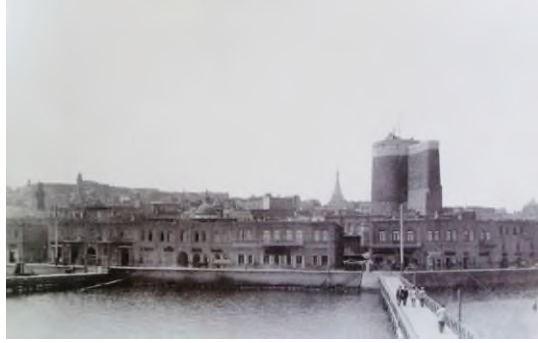
Resim 2: Bakü, sahil görüntüsü, 1898 yıl.

Rus hâkimiyetine 19. yüzyılın başlarında giren Bakü kenti ise, günümüze kadar kısmen korunmuş sur duvarlarıyla çevrili küçük bir yerleşim yeri olmuştur. Rus konutlarının yeni tipolojileri mimari ve inşaatta kendi düzen yasalarını oluşturmaya çalışmışlardır. Bakü kentinin inşası 19. yüzyılın ilk yarısında Rus Klasisizminin himayesinde, askeri mühendislerin gözetiminde, yapılmıştır. Bu dönem, yerel mimarların geleneksel yolla inşa etmeyi sürdürdükleri, ancak hala bilmedikleri mimari fenomenleri gözlemledikleri bir dönemdi. Devamında mimari gelenek ve inşa kültüründe yerel ve yabancı mimarların ortak yaratıcılığında özgün bir mimari sistem ortaya çıkmıştır. Oluşan bu sentezle, çeşitli içeriklerde, farklı hacim ve silüetlerle, muhteşem yapılar oluşturma imkânı sağlanmıştır (Fatullayev - Figarov, 1998).