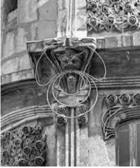
Resim 15: Vlora Han, İstanbul.

yaygındır. Art Nouveau'da yılan görünümlülerin, sürüngenlerin kıvrımlıların, hareketlilerin, kırbaç darbesi hatlarına, salyangoz antenlerine benzer hatlar veya hem güç ve enerjiyle dolu hem de bitkin, zayıf, öfkeli ve gergin çizgilerin çeşitliliği sınırsızdır. Bu sembolleri, Beyoğlu'nda İstiklal 44 numaralı caddesinde, apartmanın ön cephelerinde, Eminönü'nde Vlora Han'ında, Mercan Freska Han'ında ve Beyoğlu'nda Botter apartmanında görmek ve incelemek mümkündür. Deniz kızı, insan başlı at ve b. 'hibrit' yaratıklar gibi sonsuz değişimi, dönüşümü, yaşam olaylarının değişe bilirliliğini sembol eden her tür melez semboller 20. yüzyıl başlangıç mimarisi için spesifiktir olmuştur.