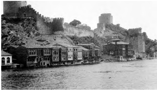
Resim 1: İstanbul 1900 yıllar

Avrupa akımları etkisinde çalışan yabancı mimarlar, çalışmalarında yerel mimarinin özelliklerini kullanmaya, binaların sanatsal özünü ifade eden yorumu söz konusu binaların hacimsel ve alansal kompozisyonlarına aktarmaya çalışmışlardır. 19. yüzyılın sonlarında mimarların yerel mimariye olan bu eğilimi, daha sonraları Türk mimarisinde Oryantalizm, Azerbaycan mimarisinde ise Ulusal Romantizm akımlarında kendini göstermiştir.