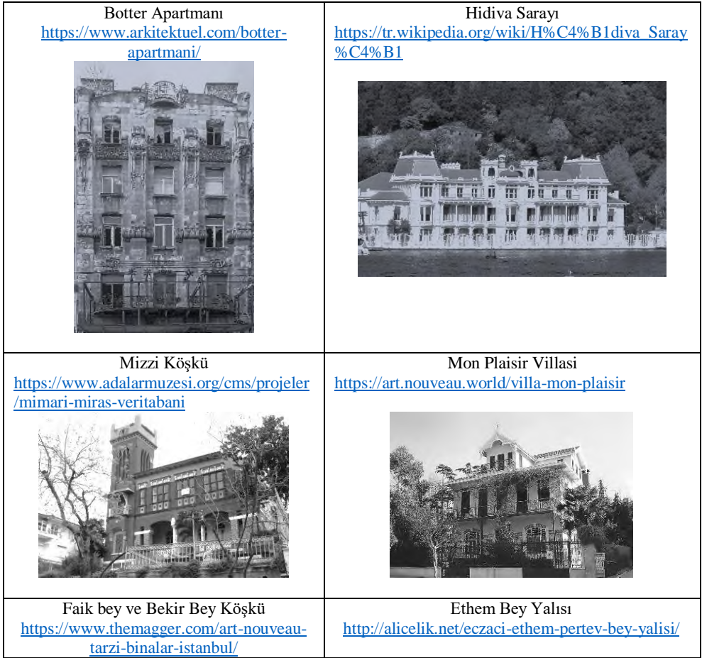
Tablo 1. İstanbul Art Nouveau Yapıları