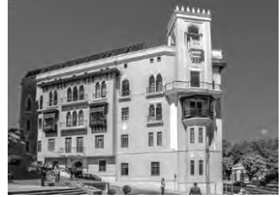
Sabunci Tren Gari