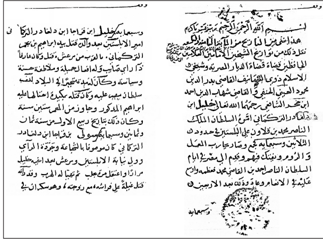
Ek-2: Vekâyi' et-Türkmân'ın ilk iki sayfası