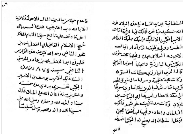
Ek-3: Vekâyi' et-Türkmân'ın son iki sayfası