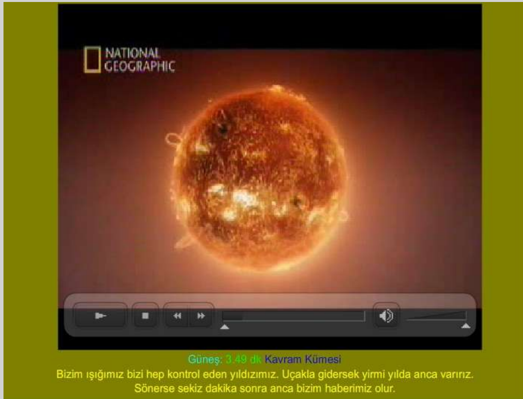
Resim 3: Güneş kavramının görsel ve işitsel hazırlanan ara yüz sayfası