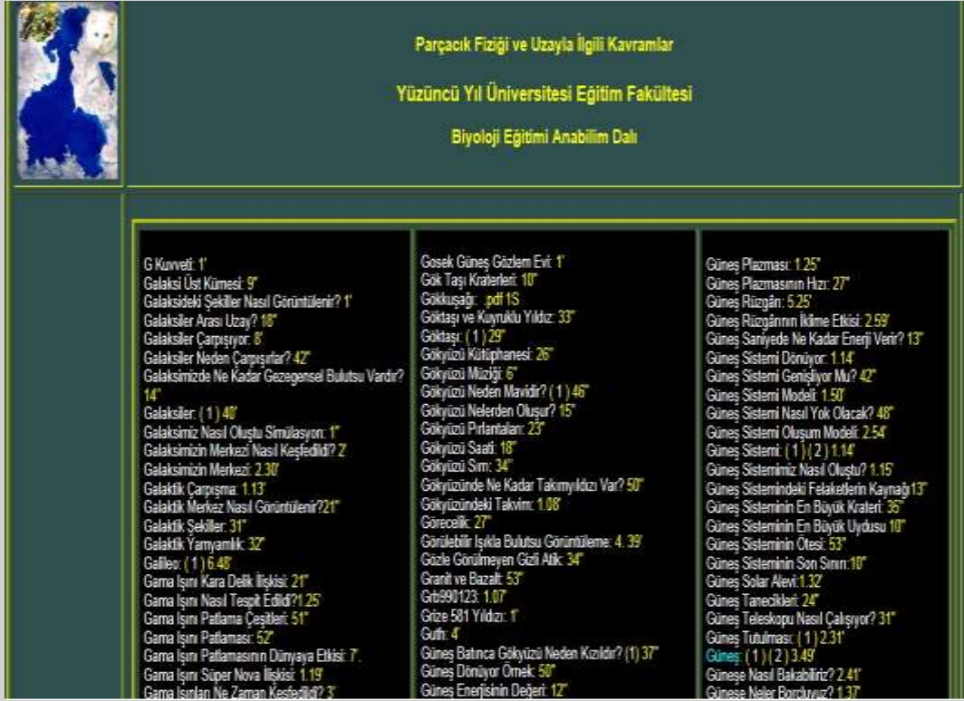
Resim 2: “G” harfi ile başlayan bazı kavramların bulunduğu ara yüz sayfası