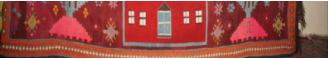
Fotoğraf 9: Cami tasvirli duvar kilimi detay