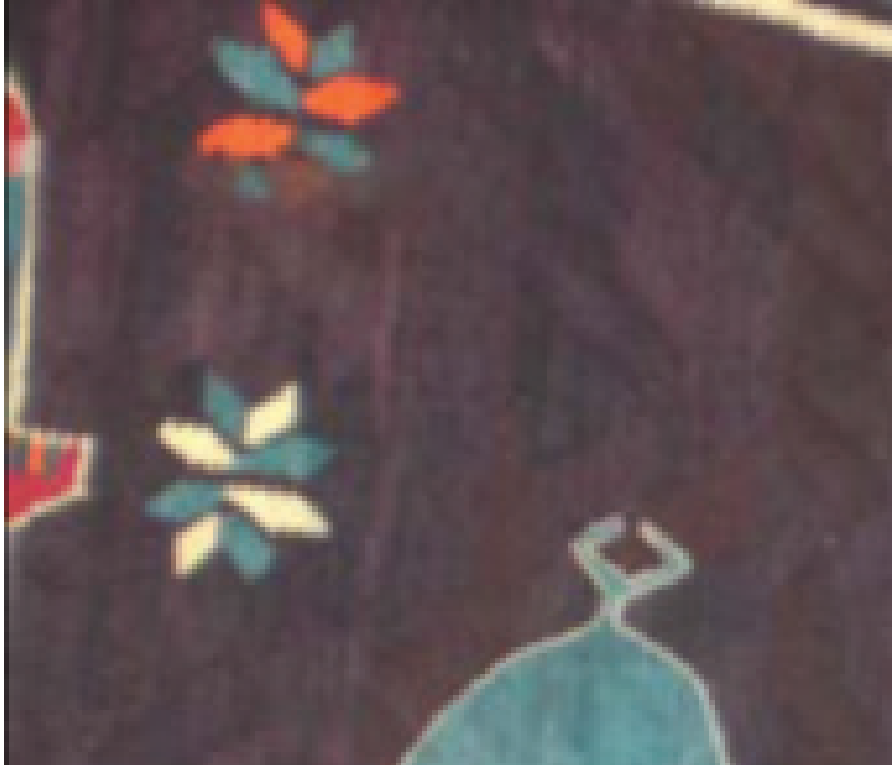
Fotoğraf 11: Serbest olarak zemine yerleştirilmiş “kilim yaprağı (yıldız) motifleri

Kompozisyon; Dokuma, kalın kenar kuşağı ve zeminden oluşmaktadır. Kenar kuşakta bordo zemin içinde dal ve yaprak motifi (stilize çiçek) görülmektedir. Kuşak; mavi, siyah, beyaz renklerden oluşan “taraklı” motifiyle (tarak) çevrenmiş, zemin üçe bölünmüş ve içi cami tasviri ile kompoze edilmiştir. Üç katlı olarak dokunan cami, kubbe ve minarelerden oluşmaktadır. Bu kompozisyon kilim eninde üç kez farklı renklerde tekrarlanmıştır. Boşluklarda “kilim yaprağı” motifleri (yıldız) serbest olarak yer almıştır. (Fotoğraf 11).