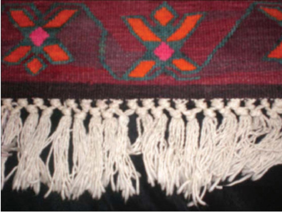
Fotoğraf 14: Cami tasvirli duvar kilimi saçak detayı