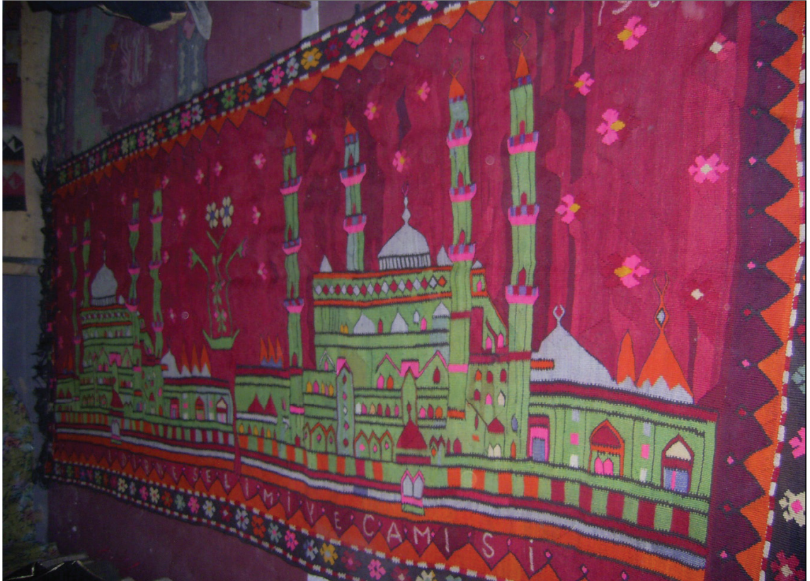
Fotoğraf 6: Cami Tasvirli Duvar Kilimi

Kırmızı zemin üzerinde iki adet cami kompoze edilmiştir. Cami, dört adet minare ve kubbeden meydana gelmektedir. Boşluklarda “purne motifi” (stilize çiçek) ve hayat ağacı motifleri yer almaktadır. Kilimin uzun kenarının bir tarafında “Edirne Selimiye Camisi, 1961” tarihli kitabe dikkati çekmektedir. İlikli kilim, iliksiz kilim ve konturlu kilim tekniğiyle dokunan kilimin saçakları, bükülerek temizlenmiştir. Yörede saçakların bu teknik ile temizlendiği farklı örnekler de incelenmiştir. Kilim sağlam olarak duvarda sergilenmekte ve muhafaza edilmektedir (Fotoğraf 6-7).