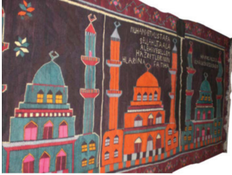
Fotoğraf 12: Cami tasvirli duvar kilimi