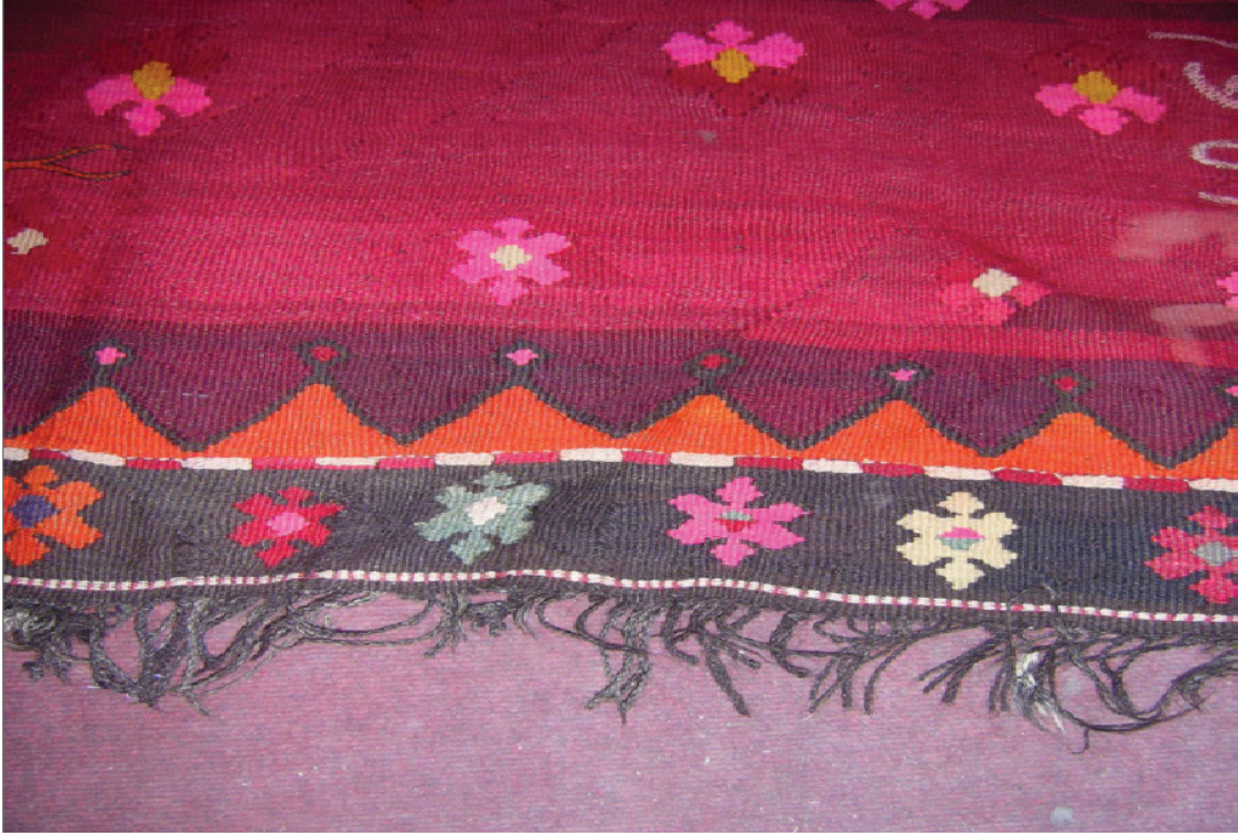
Fotoğraf 7: Cami Tasvirli Duvar Kilimi Saçak Detayı