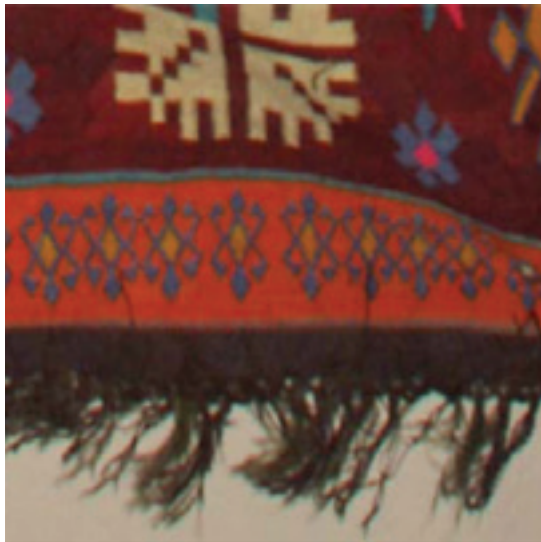
Fotoğraf 10: Cami tasvirli duvar kilimi saçak detayı