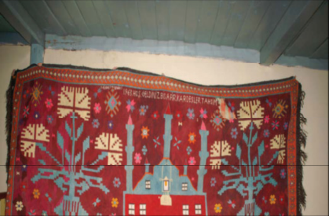
Fotoğraf 8: Cami tasvirli duvar kilimi