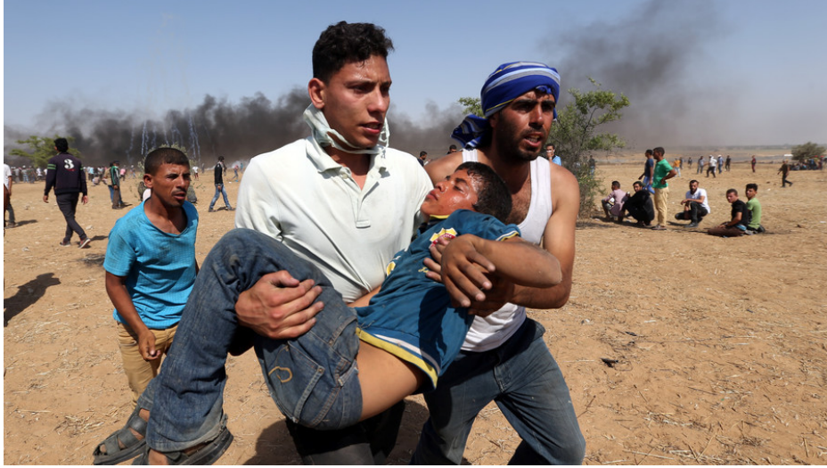
Görsel 1. Filistinli göstericiler, RT, 8 Haziran 2018

konulu fotoğrafların yarısına yakını oluşturmaktadır. Bu kategorideki fotoğraflar sahada hem tek tek hem de kalabalık halinde göstericileri, İsrail'in göstericilere gökten yağın gaz atışlarını ve siyah duman dolu protesto sahnelerini canlandırmaktadır. İkinci sıradaki sahada yaralı ve ölü ile üçüncü sıradaki gösterici atışları ise, bir yandan yakından ve bariz görülen yaralanan ve ölen göstericileri, diğer yandan da taş ve yanık lastik gibi şeyleri fırlatan göstericileri sunmaktadır.