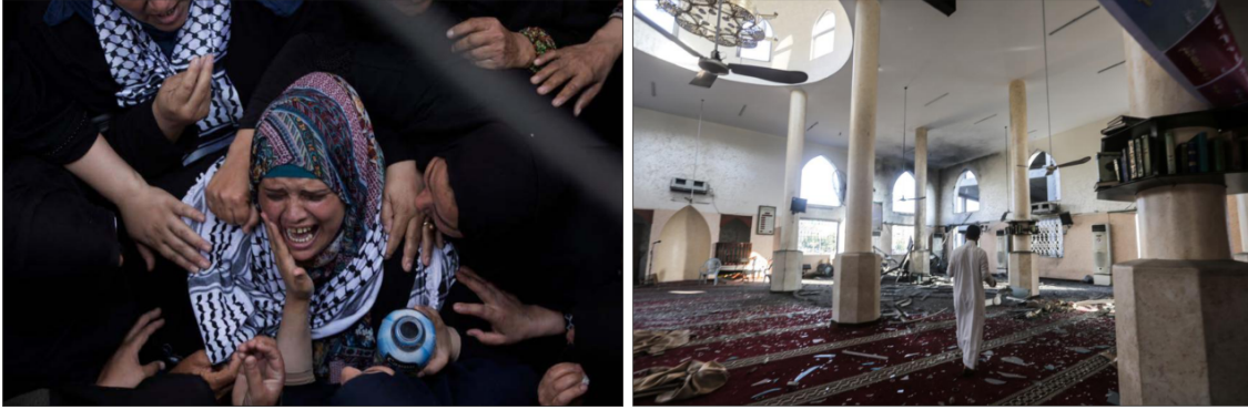
Görsel 3. “Kayıplara ağlayanlar ve cenaze” ile “harabeler” kategorilerine giren görüntüler, TRT World, 2 Haziran ve 14 Temmuz 2018

çok daha fazla olduğu görülmüştür. RT ile TRT World 'un bu kategorideki fotoğrafları kullanma oranları sırasıyla %4.9 ve %5.8 iken, buradaki yüzde onluk farka belki de büyük önem atfedilmeyebilirdi. Ancak protestocuları tehdit olarak resmeden CNN 'in önceki bulguları ışığında düşünüldüğünde, onlarla uyum gösteren bu veriler de kaçınılmaz olarak göze çarpmaktadır. Sözgelimi, CNN 'in “Görüntü: Protestocular Beytullahim’de İsrail güçleriyle çatıştı” 48 başlıklı 15 Mayıs tarihli haberinde çatışmaların resmedildiği dört fotoğrafın hepsi de göstericilerin İsrail askerlerine bir şeyler atarken çekilen görüntülerden oluşmaktadır. CNN International 'ın haberlerinden gösterici atışları kategorisine giren fotoğraflara örnekler Görsel 2’de sunulmuştur. Aynı şekilde, gökte füzeler uçuyor kategorisi sadece CNN (%8.4) için oluşturulmuş olup, füze ve yangın çıkaran uçurtmaların fotoğraflarıdır ve sadece Filistinliler tarafından gelenleri resmetmişlerdir.