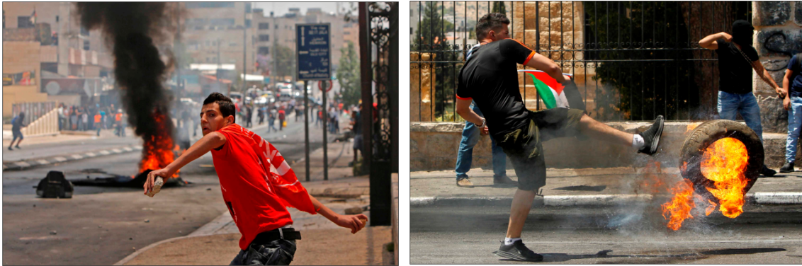
Görsel 2. Gösterici atışlarını resmeden fotoğraflar, CNN, 14-16 Mayıs 2018

Sahada yaralı ve ölü göstericileri, başka bir deyişle belki de olayların en etkileyici ve hüznü sahnelerini sunmada RT %28.4'lük bir oranla diğer haber sitelerini önemli ölçüde geçmiştir. Kuşkusuz, protestoların kendisini resmetmek ile Görsel 1'deki gibi bu protestolardan etkilenenleri resmetmek arasında önemli fark vardır. Bu, en azından okurların protestoya katılanlarla empati kurmalarını mümkün kılmaktadır. Bu tarz fotoğrafları görüntülemeye TRT World %16'lık oran ile ikinci sıraya yerleşmişken, CNN International %8.4 ile yaralananları en az gözler önüne seren taraf olmuştur.