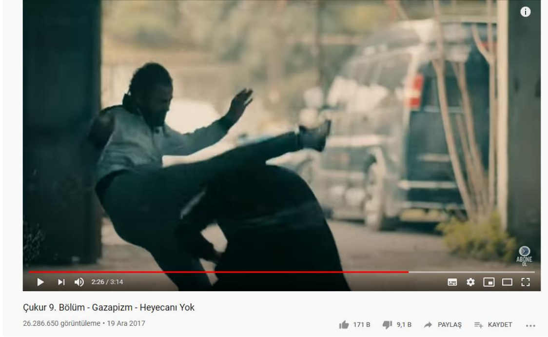
Resim 2. Çukur Dizisi Yamaç Koçovalı - Serdar Karakteri Çatışma Sahnesi

Yine aynı dizide Aras Bulut İynemli'nin canlandığı Yamaç Koçovalı karakterinin Serdar adlı karakter ile yaşadığı döğüş ve silahlı çatışma sahnesi diğer sahnelerine göre en fazla izlenen videolardan olmuştur (bkz. Resim 2).