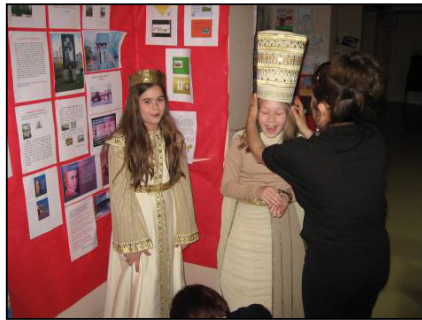
Şekil 2. Tasarlanan kostümlerin Ankara Üniversitesi Vakıf Okulu'nda prova alması