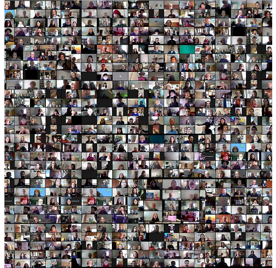
Görsel 1. Kanada'da 3 Nisan 2020'de düzenlenen 920 kişi katımlı ilk çevrimiçi iklim toplantısından bir görüntü 15

Bir başka başarılı protesto gösterisini de genç aktivistler Kanada'da yüzlerce kişinin katılımıyla düzenledikleri ilk çevrimiçi iklim toplantısının ekran görüntüsünü viral hale getirerek gerçekleştirmiştir. Bu görsel çevrimiçi faaliyetlerin önemini vurgulamak adına sosyal medya platformlarında pek çok kez paylaşılmıştır (Görsel 1).