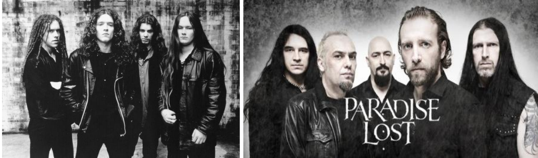
Şekil 3. Gotik Metal müzik gruplarından Anathema, Paradise Lost

Gotik Metal: Gotik metal, daha saldırgan bir yapıdadır, Rock kültürüne daha yakındır. Karanlık ve depresif bir atmosfer hakimdir. Şarkı sözleri Orta çağ havasını taşımakta ve aşırı duygusal olabilmektedir. Anathema, Paradise Lost ve My Dying Bride öncü grupları olarak bilinmektedir (Tsatsishvili, 2011: 28) (Şekil 3).