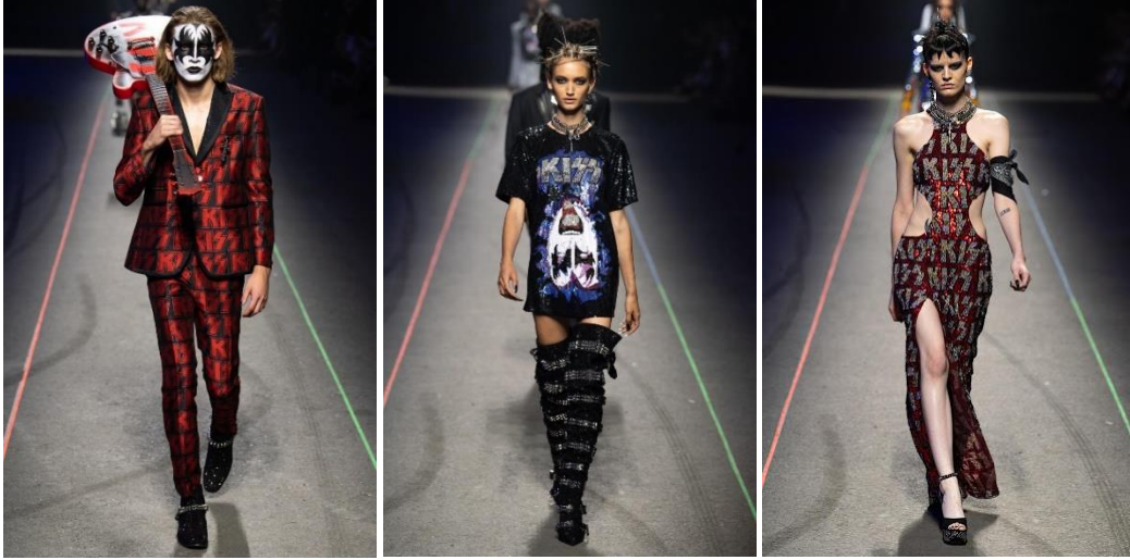
Şekil 10. Philipp Plein'in 2020 İlkbahar/Yaz koleksiyonunda metal müzik etkileri