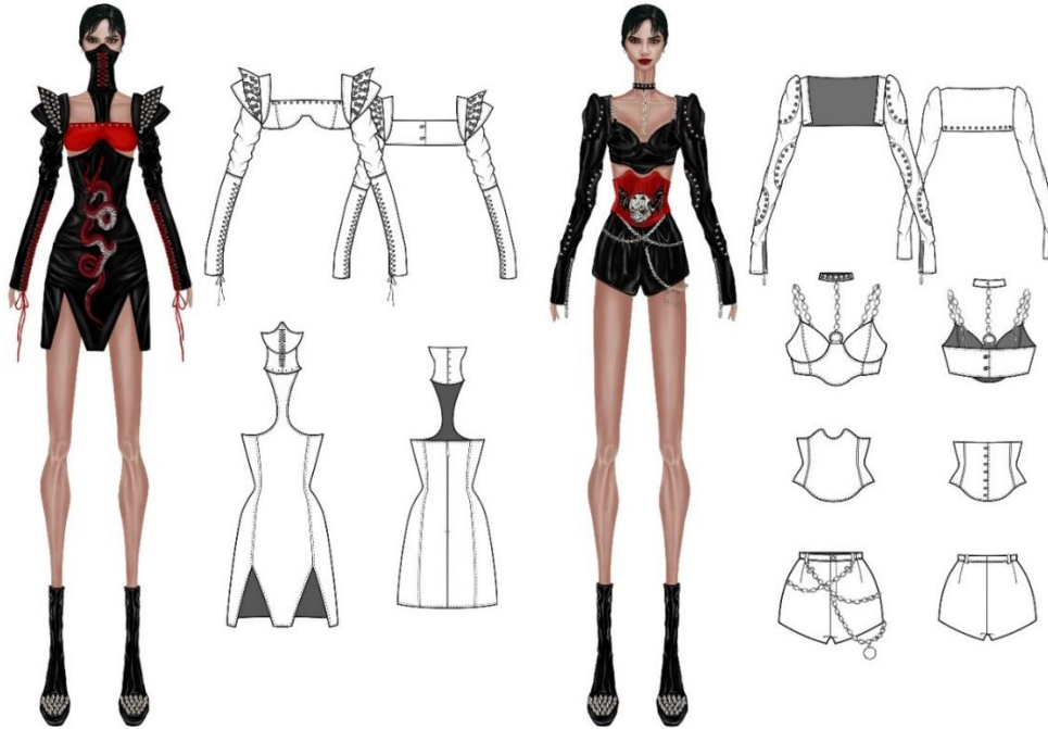
Şekil 15. “The Devil Inside Us” adlı kişisel koleksiyon, Murat Tuna, 2020

Birinci tasarım, omuz detaylı uzun kollu bir büstiyer, diz üstünde yırtmaçlı bir elbise ve elbisenin boyun kısmına çıtıç ile sabitlenmiş çıkarılabilir bir maske olmak üzere 3 parçadan oluşmaktadır. Büstiyerin metal zimba aksesuarlarla bezenmiş, omuzlara sabitlenmiş siyah deriden oluşan parçasının üzerine de metal çivi aksesuarlar yerleştirilmiştir. Omuzdan dirseğe kadar siyah rugan kumaş, dirsekten parmak ucuna kadar ise yine siyah deri kullanılmış ve kırmızı bağcıklarla bağlanmıştır. Burun hizasından başlayan maske boyun kısmında elbiseye çıtıç yardımı ile sabitlenmiştir (Şekil 15).