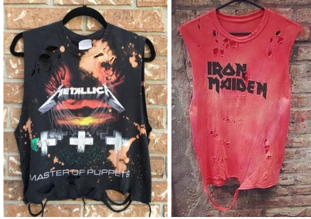
Şekil 6. Metal müzik gruplarının logoları ile desenlendirilmiş baskılı t-shirt örnekleri

Metal müzik hayranları ise genellikle üzerinde sevilen grubun logosu ya da görseli bulunan eskimiş görünümlü t-shirtler, denim pantolonlar, deri ceketler giymeyi tercih etmektedirler. Zincirler, kemerler ve kuru kafa sembollü çeşitli aksesuarlar da yaygın olarak kullanılmaktadır (Şekil 6).