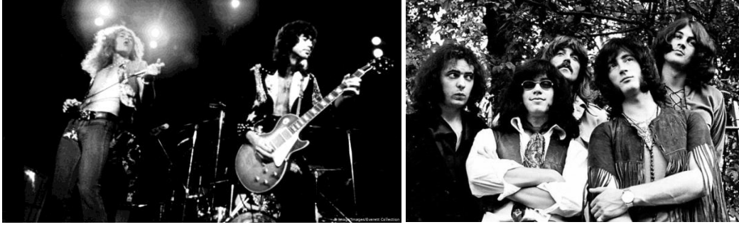
Şekil 4. Klasik Metal müzik gruplarından Led Zeppelin, Deep Purple (Kaynak: URL 9-10)

Sabbath olarak sıralamak mümkündür (URL 8) (Şekil 4).