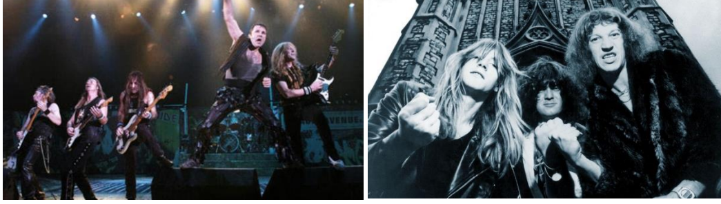
Şekil 2. Yeni Dalga İngiliz Heavy Metal müzik gruplarından Iron Maiden, Angel Witch

Yeni Dalga İngiliz Heavy Metal (New Wave of British Heavy Metal): “New Wave of British Heavy Metal akımında şarkılar çok daha melodik bir yapıya sahiptir, tempo artmaktadır. İngiliz Iron Maiden, Saxon, Motörhead, Def Leppard, Angel Witch, Tygers Of Pan Tang, Sweet Savage, Demon (Şekil 2) öncü gruplar olarak bilinmektedir (Çerezciöğlü 2011: 24-25).