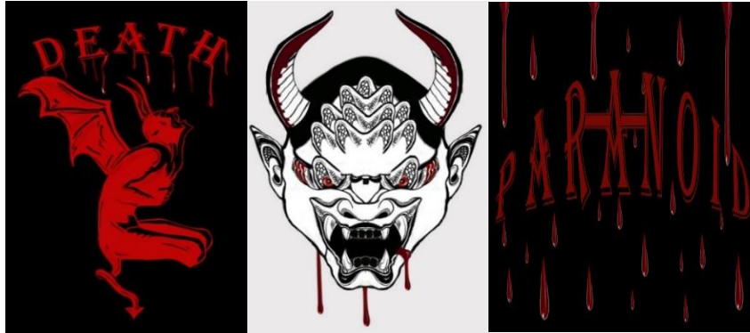
Şekil 14. “The Devil Inside Us” adlı kişisel koleksiyon için tasarlanan desenler, Murat Tuna

gruplarının şarkılarının isimlerini taşıyan desenler tasarlanmış ve koleksiyonun ismi “The Devil Inside Us” olarak belirlenmiştir (Şekil 13,14).