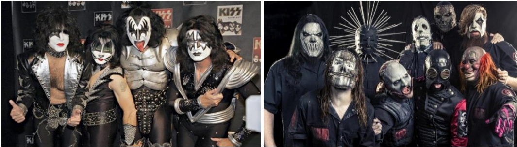
Şekil 5. Metal müzik gruplarından Kiss, Slipknot

Tarza özgü giysiler, makyaj ve aksesuarlar metal müzik kültürü için vazgeçilmezdir. Grubun giyim kuşamı, şarkı sözleri ve müzik tarzı, albüm kapağını, sahne tasarımını, logosunu etkilemektedir. Özellikle Kiss, Alice Cooper, Lordi, Slipnot gibi metal müzik gruplarının giyimlerinin yanı sıra makyajları ve sahne performansları oldukça dikkat çekicidir (Şekil 5).