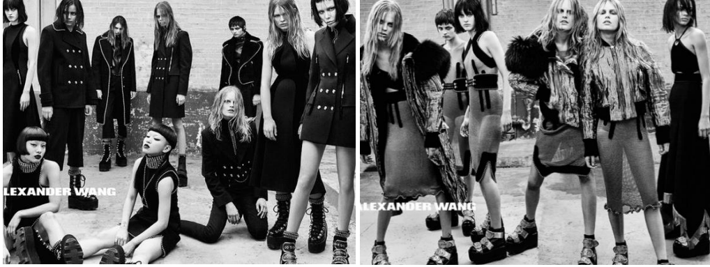
Şekil 8. Alexander Wang'ın 2015 Sonbahar hazır giyim koleksiyonunda metal müzik etkileri

Örneğin ünlü moda tasarımcısı Alexander Wang 'ın 2015 Sonbahar hazır giyim koleksiyonunda metal müzik etkilerine rastlamak mümkündür. Siyah rengin hakim olduğu koleksiyonda gümüş metallere, zincirlerle süslenen ceketler, elbiseler ve pantolonlar yer almaktadır. Makyaj ve saç stillerinde metal müzik grupları Marilyn Manson ve Kiss'in etkilerine rastlamak mümkündür (URL 17) (Şekil 8).