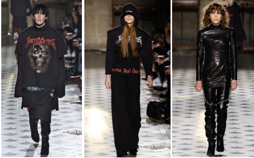
Şekil 11. Vetements'in 2016 Sonbahar koleksiyonunda metal müzik etkileri

Vetements'in 2016 Sonbahar koleksiyonunda ise siyah ve kırmızıya vurgu yapan kuru-kafa sembolü sloganlar taşıyan tişörtler, kapüşonlu sweatshirtler, kesilmiş, parçalanmış vintage denimler, rüzgarlıklar, deri pantolonlar, yüksek uzun çizmeler yer almaktadır (Şekil 11).