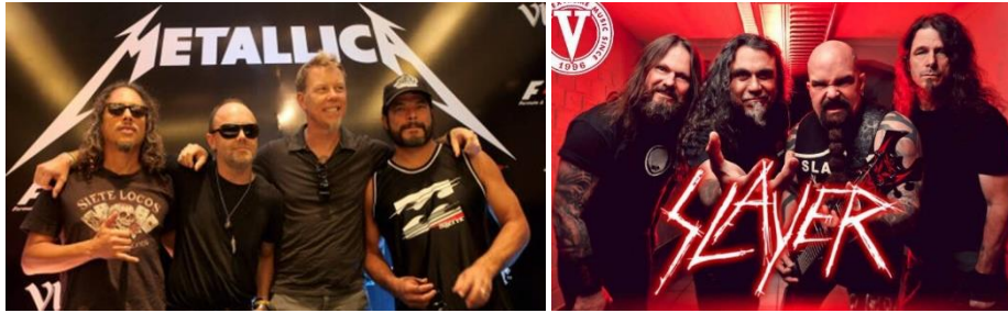
Şekil 1. Trash Metal müzik gruplarından Metallica, Slayer

Trash Metal: Trash Metal'de sözler daha kısa ve nettir. Yüksek tempolu düzen, düşük tonlama, karmaşık gitar riff uygulamaları ve saldırgan, umursamaz sözler trash metalin karakteristik özelliklerindedir (Varol, 2012: 36). Metallica, Megadeth, Metal Church, Artilery, Overkill, Venom gibi gruplar ise bu tarzın öncülerindedir (Şekil 1).