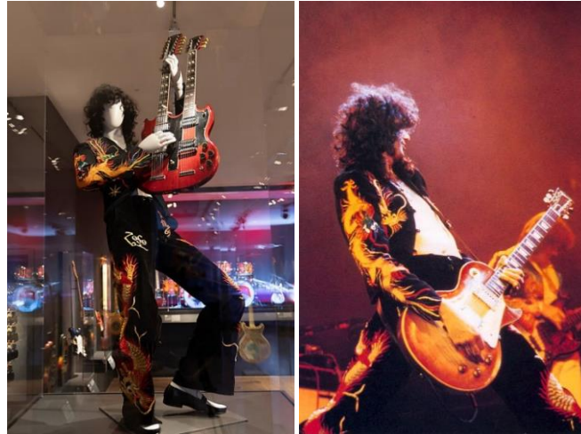
Şekil 7. Jimmy Page'in sahne kostümü 'The Dragon Suit'

Led Zeppelin grubunun üyesi Jimmy Page, 1975'ten 1977'ye kadar Led Zeppelin ile canlı performansları sırasında çoğunlukla "Dragon" isimli takımını giymiştir. (George 2013:129) Metropolitan Müzesinde sergilenen bu takımındaki el işleminin tamamlanmasının bir yıldan fazla sürdüğü bilinmektedir (URL 15) (Şekil 7).