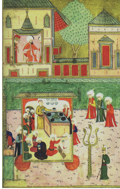
Şekil 1. III. Murad'ın Şehzadeleri İçin Yapılan Sünnet Şenliklerini Anlatan Surname-i Hümayun'da (Levni) Kahveci Loncası Arabasının Geçşi, 1587-88.

ğı ortadan kaldıracak tedbirler yerine, siyasi otorite tarafından ters yönde adım atılır ve 1583'te kahvehaneler kapatılır" (Işın, 2000, s.29). Yasaklamaya ilişkin III. Murat'ın fermanı, içerik bakımından II. Selim'in fermanıyla paralellik gösterir 3 .