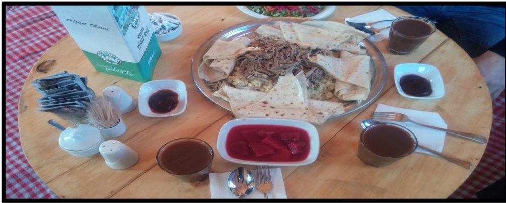
Görsel 2: Kavak yöresinin geleneksel yemeklerinden biri olan kaz tirdi

Kavaklı insanların kaz tirdi (görsel 2) yapma geleneğini devam ettirdiği görülmektedir. Kavak derneklerinin teşviki ve kültürel değerlere verdiği önemi idrak eden dernek üyesi kadınlar bu geleneği evlerde sürdürmeye devam etmektedir. Kaz tirdi yapılacağı zaman en az yirmi kişi davet edilir ve genellikle iki kaz, tirit yapmak için kullanılır. Bu geleneğin dikkat çeken bir yönü de yemeklerin yer sofrasında yenmesidir. Ayrıca yemekler eskiden tek bir tabaktan yenirken günümüzde ayrı tabaklarda yenmektedir. Davete gelemeyen komşulara, hasta ve yaşlı kimselere kaz payı gönderme geleneği devam etmektedir. Davet esnasında kadınlar, kaz tirdinin nasıl yapıldığını birbirlerine anlatır. Bu sırada evde bulunan kızlar bu tariflerden nasibini alır (K.K.9).