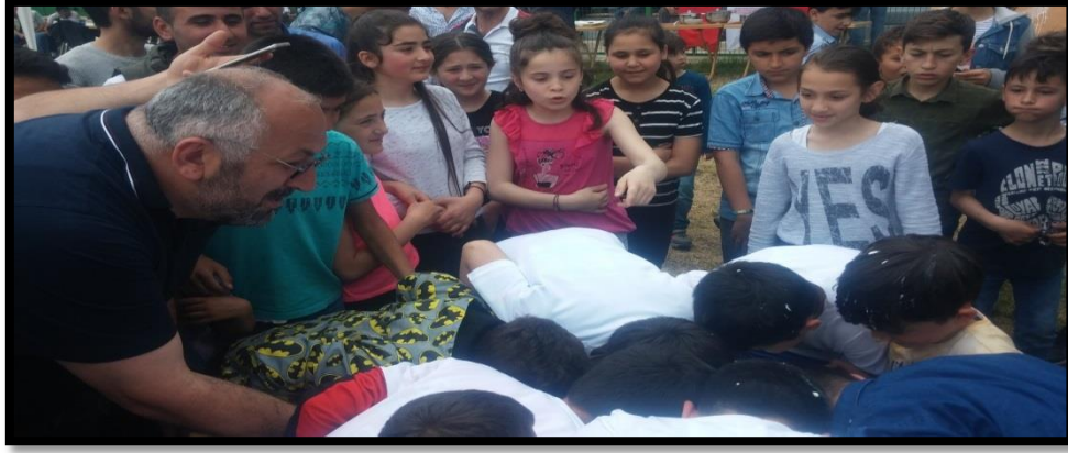
Görsel 1: Geleneksel Kavak Yaşar Doğu Karakucak Güreşleri'nde çocuklar yoğurdun içindeki parayı bulmaya çalışırken

KADEF tarafından düzenlenen bir başka faaliyet de Tirit Etkinliği 'dir. Bu etkinlik her yıl kış mevsiminde düzenlenir. Kavak yöresinde akrabaların ve dostların bir araya gelmesini sağlayan bu etkinlik KADEF tarafından yaşatılmaya çalışılmaktadır. Bu bakımdan geniş katılımlı bir Tirit Etkinliği düzenlenmektedir. Bu etkinlik, Kavak'ın kültürel değerlerini korumanın yanında bu değerleri Türk ve dünya kamuoyuna tanıtmayı amaçlamaktadır.