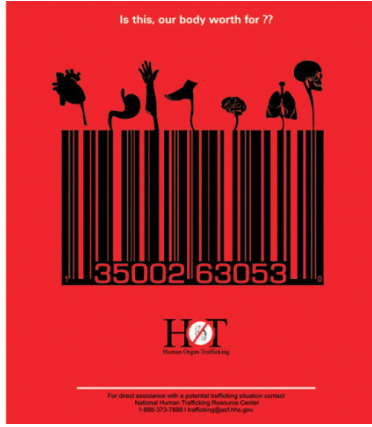
Resim 2. Fiyat Konulu Poster