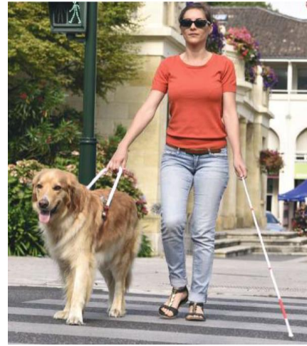
Şekil 3. Engellilik durumuna ilişkin fotoğraf örneği