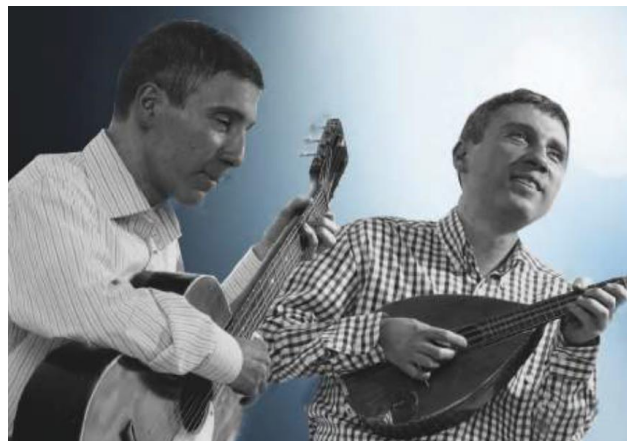
Şekil 5. Tema ve kodlara ilişkin örnek fotoğraf