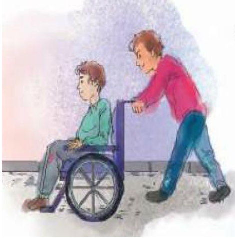
Şekil 2. Engellilik durumuna ilişkin resim örneği

Görseller, engelli bireylere yönelik çizimlerden meydana gelmektedir. Fotoğraflar, engelli bireylere içeren fotoğraflardan oluşmaktadır. Metinler, içerisinde engelli bireyleri veya engellilik temasını barındıran yazılı kaynaklardan oluşmaktadır. Fotoğraf-metin, engelli bireyler ile ilgili bir metnin, engelli bireyi barındıran bir fotoğrafla desteklenmesini içermektedir. Resim-metin, engelli bireyler ile ilgili bir metnin engelli bireylere yönelik çizimler ile desteklenmesini içermektedir. Araştırmada veriler kategorize edilirken nitel analiz; veriler sayı, frekans ve yüzde ile ifade edilirken nicel analiz tekniği kullanılmıştır.