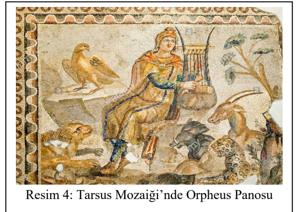
Resim 4: Tarsus Mozaığı'nde Orpheus Panosu

Roma Dönemi örneklerinin çoğunda Orpheus diğer bütün “barbar” halklar gibi giyimli bir şekilde tasvir edilir. Onun Klasik ve Hellenistik tarzda, tanrısal çıplaklık ile gösterildiği örnek oldukça azdır. Yarı çıplak tasvirli Tanrısal Orpheus betimi içeren az sayıdaki örnekten biri de Edirne Müzesi'ndeki kabartmadır. Bu kabartma, Roma Devri Mozaik panolarında sıklıkla görülen “Hayvanlar”ın merkezindeki Orpheus” temasını tekrar etmekle birlikte ana figürün Tanrılara yakıştırılan bir çıplaklıkla tasvir edilmiş olması ile farklılık sergiler. Roma Dönemi'nin yaygın işlenişleriyle bir başka benzerlik ise Orpheus'un başında yer alan “Phryg başlığı” isimli uzun kaküllü başlıktır.