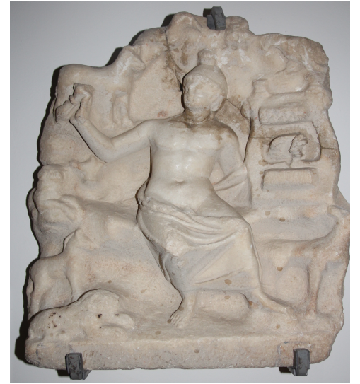
Resim 1: Edirne Müzesi'ndeki Orpheus Kabartması

Kabartmanın merkezinde kayalık bir alanda oturan yarı çıplak bir erkek figürü yer alır. İnce bir kumaş, tüm gövdeyi açıkta bırakacak şekilde belinden itibaren alt kısmı kapatır. Figürün vücudu cepheden tasvir edilmiş,