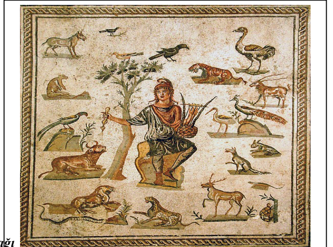
Resim 5: Palermo Müzesi Orpheus Mozaïği

( https://en.wikipedia.org/wiki/Orpheus_mosaic )