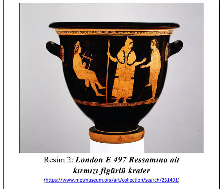
Resim 2: London E 497 Ressamına ait kırmızı figürlü krater

Betimdeki ilk hayvan figürü, merkezdeki figürün sağ ayak dibindedir. Oturur vaziyetteki bu figür, her ne kadar yüz detayları işlenmemiş olsa da bir aslan olmalıdır. Onun üstünde ise sırası ile yelesi ve dik kulaklı bir sığa (?) ve bir koç figürü işlenmiştir. Kabartma panosunun kenarında işlenmiş olan bu figürlerin yönü merkeze dönüktür. Koç figürünün hemen sağ yanında bir boğa başı cepheden gösterilmiştir. Merkezdeki insan figürünün sağ kolunun üstünde yine merkeze doğru yönelen, dikkat kesilmiş köpek figürü yer alır. Onun üstünde persepektife uygun bir şekilde işlenmiş gagalı bir kuş (Ördek?), panonun en üstünde, büyük ölçüde aşınmış olsa da cepheden tasvir edilmiş olduğu anlaşılan bir baykuş ve sağ üst köşede ise yine önemli ölçüde yıpranmış olan, kanatları açık bir kartal figürü yer alır. Merkezdeki insan figürünün sol ayağının dibinde, lirin altına gelecek şekilde ise sağa doğru boynu uzamış bir pardalis kabartması görülür.