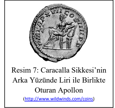
Resim 7: Caracalla Sikkesi'nin Arka Yüzünde Liri ile Birlikte Oturan Apollon

Edirne Müzesi'ndeki Orpheus Steli'nde de bu figür de Roma Dönemi'ndeki birçok diğer betimin tersine, tanrısal çıplaklığı ile Apollon'a öykünen bir betimleme ile sunulmaktadır. Orpheus'da izlenen duruş ve izlenim özellikleri benzer birçok Apollon yontu ve resminde görülebilmektedir. Bu eserdeki Orpheus figüründe olduğu gibi gövdenin belden aşağı kısmını örten giyimli, Iyr ya da kithara çalan figürler antik sanatta en çok Apollon betimlerinde karşımıza çıkar. Bu betimleme Hellenistik Dönem'den itibaren birçok farklı sanat dalında kendini gösterir 36 . Miletos Faustina Hamamları'nda bulunan ve İstanbul Arkeoloji Müzeleri'nde sergilenen "Apollon ve Mousalar Grubu"ndaki Apollon yontusu 37 (Res. 6), gövdeyi çapraz aşan sadak kayışı