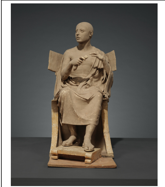
Resim 3: Paul Getty Müzesi'nden Oturan Şair (Orpheus)

Bu eserde görüldüğü şekliyle bir kayalık üzerinde ya da sandalyede oturarak kithara veya lir çalan Orpheus betimlenmesinin bilinen en erken örneği Metropolitan Müzesi'nde sergilenen, London E 497 Ressamına ait kırmızı figürlü bir krater üzerinde yer alır 1 (Res. 2). Benzer sahneleme Hellenistik Dönem boyunca da sevilerek tekrarlanmıştır 1 . Paul Getty Müzesi'nde sergilenen, 76.AD.11.1 envanter numaralı, pişmiş toprak Oturan Şair (Orpheus?) figürünü 2 Hellenistik Dönem'in en tipik örnekleri arasında sayılabilir (Res. 3).