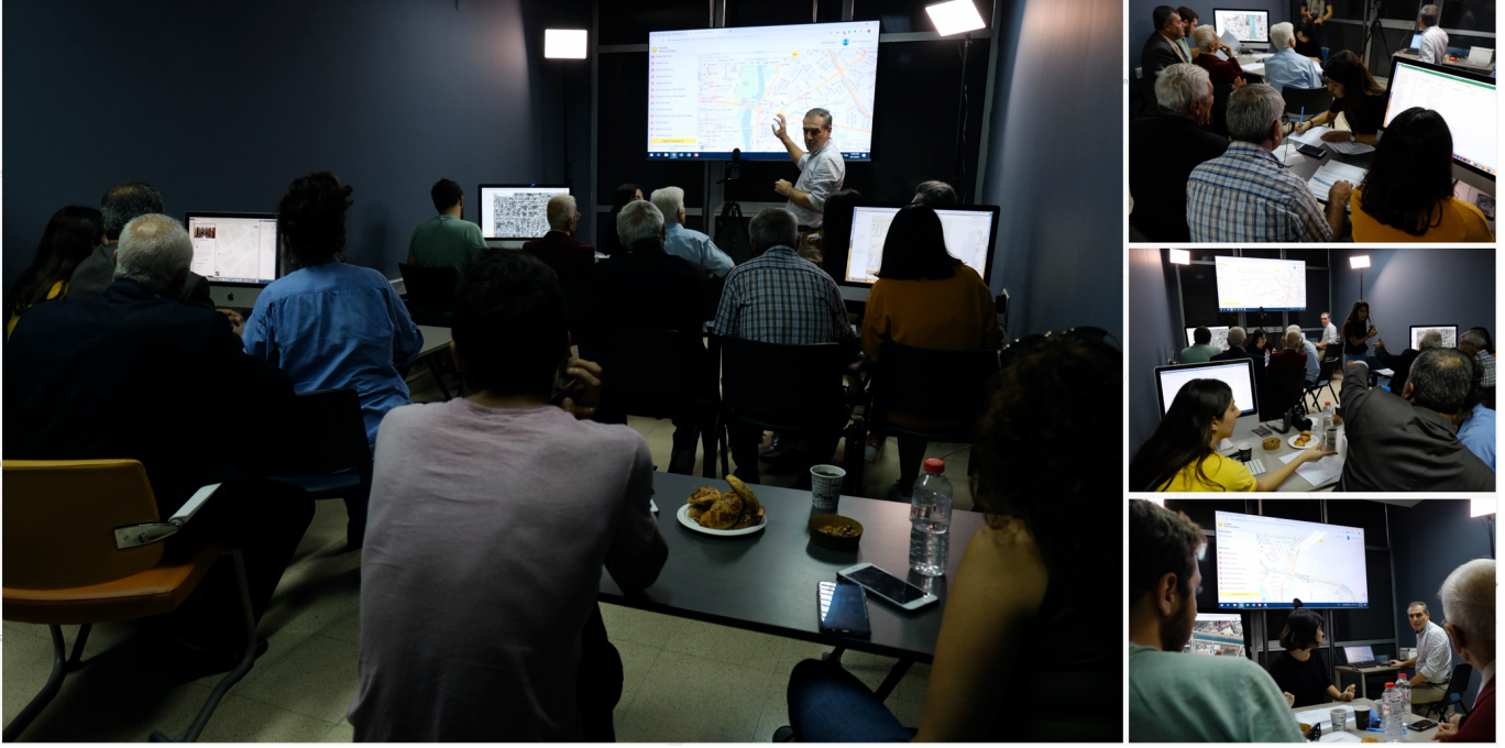
Şekil 2: Datathon çalışma istasyonları ve ana veri kaynağı ve veri derleyici olarak çalışmada yer alan katılımcılar (Fotoğraflar Ahmet Keçili, Ebru Özhayma ve Hakan Çelik tarafından çekilmiştir).